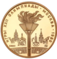
704 600 €