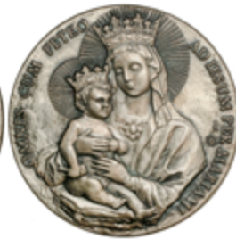
868 60 €