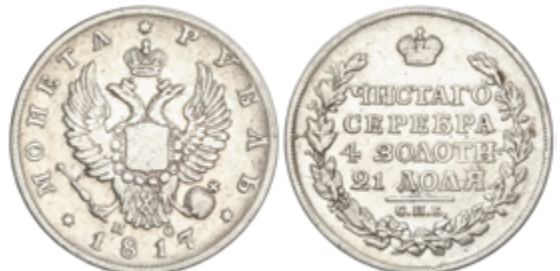
596 75 €