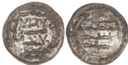
130 55 €