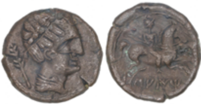
25 90 €