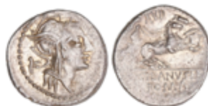
43 75 €