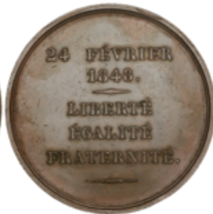
539 60 €