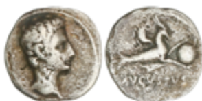
60 75 €