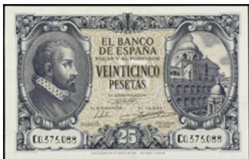
740 150 €