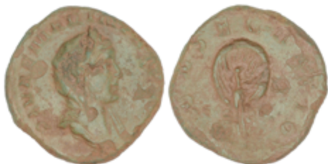
92 150 €