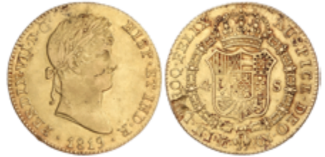
214 550 €