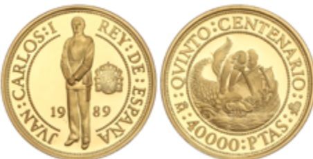
662 650 €