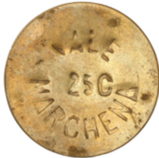
303 75 €