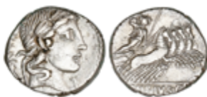
57 50 €