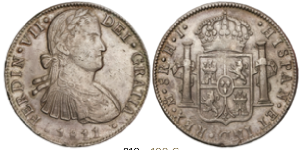
210 100 €