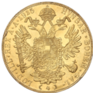
672 650 €