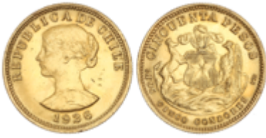
674 450 €