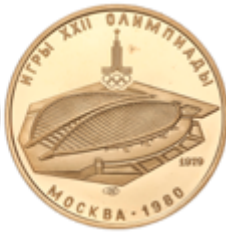
702 600 €