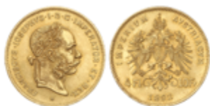
670 140 €