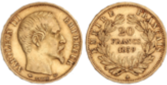
684 280 €