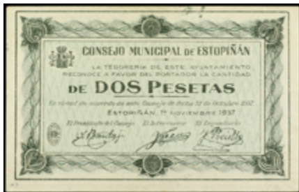
802 70 €