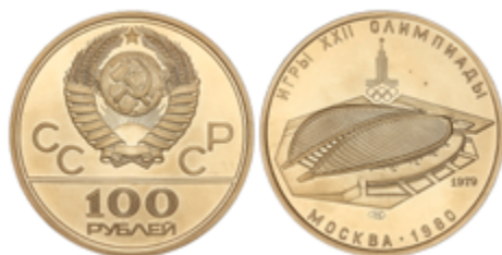
600 700 €