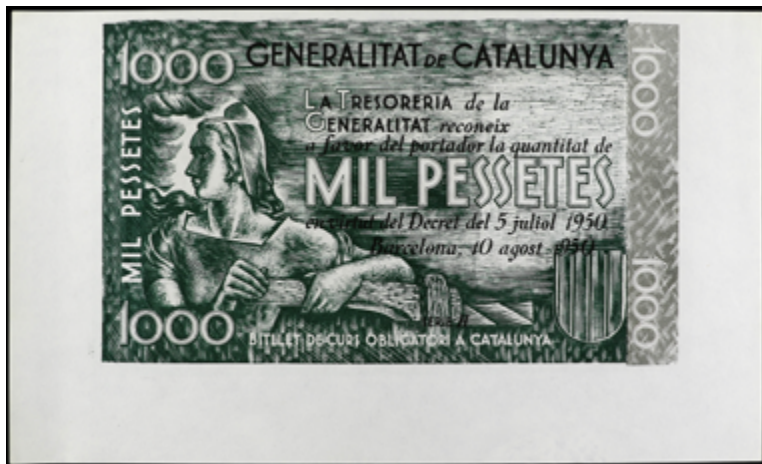
724 50 €