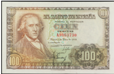
749 50 €