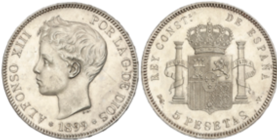
272 90 €