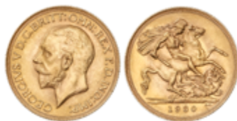
609 350 €