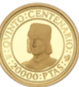
364 300 €