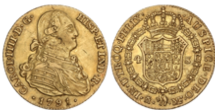
195 550 €