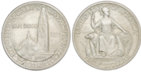
501 85 €