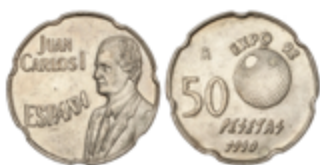
331 50 €