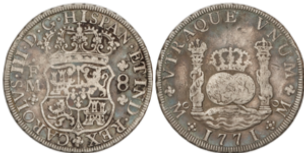
184 150 €