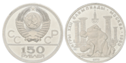
601 400 €