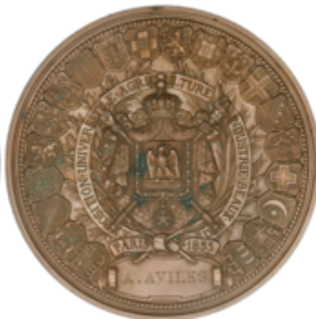
540 60 €