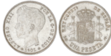
264 85 €