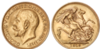
689 350 €