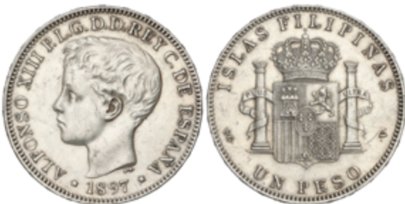
275 90 €