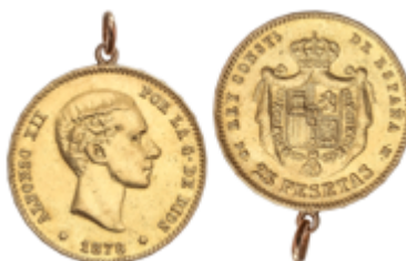
254 325 €