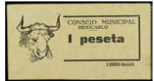
818 35 €