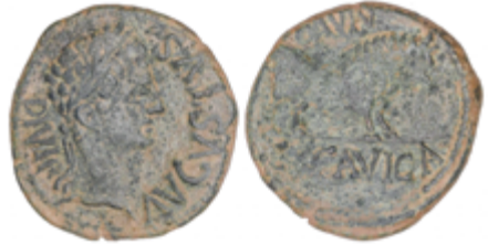
14 70 €