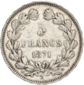
526 100 €