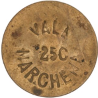
302 75 €