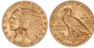
677 350 €