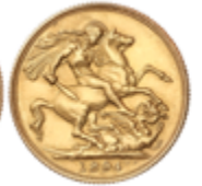
546 325 €