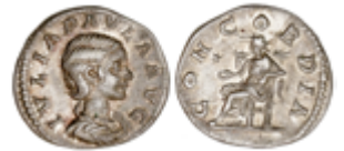
80 100 €