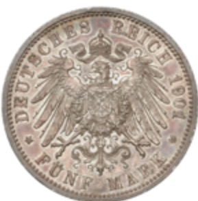
405 90 €