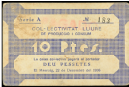
793 150 €