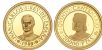
660 300 €