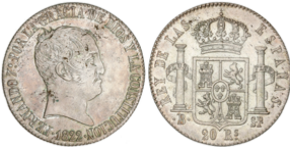
212 700 €