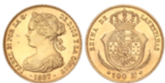
230 350 €