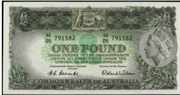
822 100 €