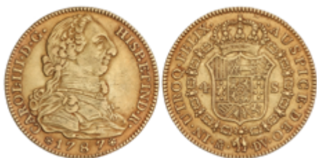
188 600 €