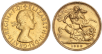
690 700 €