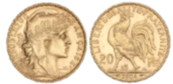
686 250 €