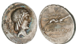
37 60 €