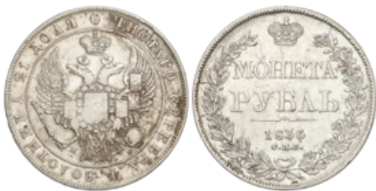
597 95 €