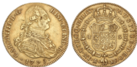
196 550 €