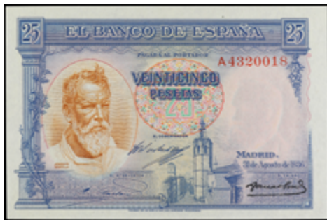
718 150 €