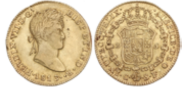
213 900 €