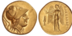
5 2.000 €