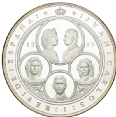
360 75 €