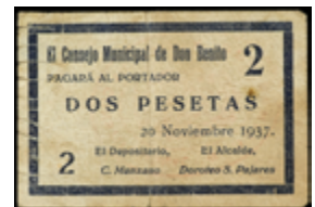
811 80 €