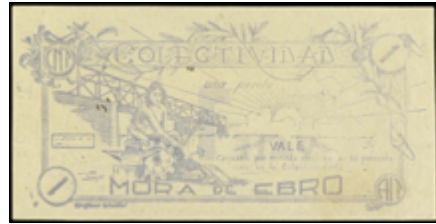
794 80 €