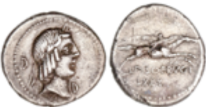
33 70 €