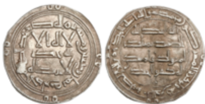
129 55 €