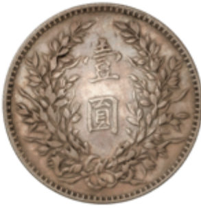
437 40 €