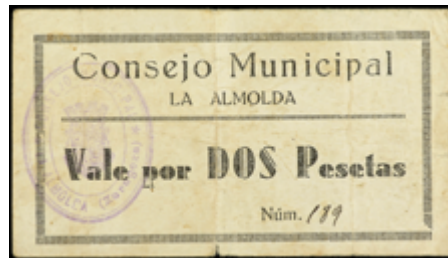
797 80 €