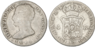
207 60 €