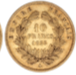
528 140 €