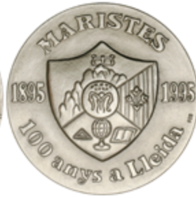
867 50 €