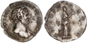
68 60 €