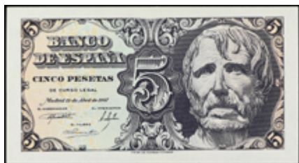
732 50 €