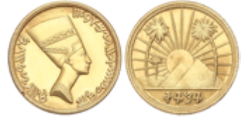
490 225 €