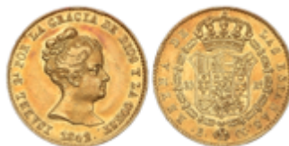
228 290 €