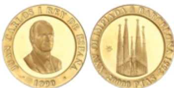
357 300 €