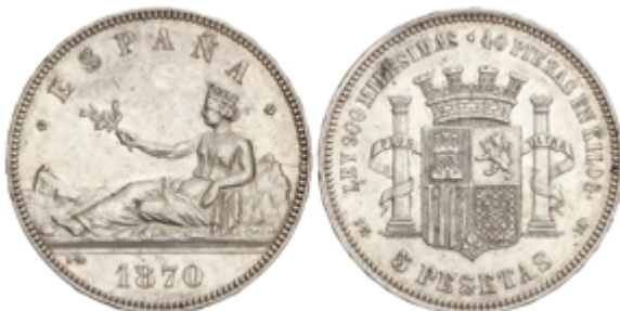
241 50 €