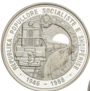
404 75 €