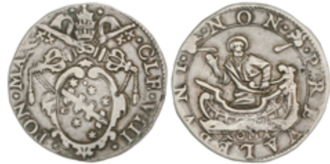
625 80 €