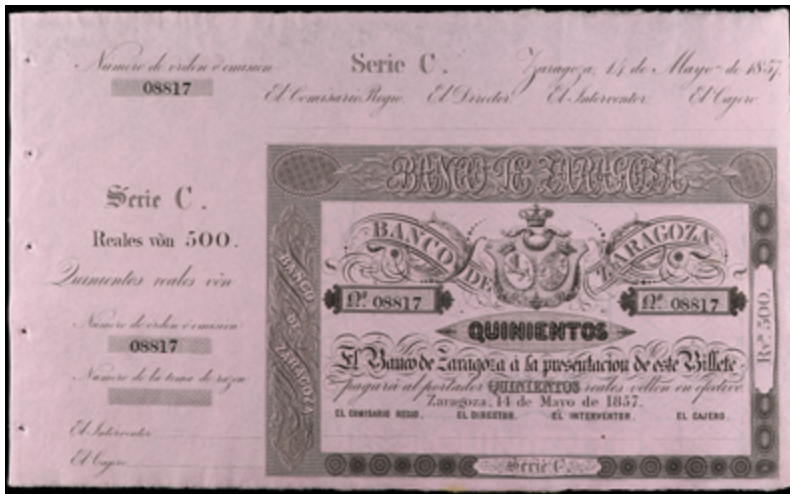
712 90 €