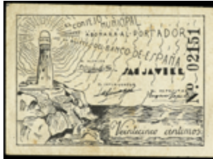
816 30 €