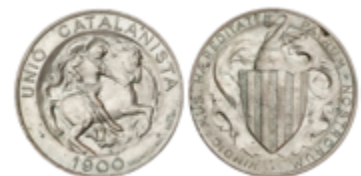
286 150 €