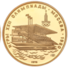
701 600 €