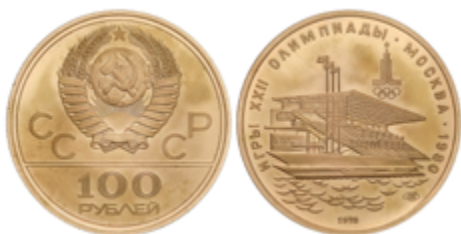
599 700 €