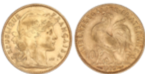
532 140 €