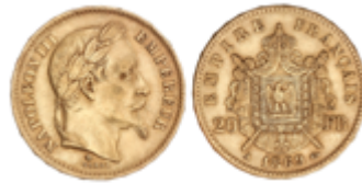
685 280 €