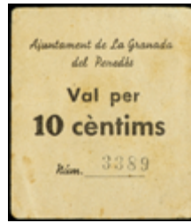
792 60 €