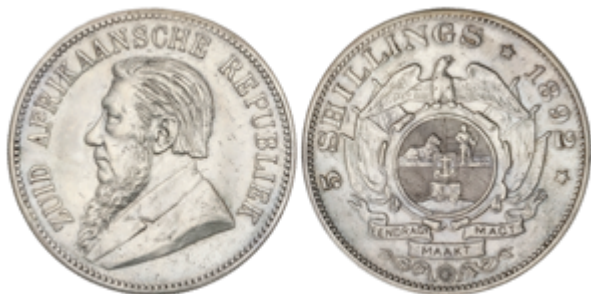
608 75 €