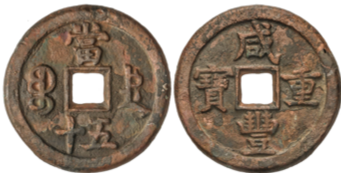
435 225 €