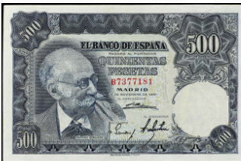
756 50 €