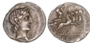
54 65 €