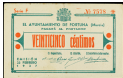
814 65 €