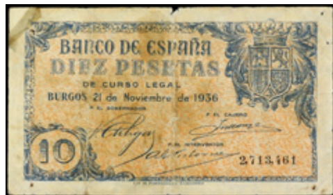
733 250 €