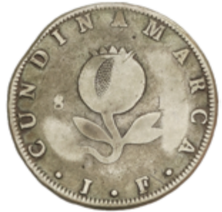
442 50 €