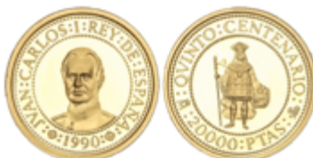
667 300 €