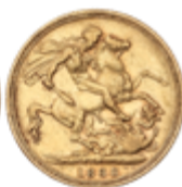
412 350 €