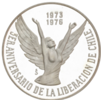
432 50 €