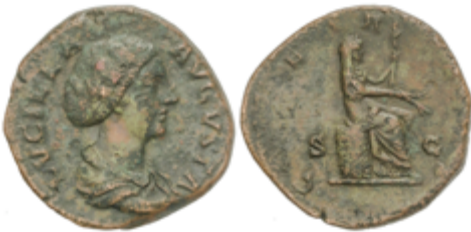
73 90 €