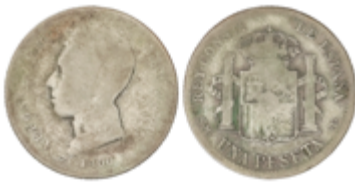
287 50 €