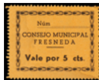
803 75 €