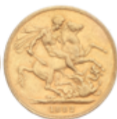
411 350 €