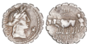
46 60 €