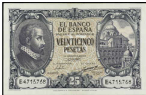
739 60 €