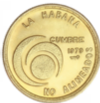
479 500 €