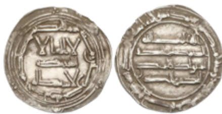
118 65 €