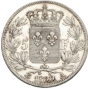
524 80 €