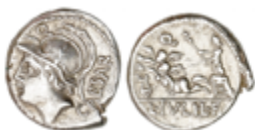
41 120 €