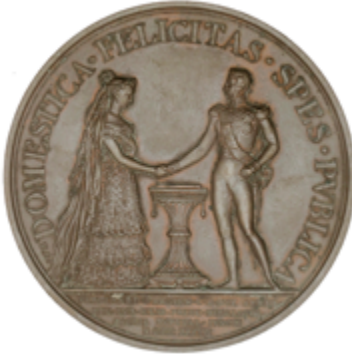
538 60 €