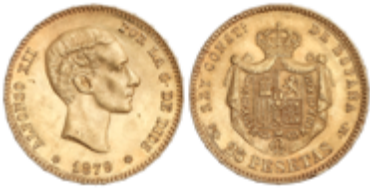
256 350 €