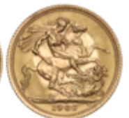
548 350 €