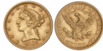
511 350 €