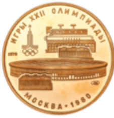
700 600 €