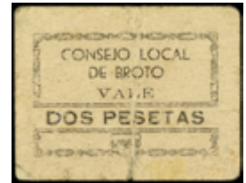
800 50 €