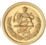
558 350 €