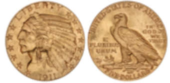
678 350 €