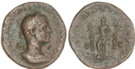
78 175 €