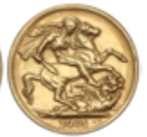
545 130 €