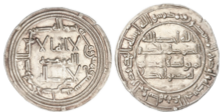
117 75 €