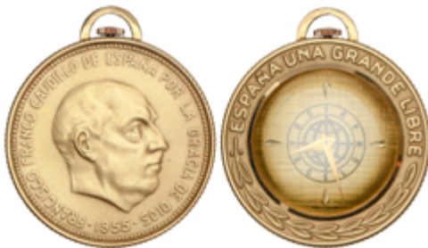
326 175 €