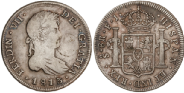
211 125 €