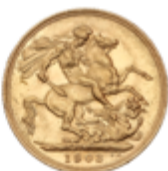
413 350 €