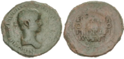
64 275 €