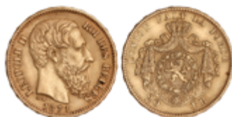
423 280 €