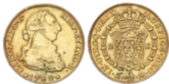
187 130 €