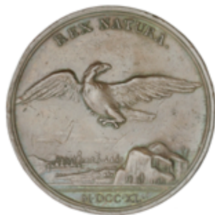
406 50 €