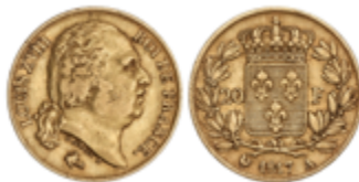
533 280 €