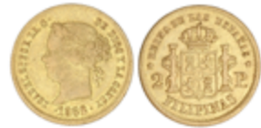
226 120 €