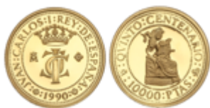
373 150 €