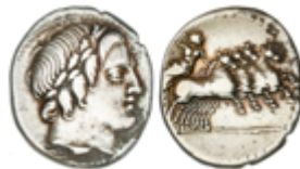
31 50 €