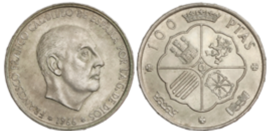
316 100 €