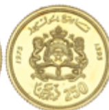
577 275 €