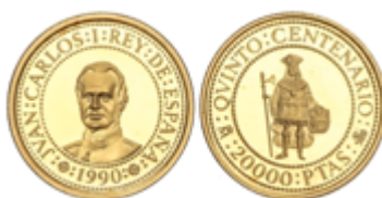
374 300 €