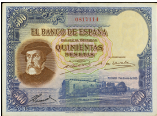
720 150 €