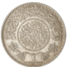
409 50 €