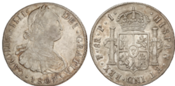
194 80 €