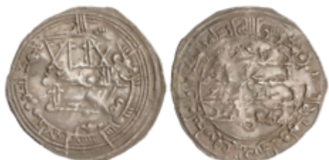
154 80 €