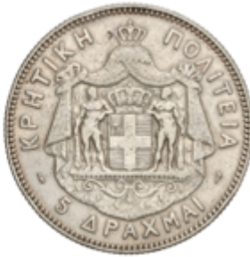
444 70 €