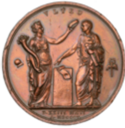
535 50 €