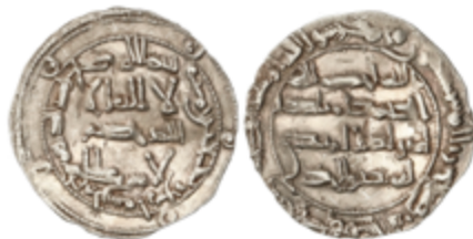
127 50 €