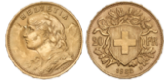
617 250 €