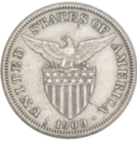
519 80 €