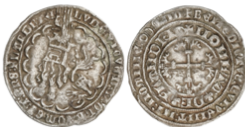
422 75 €