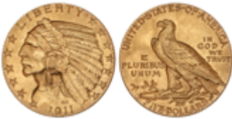
679 350 €