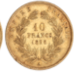
530 140 €