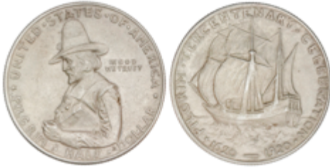
496 50 €