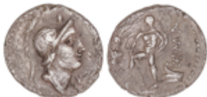
50 50 €