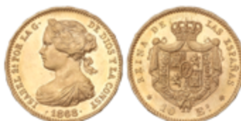
231 350 €