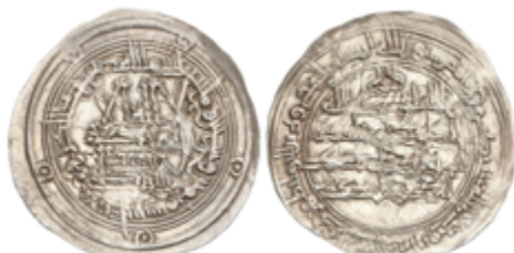
155 80 €