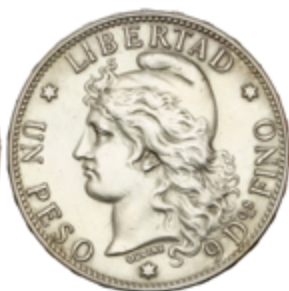
410 100 €