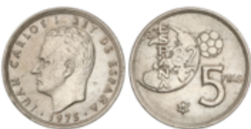
328 70 €