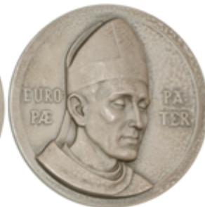
871 50 €