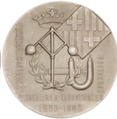
859 70 €