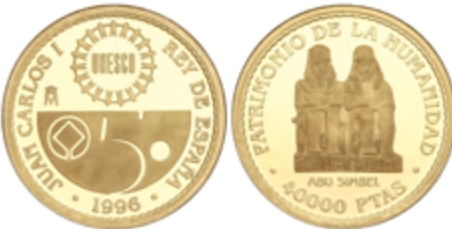
658 570 €