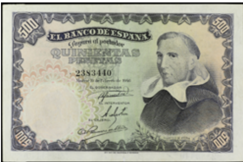
754 100 €