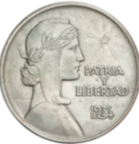
446 50 €