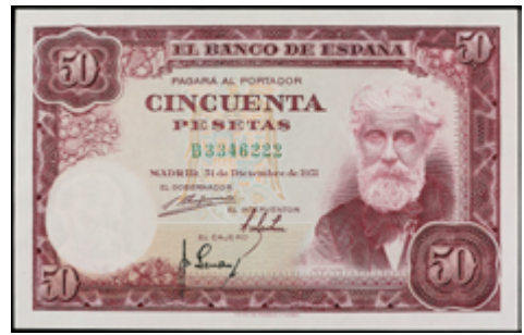
745 50 €