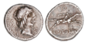
35 65 €