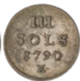
570 65 €