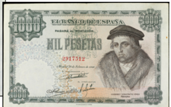
759 50 €