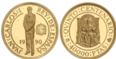
668 650 €