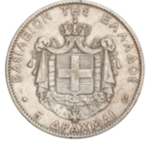
550 60 €