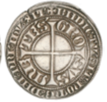
522 300 €