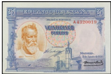
719 150 €