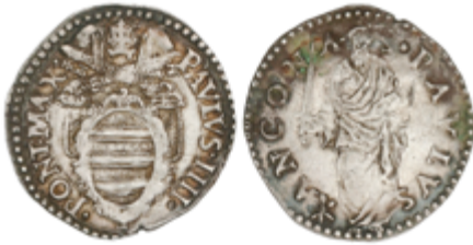
623 80 €