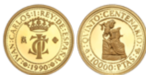
665 150 €