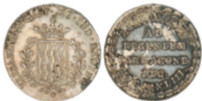
233 50 €