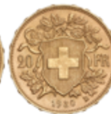
710 270 €