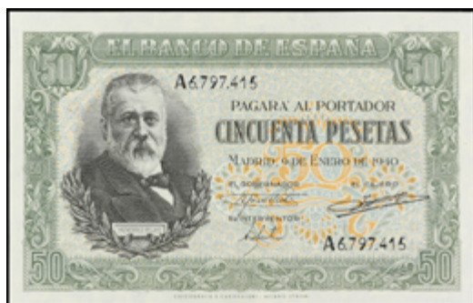
743 50 €