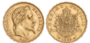
534 250 €