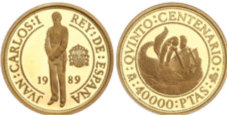
661 650 €