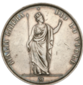
563 75 €