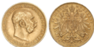
671 280 €