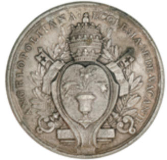
204 75 €