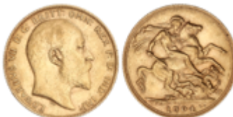
687 350 €