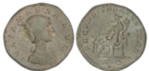
81 135 €