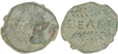
26 50 €