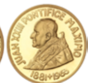
904 300 €