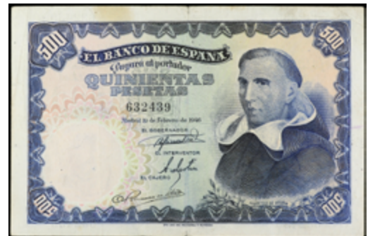
755 75 €