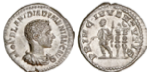
79 500 €