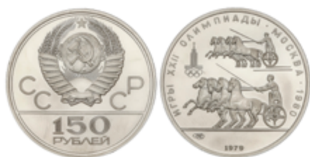
602 400 €