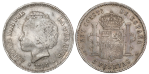
288 60 €