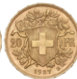
709 250 €