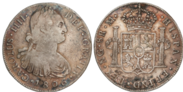
193 75 €