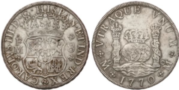
183 110 €