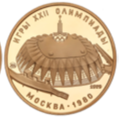
703 600 €