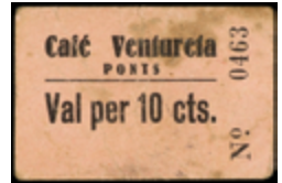
795 50 €