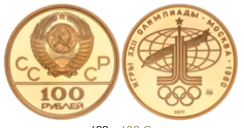
699 600 €