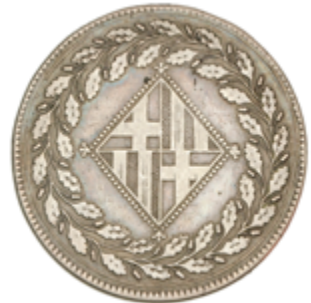
206 200 €