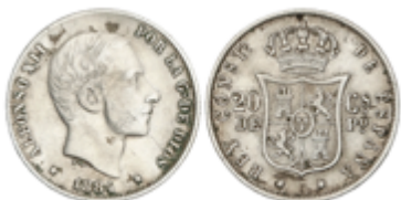
247 90 €