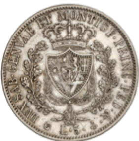
566 80 €