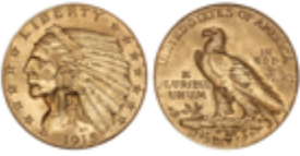
676 180 €