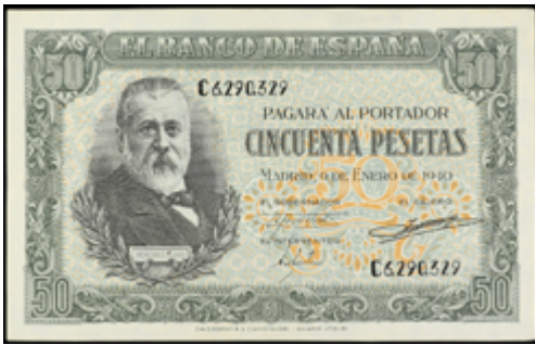
744 50 €