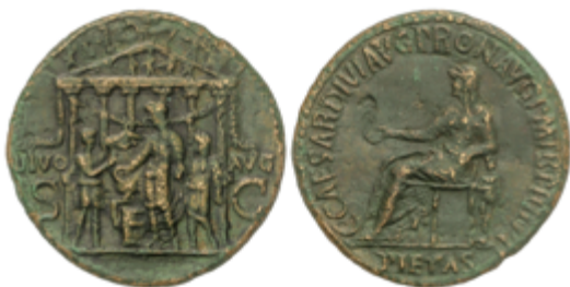
63 360 €