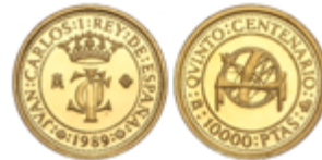
659 150 €