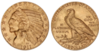
512 350 €