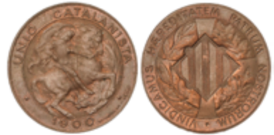
278 70 €