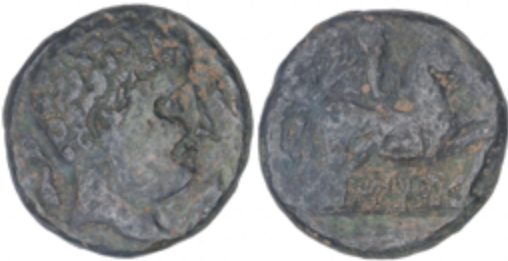
15 70 €