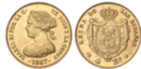
225 150 €