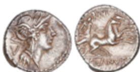
45 75 €