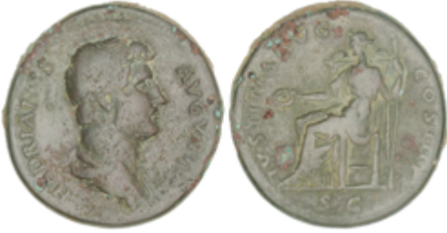
66 50 €