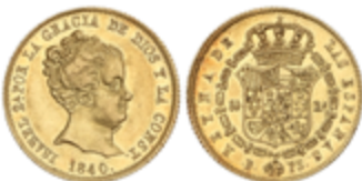
227 290 €