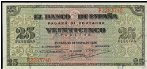
738 50 €