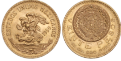
693 750 €