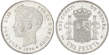
263 60 €