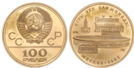
598 700 €