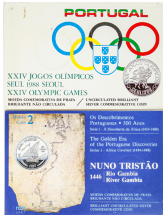
590 125 €