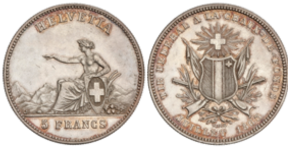
616 100 €