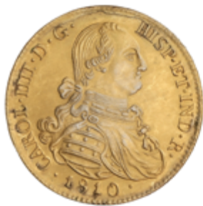
203 950 €