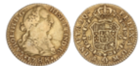
186 150 €