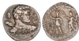
39 60 €