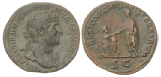
67 275 €