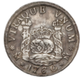
182 100 €