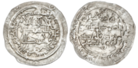
158 80 €