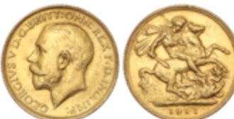
688 325 €