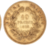
529 140 €