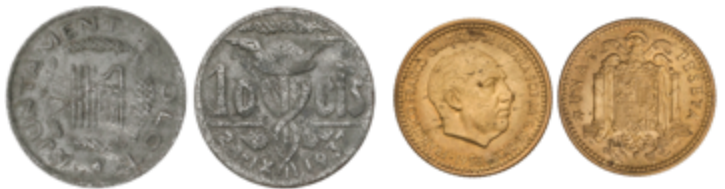
307 100 €