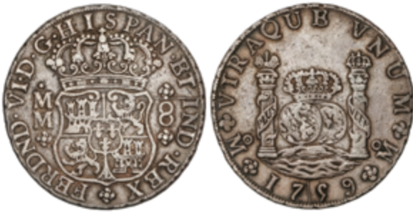
180 125 €