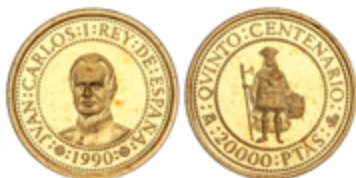
666 300 €