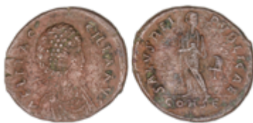
111 50 €