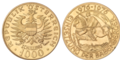
417 575 €