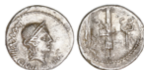
49 50 €