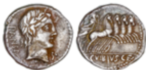
55 80 €