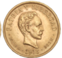
471 750 €