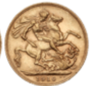
547 350 €