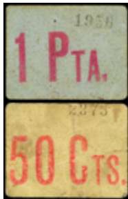
796 70 €