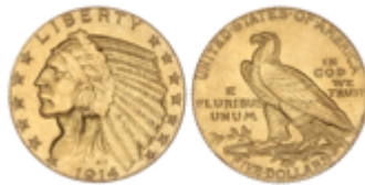
680 350 €