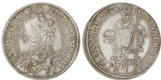
415 400 €