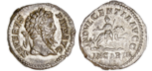
75 100 €