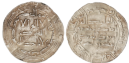
126 50 €