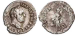
65 120 €