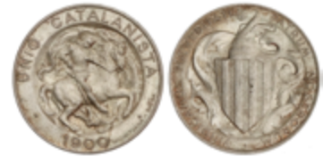
285 150 €