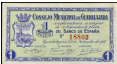
807 40 €