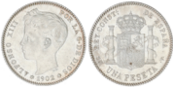
265 125 €