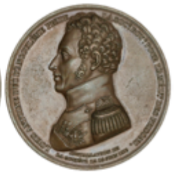
537 60 €