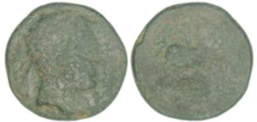
16 60 €