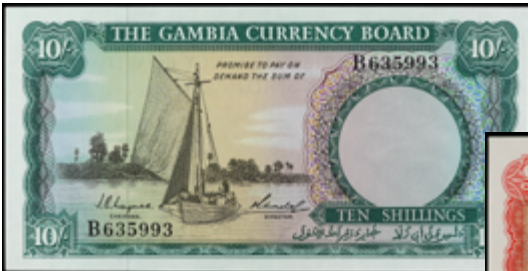
823 110 €