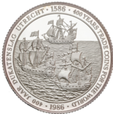
554 90 €