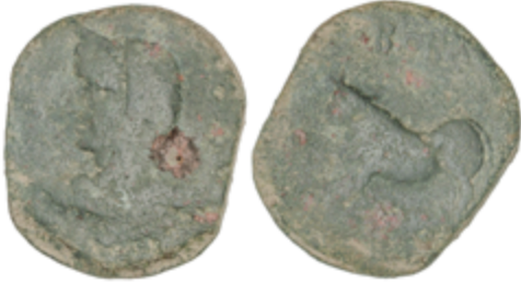
10 50 €