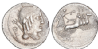
42 60 €