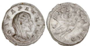
83 400 €