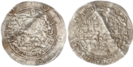
157 75 €