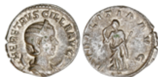
87 50 €