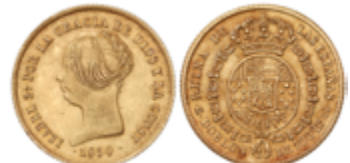
229 400 €