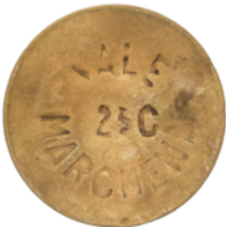
305 50 €