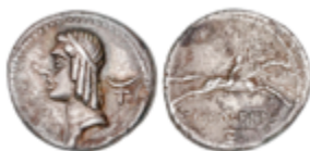
38 60 €