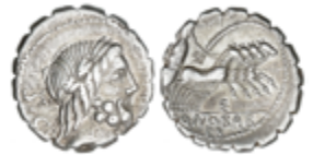
32 60 €