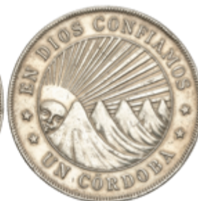
583 50 €