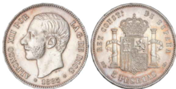
249 125 €