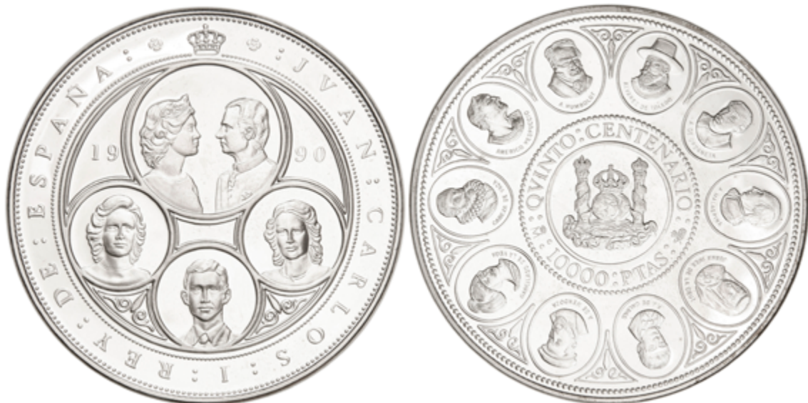
370 75 €