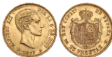
252 350 €