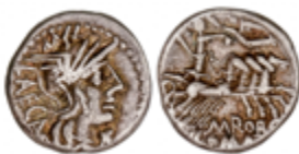
51 60 €