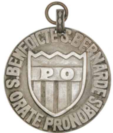
872 100 €