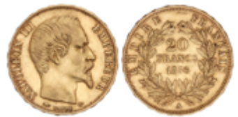
683 280 €