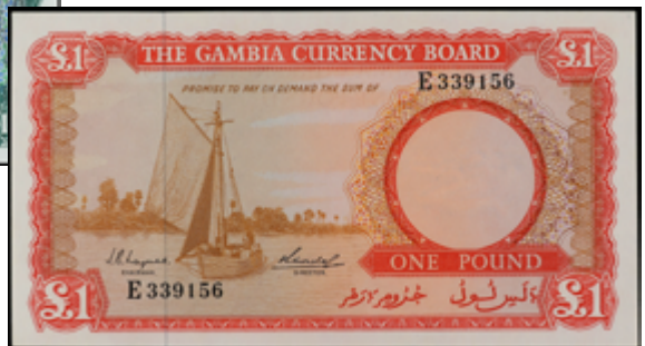
824 110 €