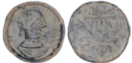
29 50 €