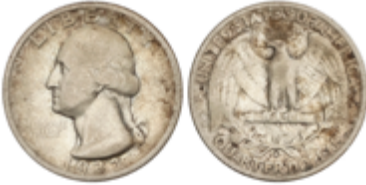
493 70 €