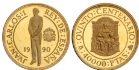
375 650 €