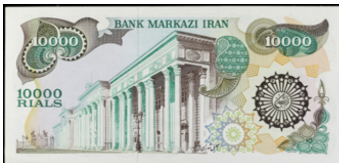
826 50 €