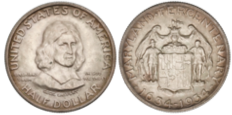
500 50 €