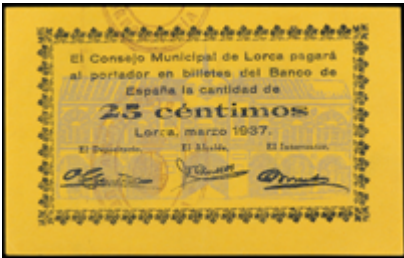
815 35 €