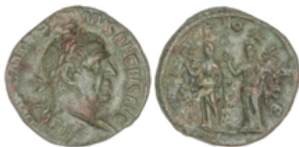
86 120 €