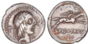
34 60 €