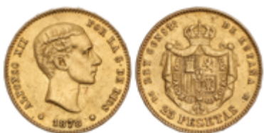
253 300 €