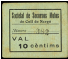
790 90 €