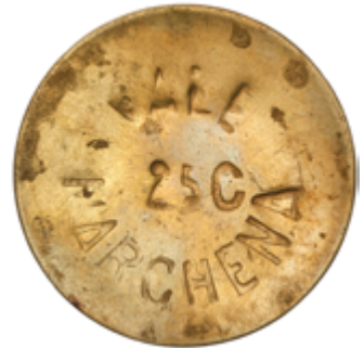
304 75 €