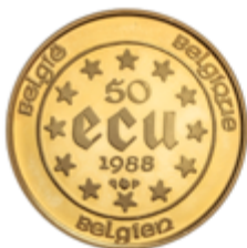
673 800 €