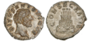
71 50 €