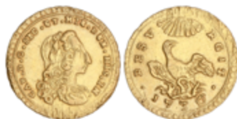
190 400 €