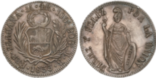
589 70 €