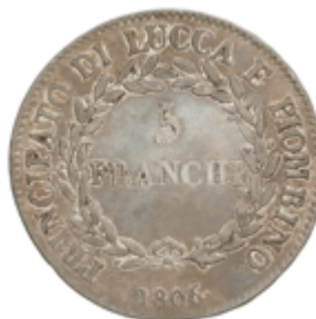
564 90 €