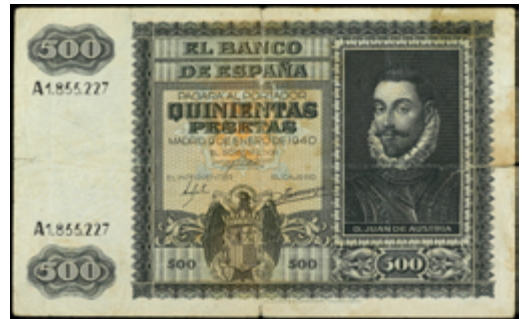
752 50 €