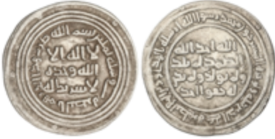
166 50 €