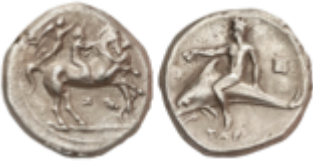
2 100 €