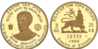
516 350 €