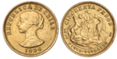
675 450 €