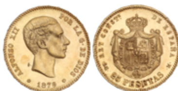
255 300 €