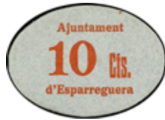
791 60 €