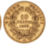
531 140 €