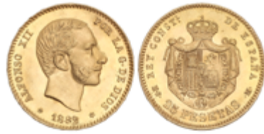
257 380 €