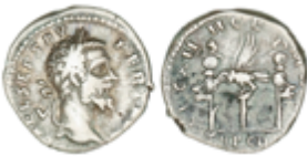
76 60 €