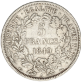
525 50 €