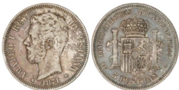
244 75 €