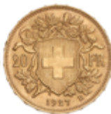
708 250 €