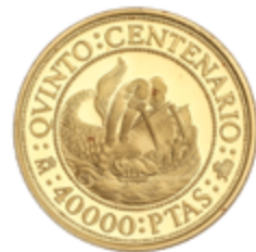
365 650 €