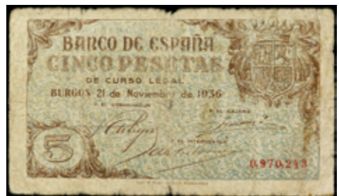
728 150 €