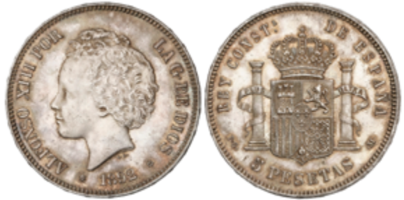
269 70 €