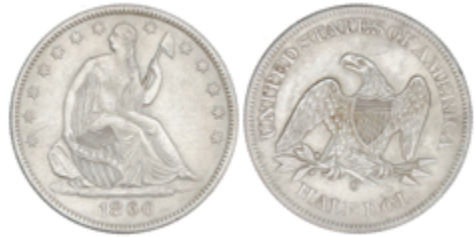
495 120 €