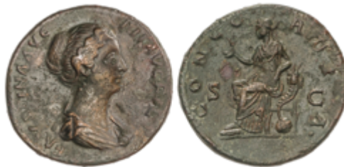
144 80 €