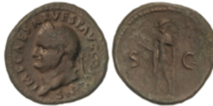
113 50 €