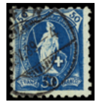
2416 60 €