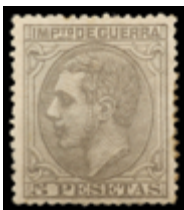
1265 50 €