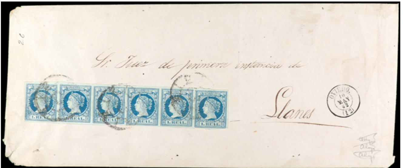
1138 750 €