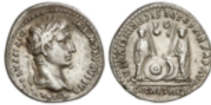
107 150 €