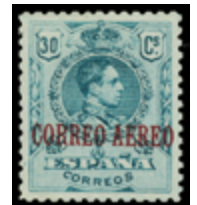
1336 100 €