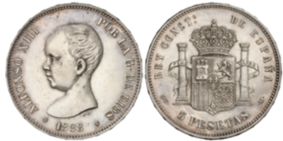
452 70 €