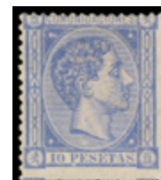
1246 390 €