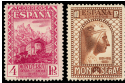
1421 220 €