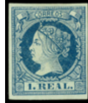
1136 225 €