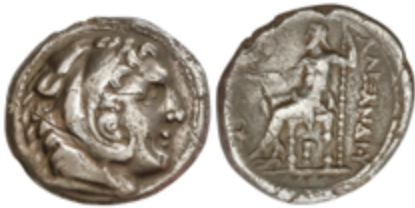
27 100 €