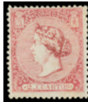
1192 80 €