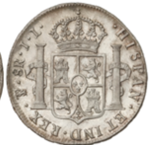
369 150 €