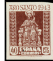
1598 80 €