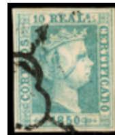
1022 500 €