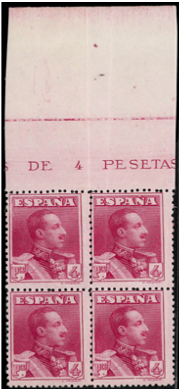
1350 120 €