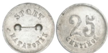
823 50 €