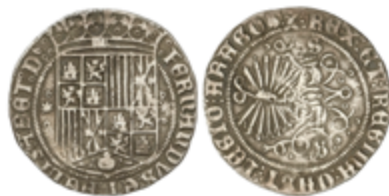
271 120 €