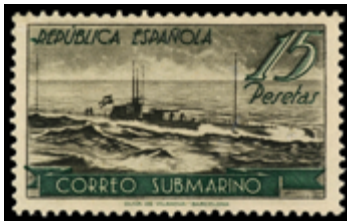
1502 100 €