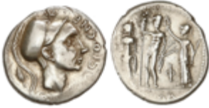
91 75 €