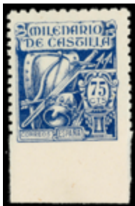
1600 120 €