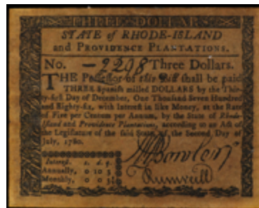
813 50 €