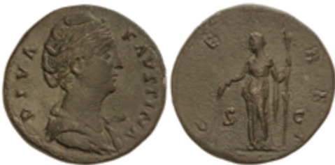
137 60 €