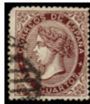
1207 60 €