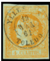
1122 100 €