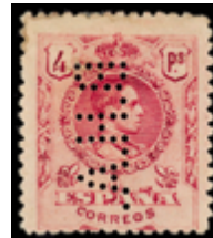
1324 600 €