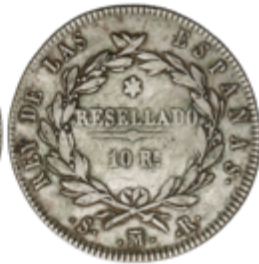
362 55 €