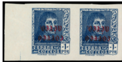
1562 700 €