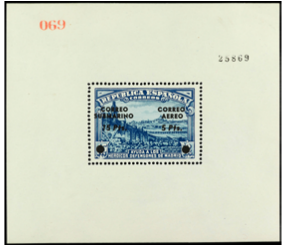
1477 120 €