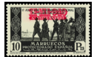
2065 90 €