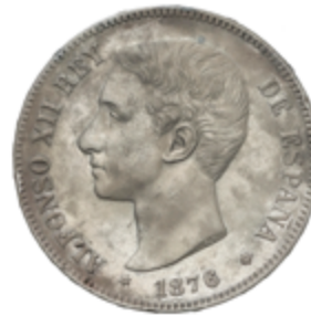
419 50 €