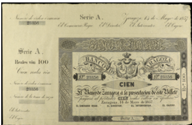
671 170 €