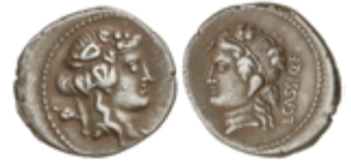
89 120 €