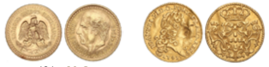
626 80 €