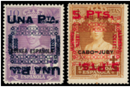
1379 250 €