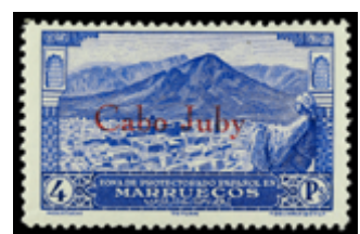
1991 100 €