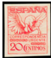
1443 250 €