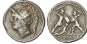
94 50 €