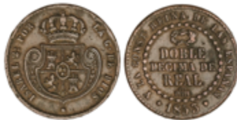
378 110 €