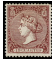
1198 390 €