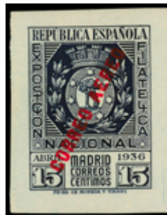
1464 140 €