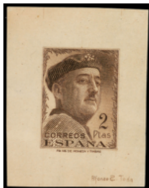
1610 150 €