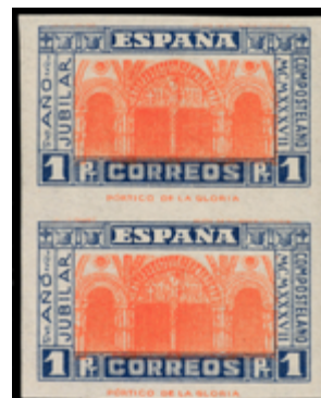
1535 50 €