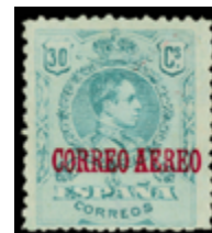
1337 100 €