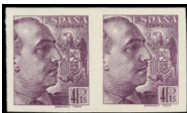
1580 400 €