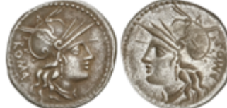
101 120 €