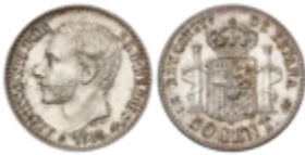
411 50 €