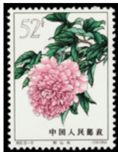
2190 110 €