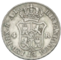
325 50 €