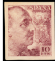
1596 100 €