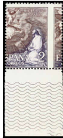
1672 50 €