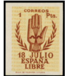
1576 260 €