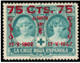
1370 100 €