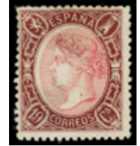
1190 600 €