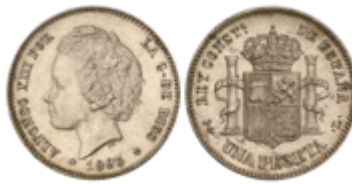
442 400 €