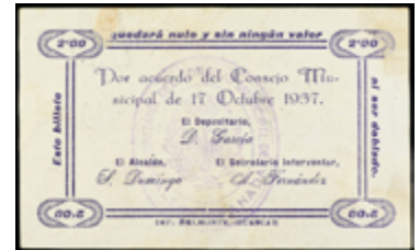
747 100 €