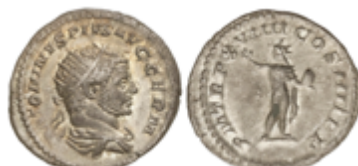
171 50 €