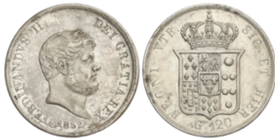
618 50 €