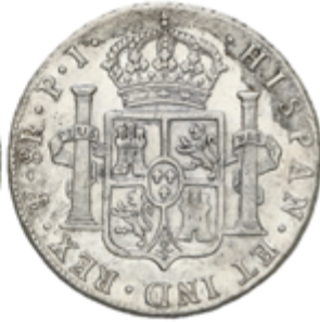
322 60 €