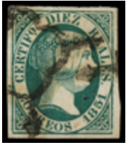
1030 150 €