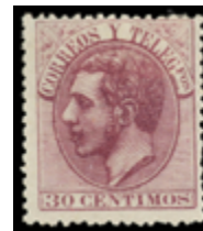
1272 90 €