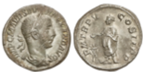
183 60 €