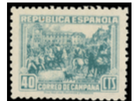
1518 100 €