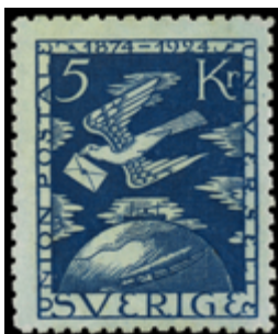
2411 90 €