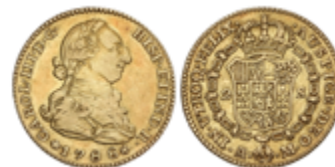
313 275 €