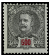
2366 80 €