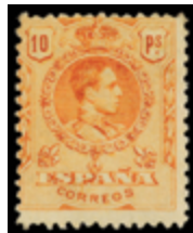
1316 60 €