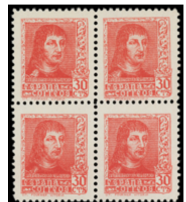
1540 90 €