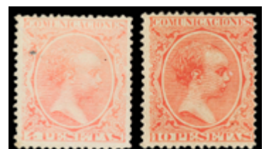
1279 200 €