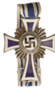
951 75 €