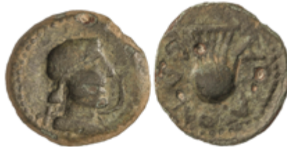
52 100 €