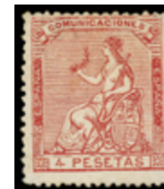
1232 80 €