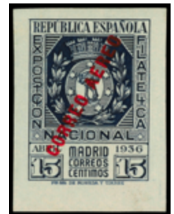
1466 75 €