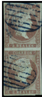
1064 40 €