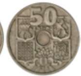
501 100 €