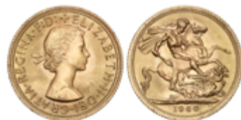
608 350 €