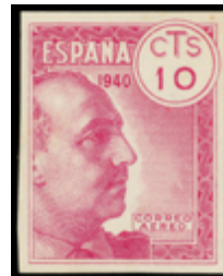
1597 240 €