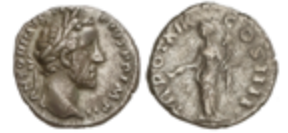
135 50 €