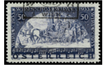
2159 90 €