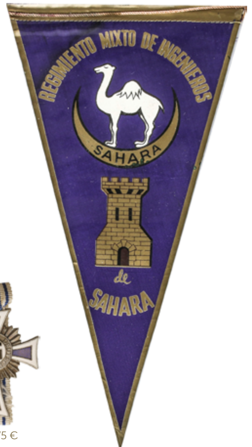
947 50 €