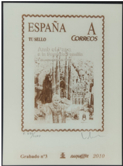
1709 75 €