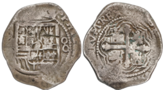
285 50 €