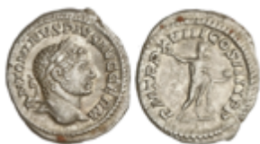
169 50 €