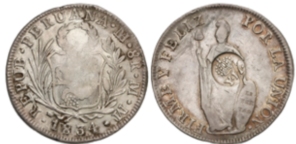
394 100 €