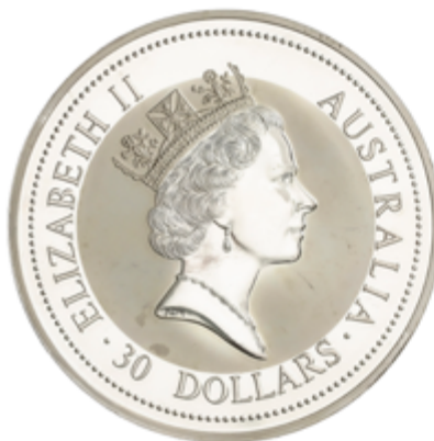
558 600 €