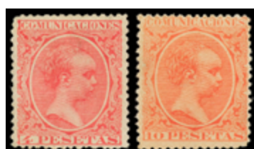
1278 275 €