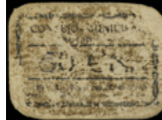
746 35 €