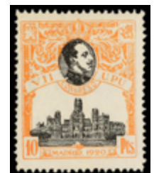
1338 90 €