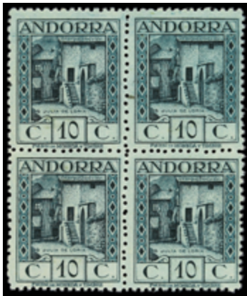
1977 320 €