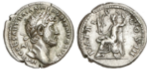
127 60 €