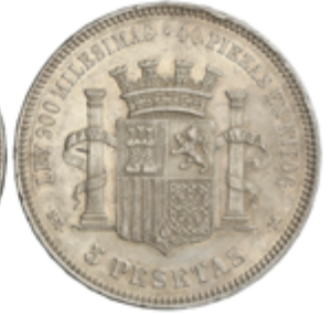
406 50 €