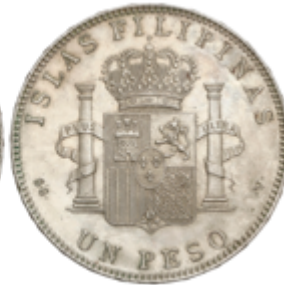
470 100 €