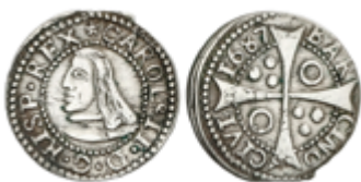
287 50 €