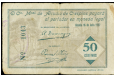
791 40 €