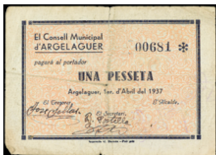
717 40 €