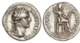
108 75 €