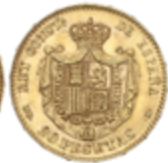
472 300 €