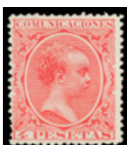
1286 150 €