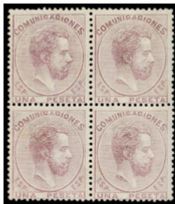
1229 50 €