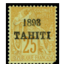
2263 500 €