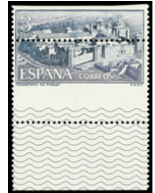
1674 50 €