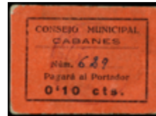
794 100 €