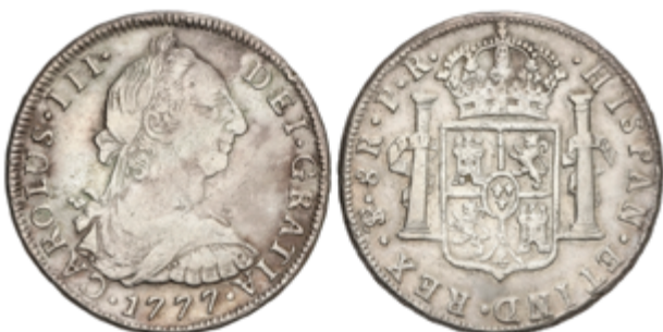
309 60 €