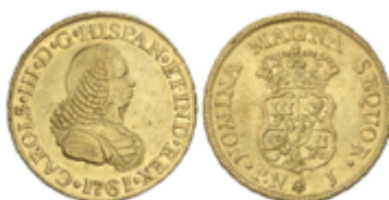
315 850 €