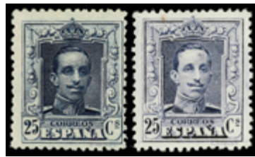
1352 70 €