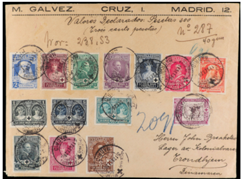
1358 50 €