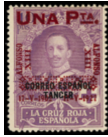
1375 150 €