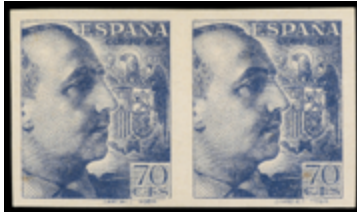
1592 200 €