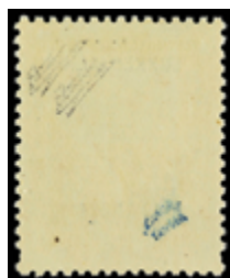
2092 55 €