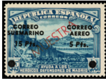
1478 70 €