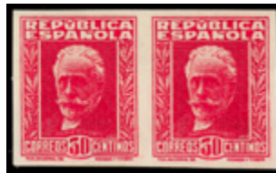
1430 60 €