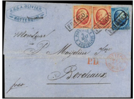
2288 120 €