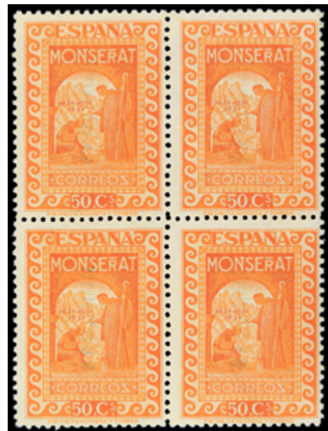
1423 70 €