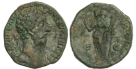
142 50 €