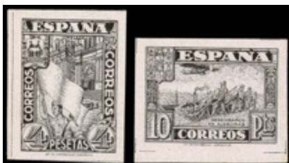
1528 250 €