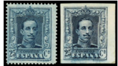
1355 50 €