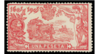
1307 125 €