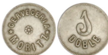
842 60 €