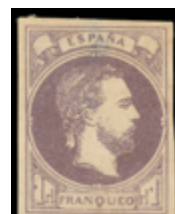
1244 30 €