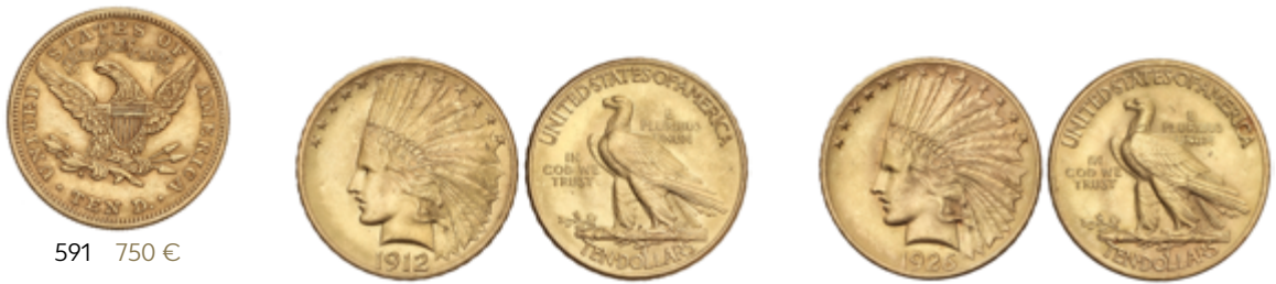
591 750 €