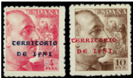
2040 300 €