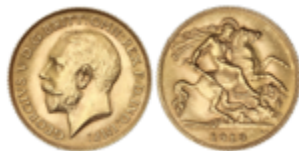
605 175 €