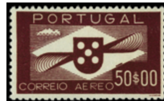
2383 100 €