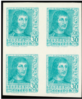
1544 80 €