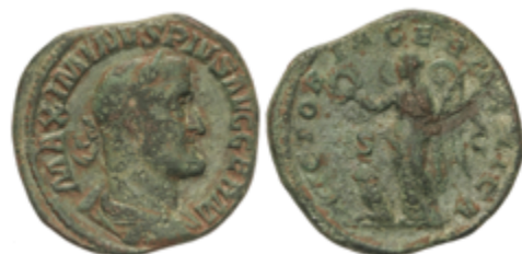
189 50 €