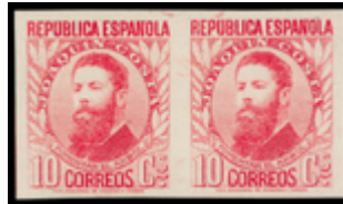
1433 70 €