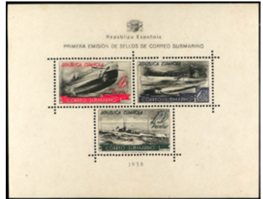
1501 130 €