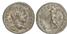
168 50 €