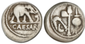
106 150 €