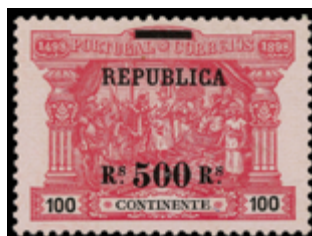
2369 50 €