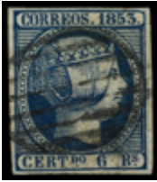
1044 120 €