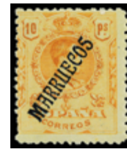
2053 50 €