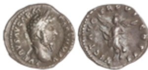
148 75 €