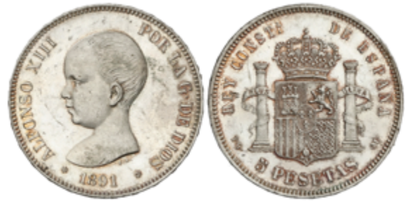
455 70 €