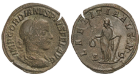
193 50 €