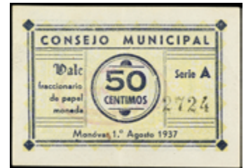
795 30 €