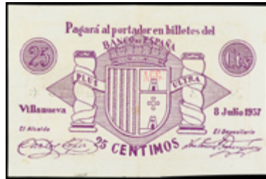
787 35 €