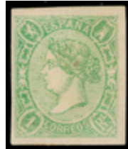
1185 120 €