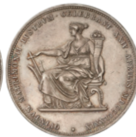
559 50 €