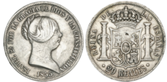
392 70 €