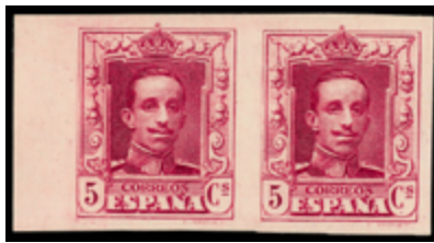
1341 550 €