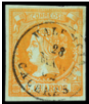
1115 50 €