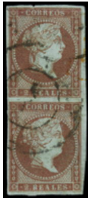
1063 60 €