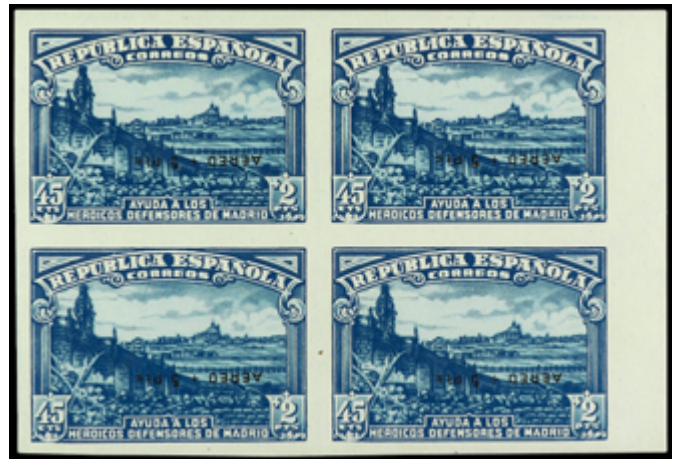
1479 450 €