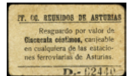
763 35 €