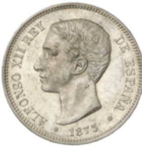
417 120 €