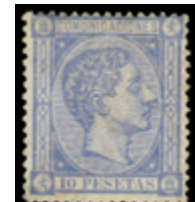
1247 490 €