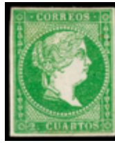
1072 250 €