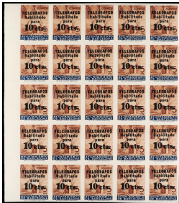
1789 100 €