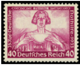
2113 90 €