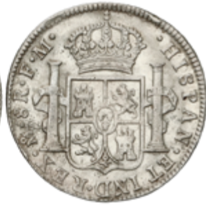
320 50 €