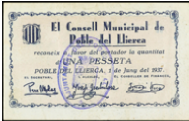
739 30 €