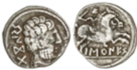
49 60 €