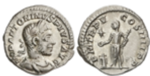
174 70 €