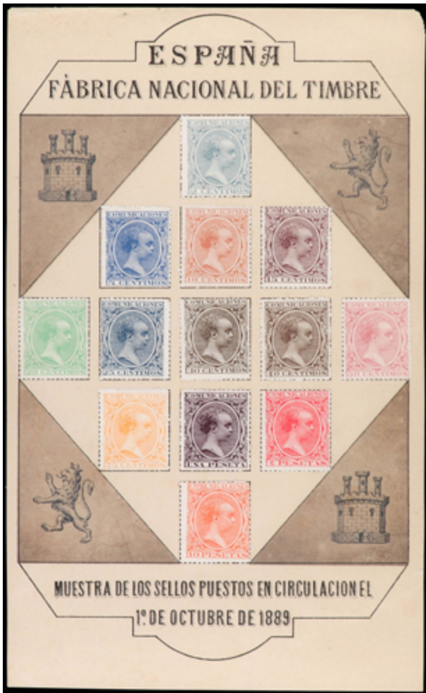
1276 600 €