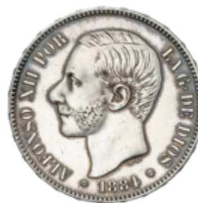
424 70 €