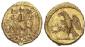
7 700 €