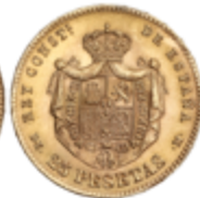
514 350 €