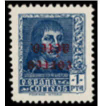
1560 250 €