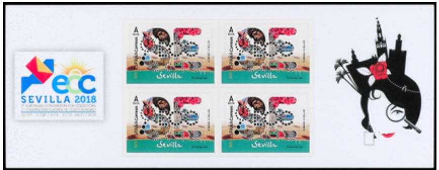
1712 70 €