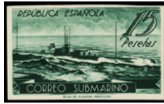
1498 190 €