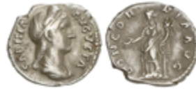
128 100 €