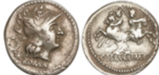
98 50 €