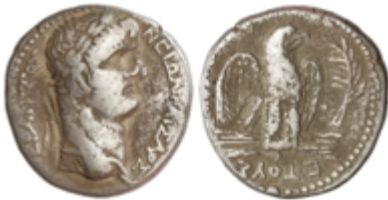
111 60 €