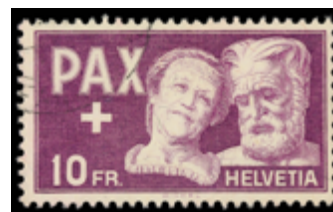
2426 100 €