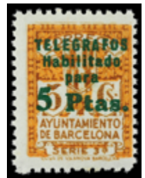
1787 50 €