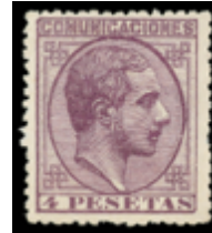
1257 100 €