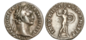
120 60 €