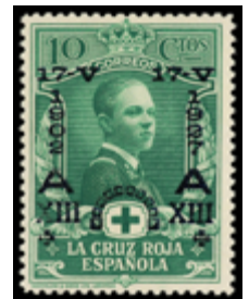
1365 50 €