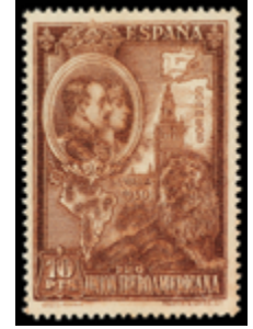
1399 55 €