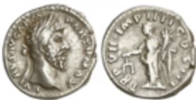
147 50 €