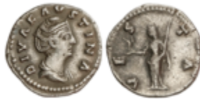
141 50 €