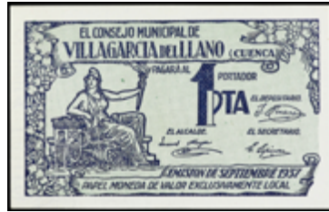
772 35 €