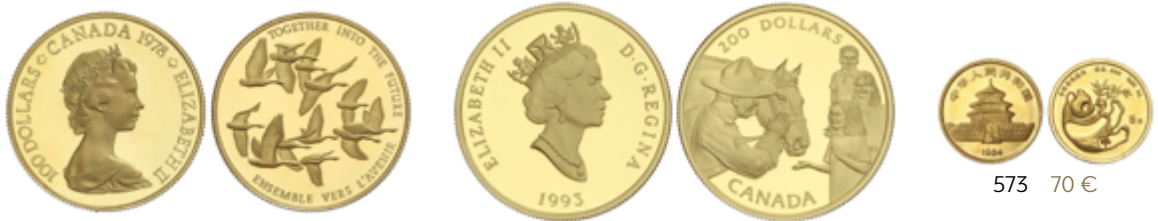
568 740 €