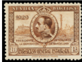
1382 50 €