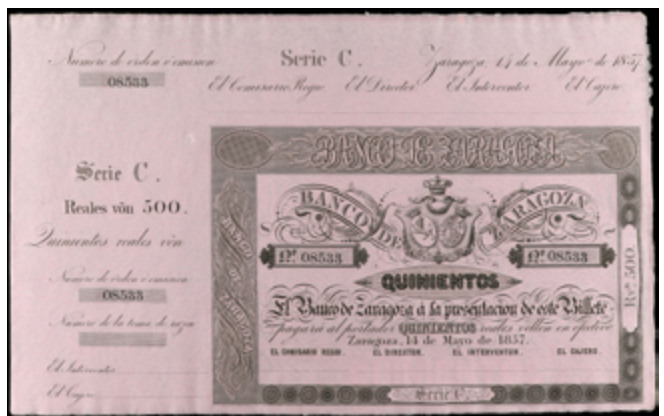
672 200 €