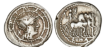
83 50 €