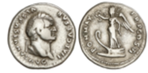
116 50 €