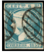
1038 120 €