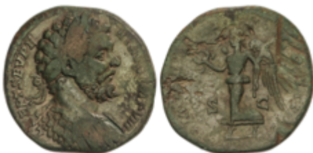
158 150 €