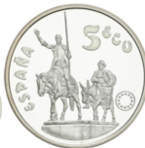
548 60 €