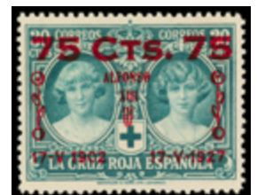
1369 160 €