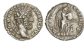
155 70 €