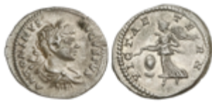
170 70 €