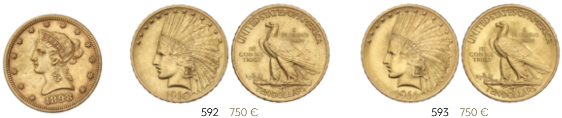
592 750 €