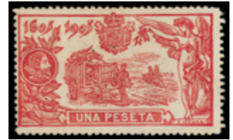
1305 160 €