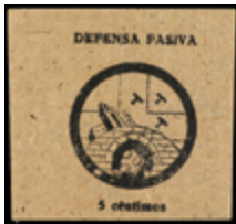
784 30 €