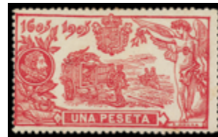
1309 60 €