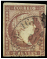
1071 50 €