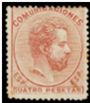
1224 140 €