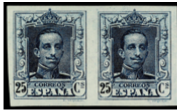
1354 390 €