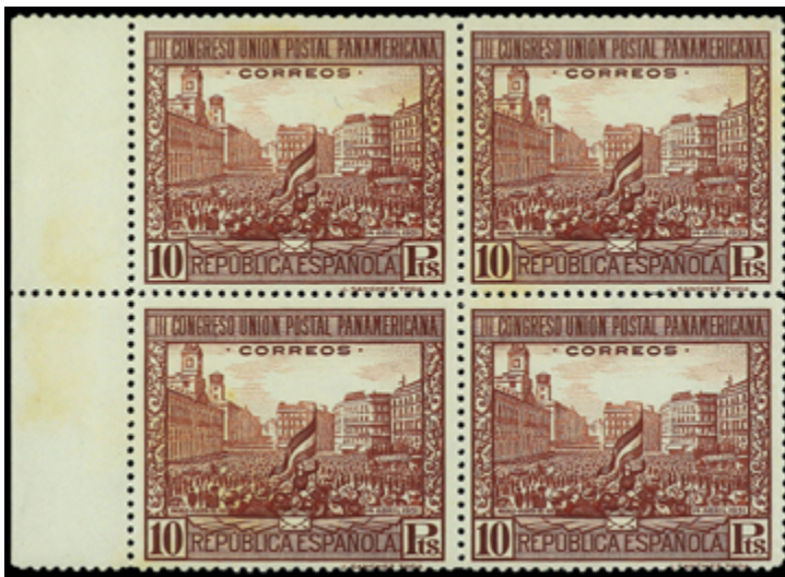
1417 100 €