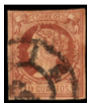
1134 95 €