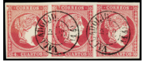
1100 50 €