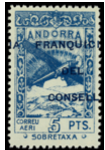
1799 60 €