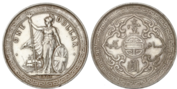
604 80 €