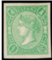
1184 200 €