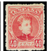
1297 75 €