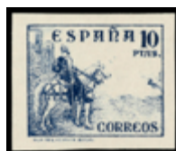
1534 55 €