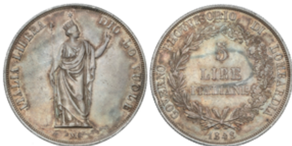
617 50 €