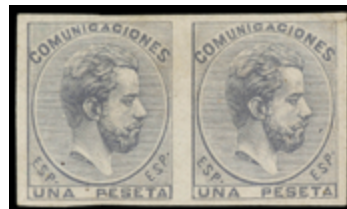
1230 90 €