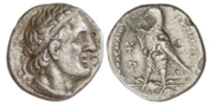
35 90 €