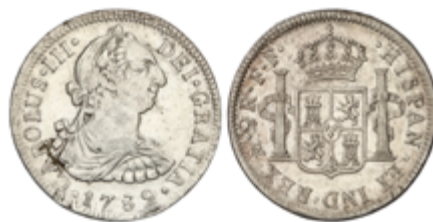
306 50 €