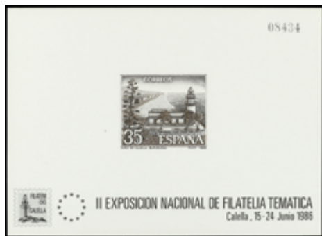
1731 190 €