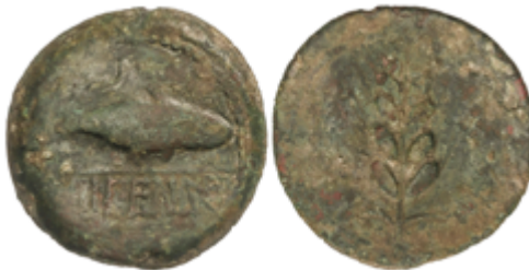
65 50 €