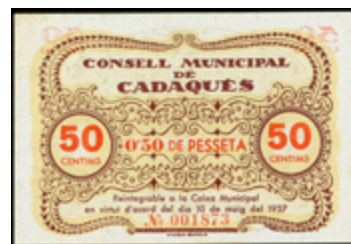
723 60 €