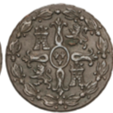
349 50 €