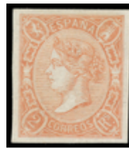
1187 250 €