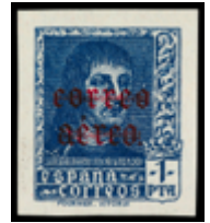
1558 120 €