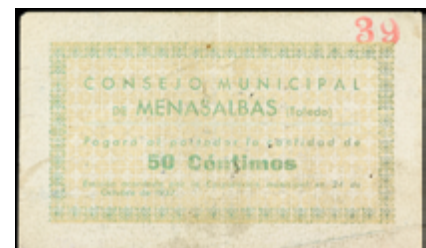
768 120 €