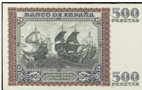
699 200 €