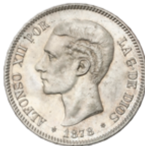
421 60 €