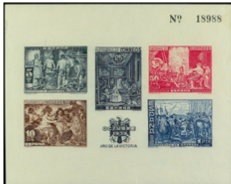
1807 50 €