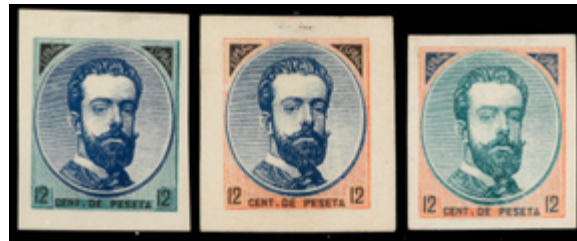
1227 180 €