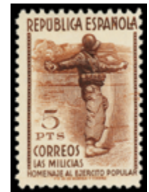
1511 130 €