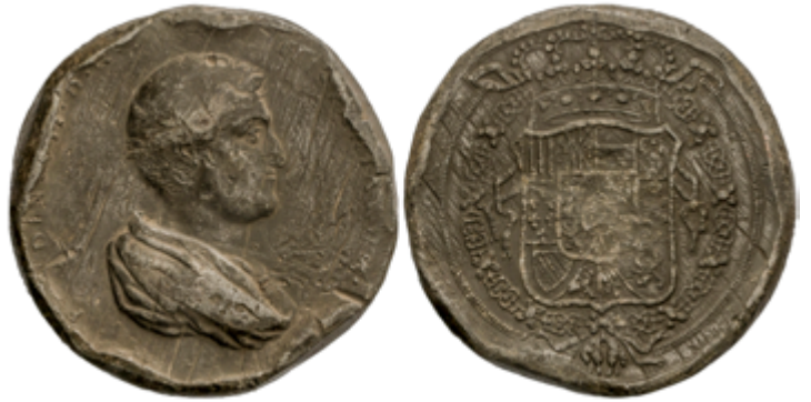
373 100 €