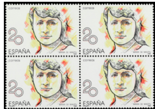
1686 60 €