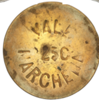
496 75 €