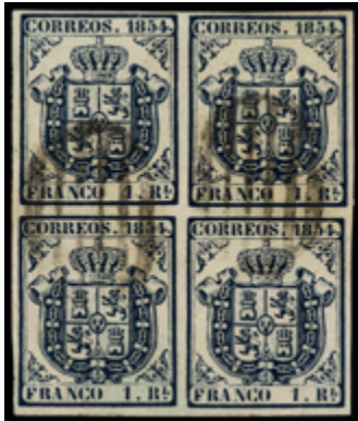
1057 750 €