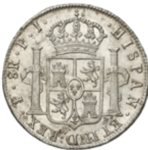
368 150 €