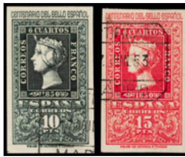
1637 50 €