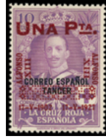
1376 175 €