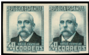
1437 60 €