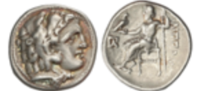
32 100 €