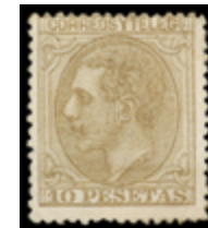
1262 320 €