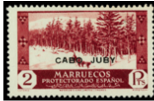
1992 150 €