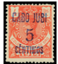
1986 80 €