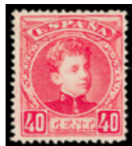
1296 110 €