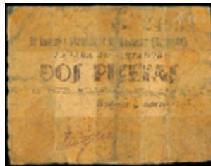
750 40 €