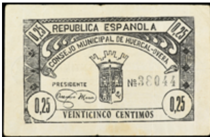
749 50 €