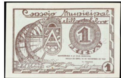
760 90 €