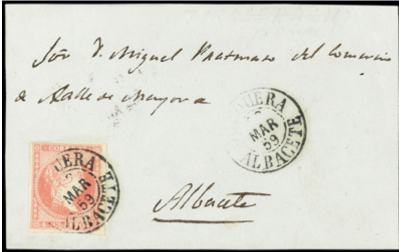
1078 60 €