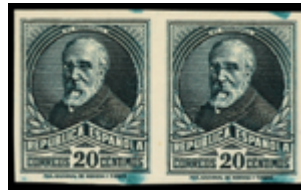
1434 80 €