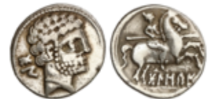
68 50 €