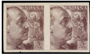
1588 110 €