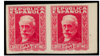
1435 150 €