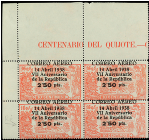
1474 120 €