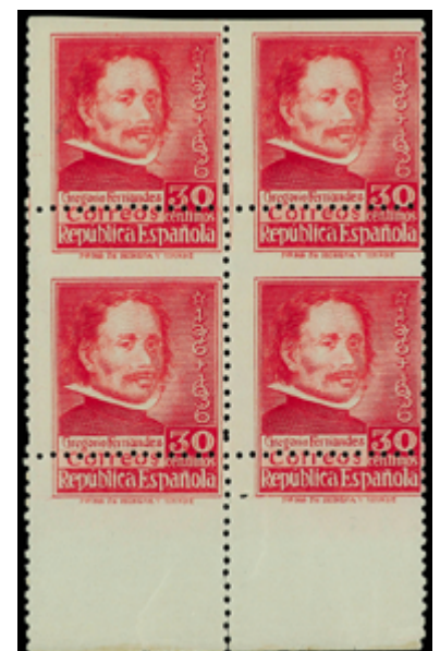
1457 60 €