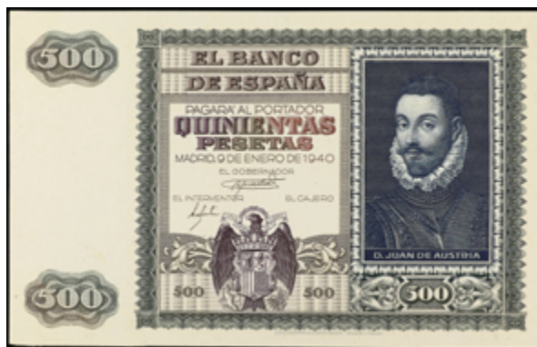
697 100 €