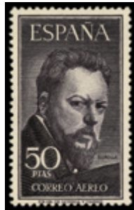
1651 100 €