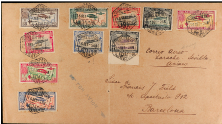
1363 60 €