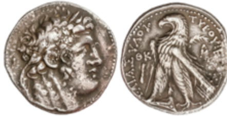
19 200 €