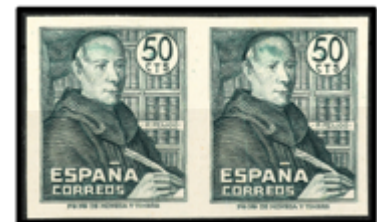
1613 60 €