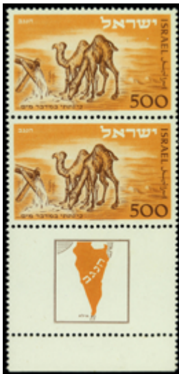
2300 50 €