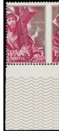
1673 50 €