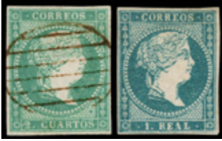
1067 70 €