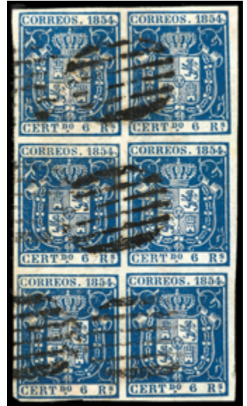
1051 950 €