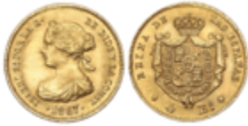
395 150 €