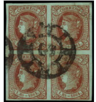
1176 50 €