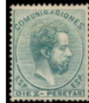
1231 350 €