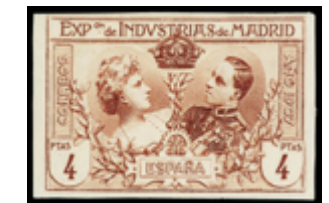
1313 115 €