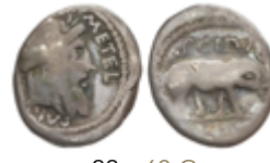
88 60 €