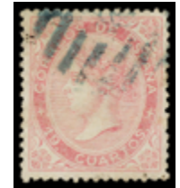
1201 130 €