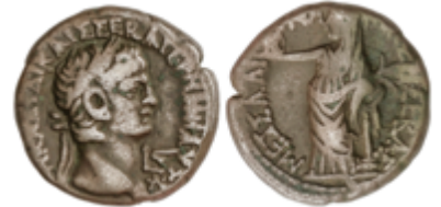
110 60 €