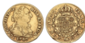
312 150 €