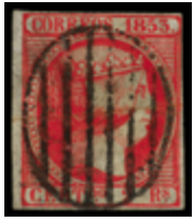
1043 500 €