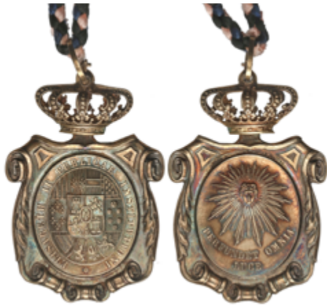
396 75 €