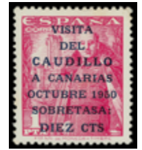
1640 75 €