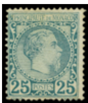
2343 120 €