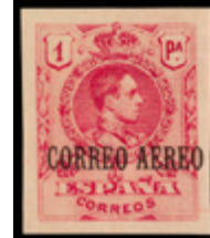
1330 100 €