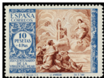
1584 75 €