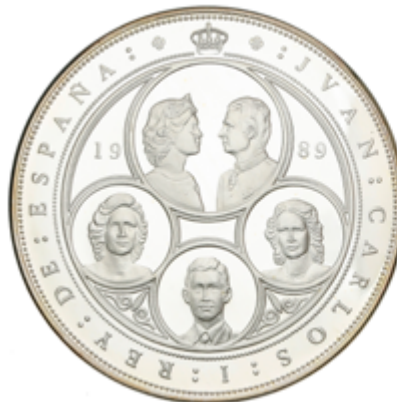
528 630 €