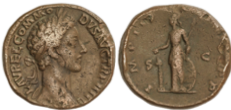
153 70 €