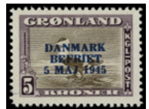
2206 150 €