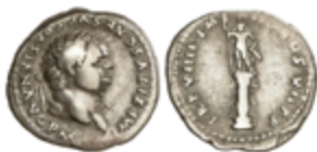
117 60 €