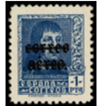
1563 160 €