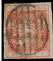
1050 80 €