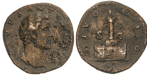
132 75 €