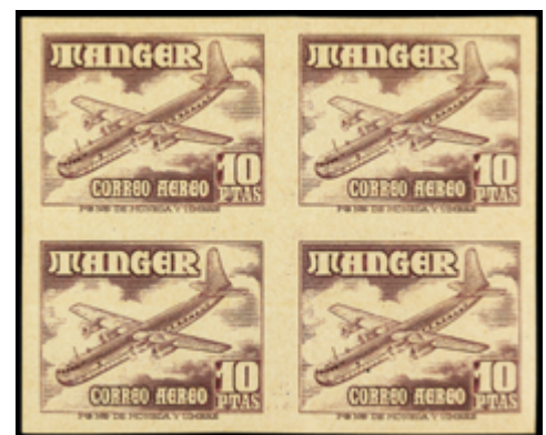
2096 60 €