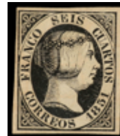
1024 75 €