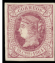
1161 50 €