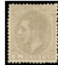
1260 350 €