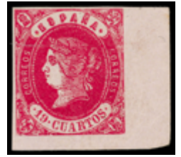
1157 110 €