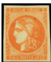
2220 95 €