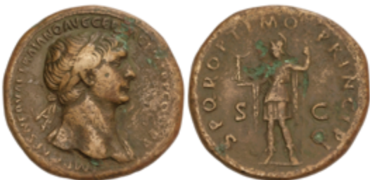
122 150 €