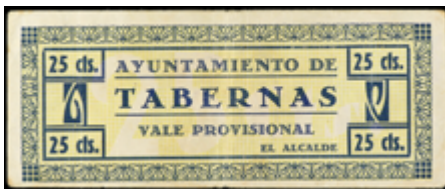
755 50 €