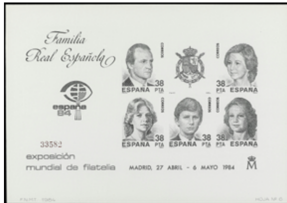
1729 50 €