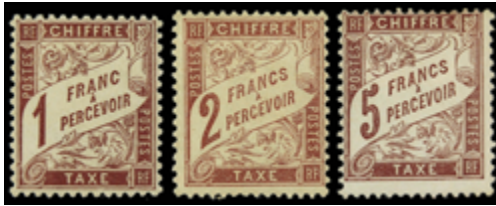
2231 160 €