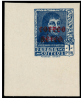
1557 110 €