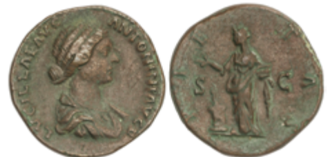
149 65 €