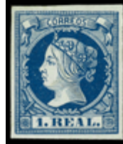
1135 250 €