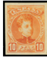
1298 60 €