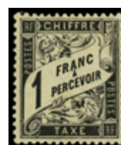
2230 75 €