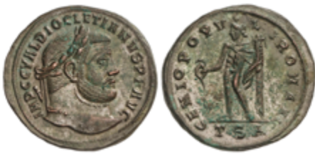
225 50 €