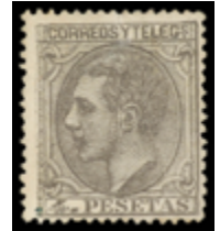
1258 120 €