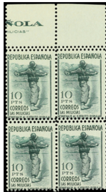
1516 60 €