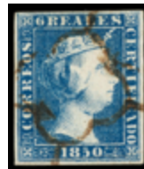
1021 225 €