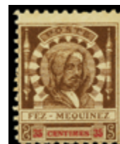
2232 160 €