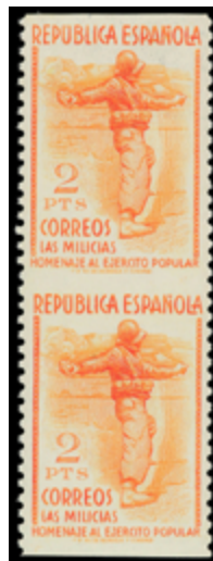
1513 90 €