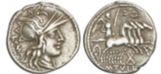
102 50 €