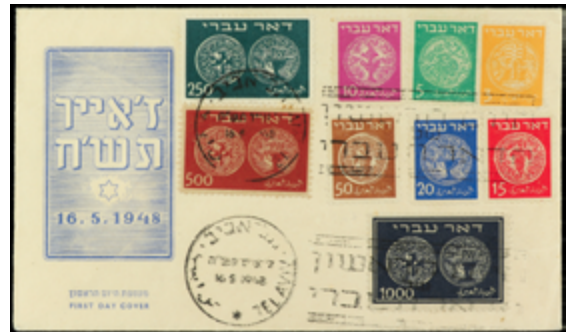
2299 50 €