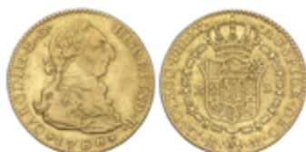
314 300 €