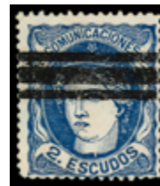
1211 80 €