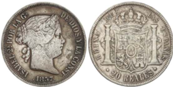
391 50 €