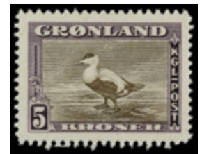
2205 50 €