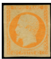
2215 190 €