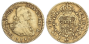
371 150 €