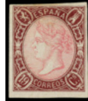
1177 225 €