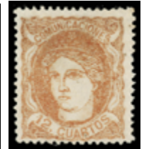
1220 100 €