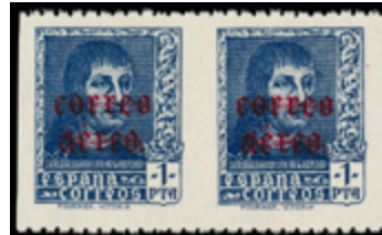
1566 150 €