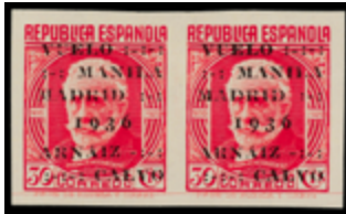
1468 60 €