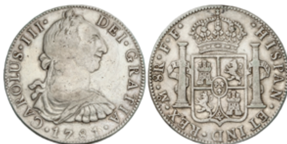
308 50 €