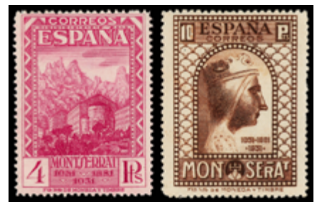
1422 400 €