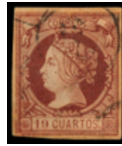
1106 260 €