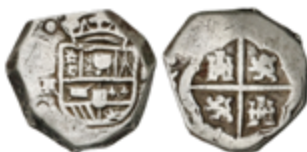
277 50 €