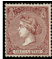
1191 140 €