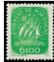
2381 50 €