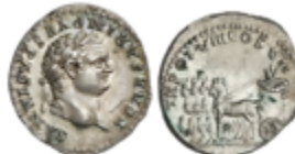
118 750 €