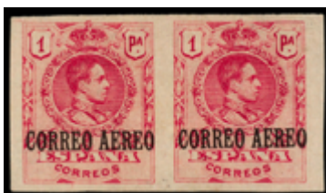
1331 290 €