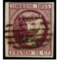
1041 70 €