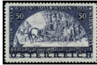
2158 100 €