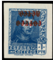
1561 100 €