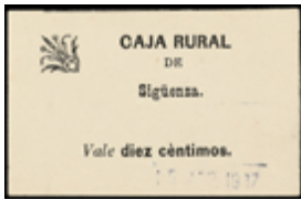
769 40 €