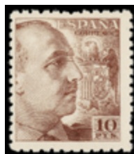
1586 50 €