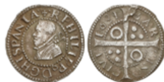
282 90 €