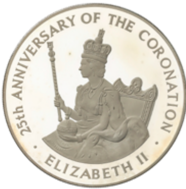
622 75 €