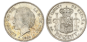
437 50 €