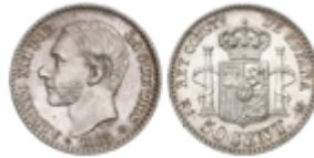
412 75 €