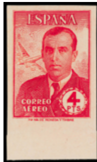
1606 300 €