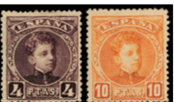
1294 260 €