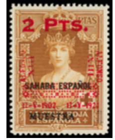
1377 450 €