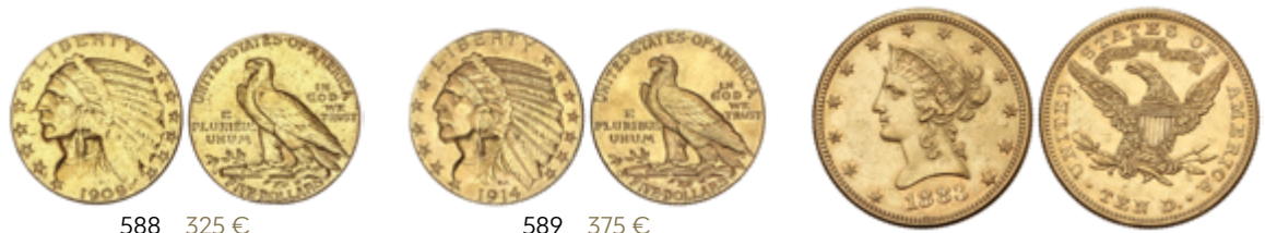
588 325 €