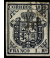
1056 95 €