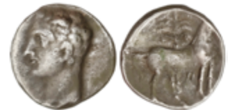
55 200 €