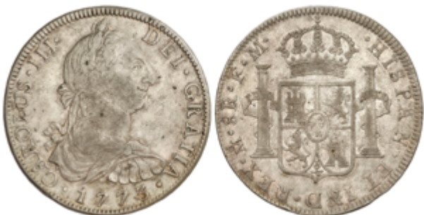
307 60 €