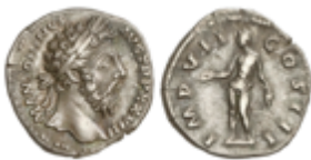
143 50 €