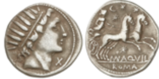
85 75 €