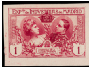
1312 50 €