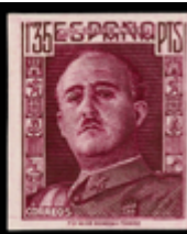
1614 75 €