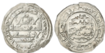
259 50 €