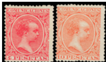
1277 320 €