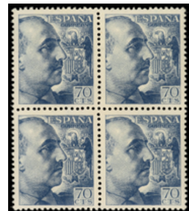
1622 55 €