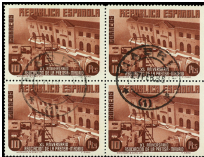
1454 50 €