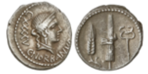
95 90 €