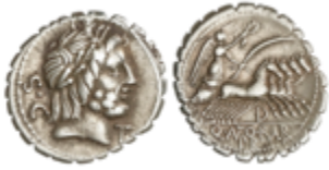
84 100 €