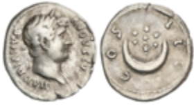
126 70 €