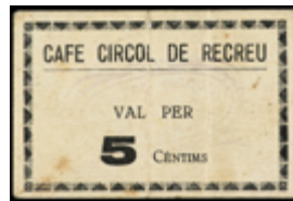
729 45 €