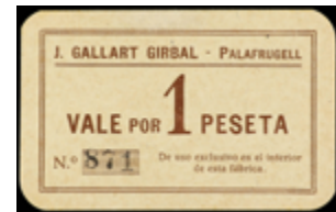
736 40 €