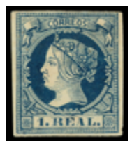
1137 100 €