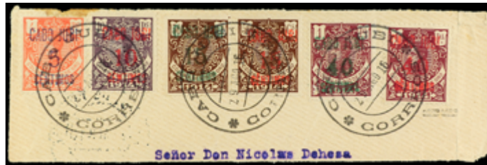
1987 50 €