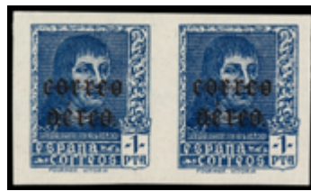
1565 450 €