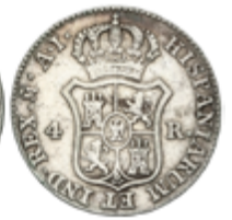
324 50 €