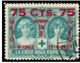
1371 50 €