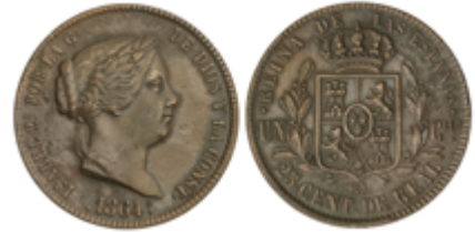
380 50 €