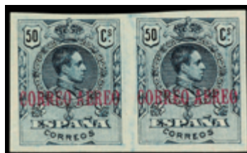
1335 50 €