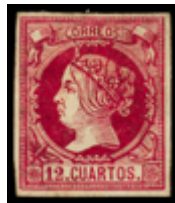
1127 160 €