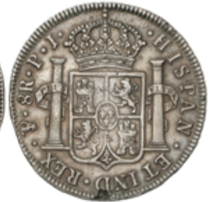
367 60 €