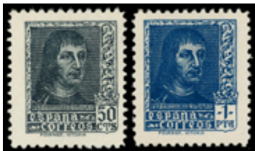
1555 65 €