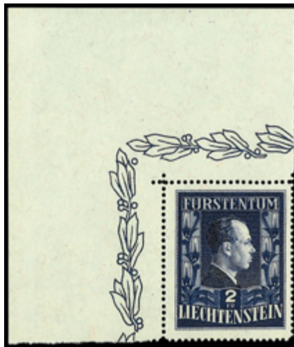
2325 140 €