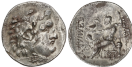
28 90 €