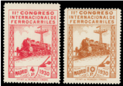
1387 130 €