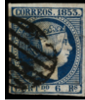
1039 90 €