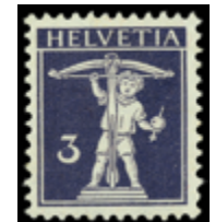
2417 50 €