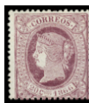
1200 70 €