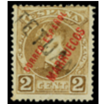
2049 60 €