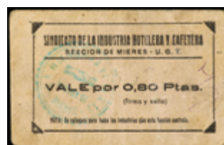
765 125 €