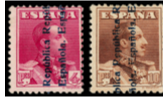
1416 450 €