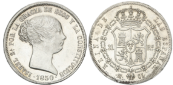
390 150 €