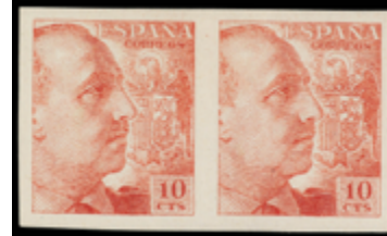
1589 80 €