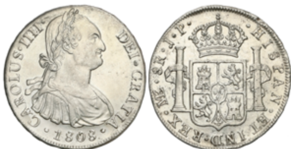
318 120 €