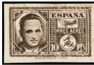
1607 90 €