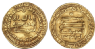
264 220 €