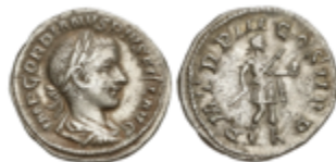
195 50 €