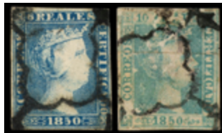
1018 250 €