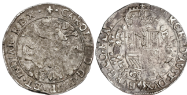
291 100 €