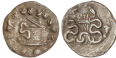
10 60 €