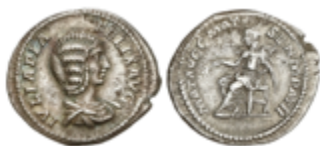
162 50 €