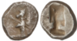
18 50 €