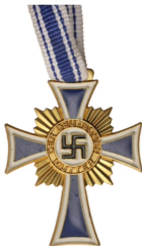
949 50 €