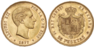
428 350 €