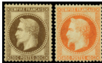
2217 385 €