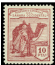
2084 50 €