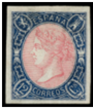
1180 180 €