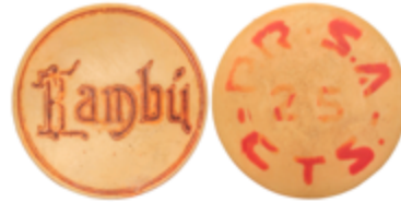
789 50 €