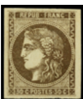
2219 65 €