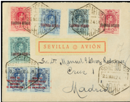
2054 50 €