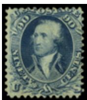
2209 160 €