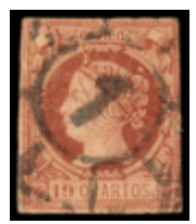
1107 100 €