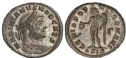
227 50 €