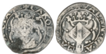
272 50 €