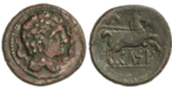
59 50 €