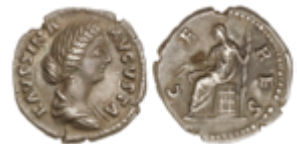
146 75 €