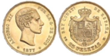
427 350 €