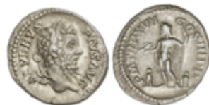
161 50 €