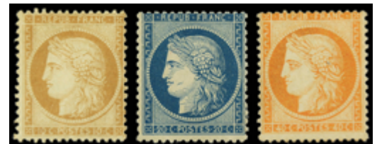
2218 130 €