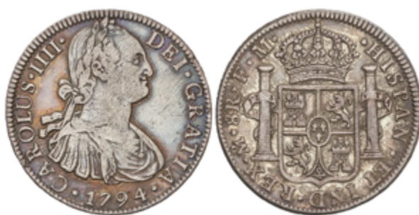
319 50 €