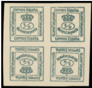
1249 60 €