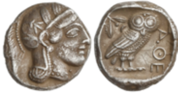
9 300 €