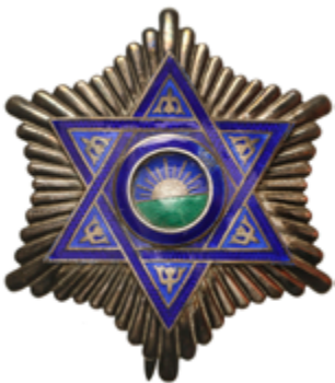
931 120 €