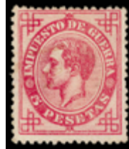
1256 120 €