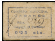
793 85 €