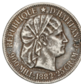
612 60 €