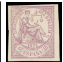
1236 50 €