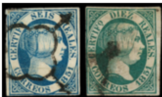
1023 150 €