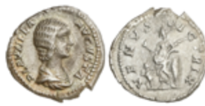
172 50 €