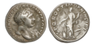
124 50 €