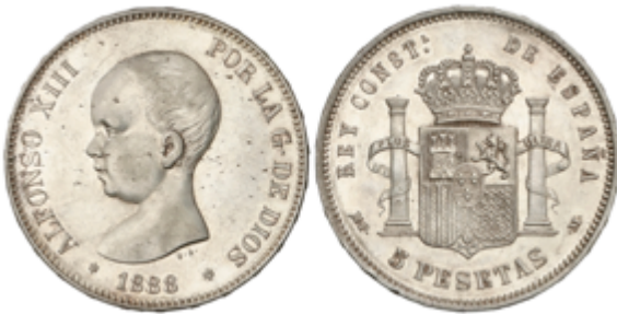
451 90 €