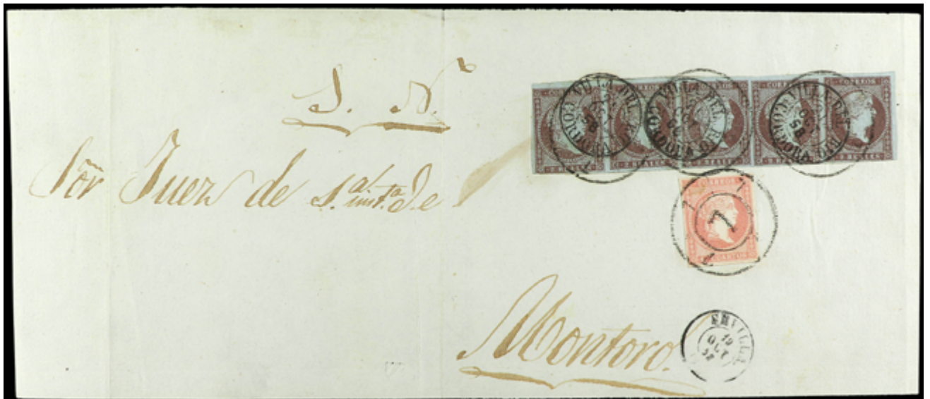
1062 800 €