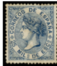
1208 120 €