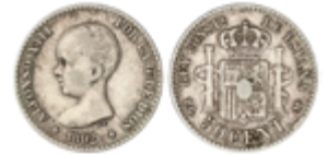
436 60 €