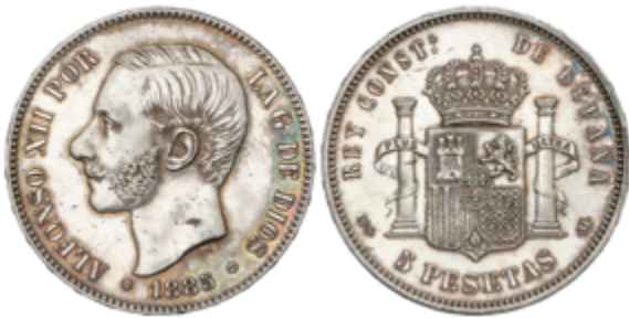
425 60 €