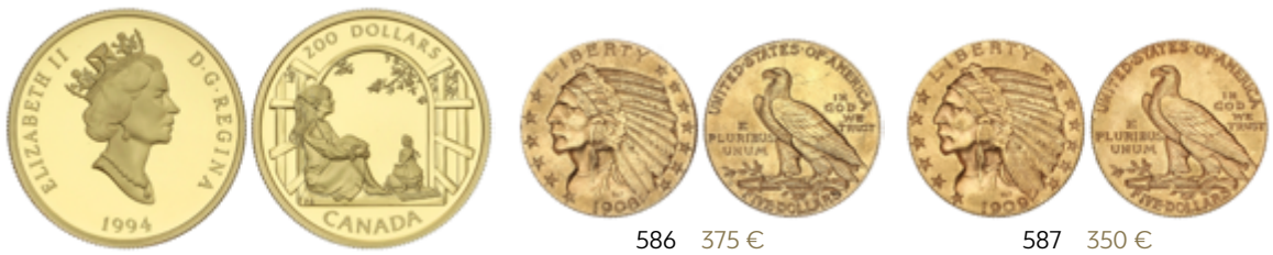
570 750 €