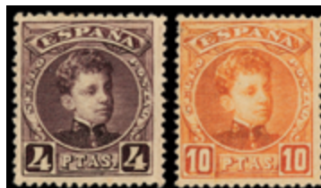
1295 200 €