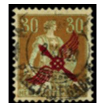
2427 100 €