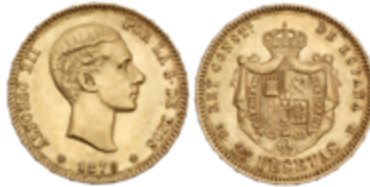
429 350 €