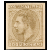
1263 60 €