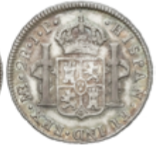
354 50 €