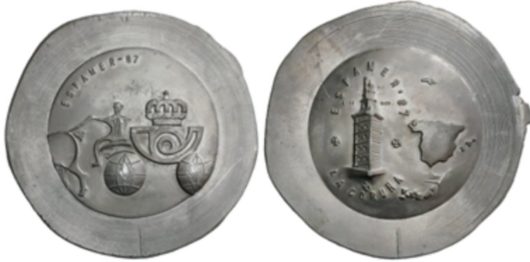
906 80 €