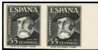
1618 150 €