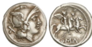
80 75 €