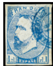
1241 50 €