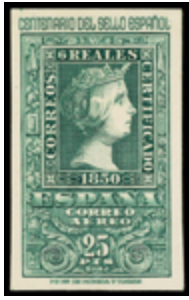
1632 120 €