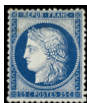
2221 200 €