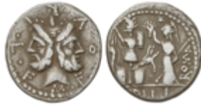
92 50 €