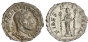
190 70 €