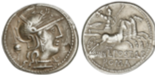
97 70 €