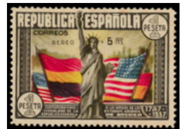
1485 60 €