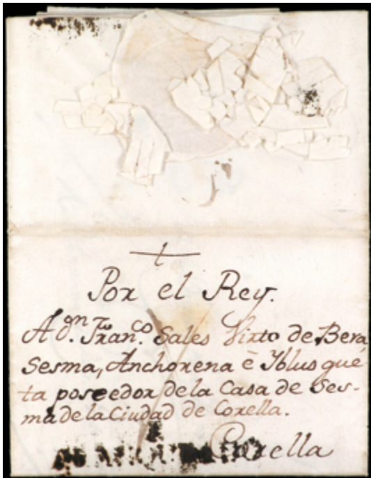
1013 200 €