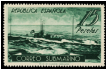
1497 130 €