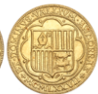
557 360 €