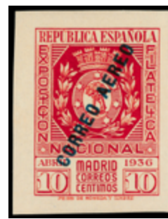
1465 75 €