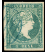
1069 80 €