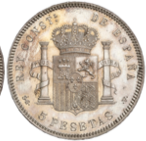
467 50 €