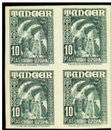
2095 60 €