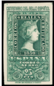
1633 80 €