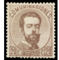
1228 95 €