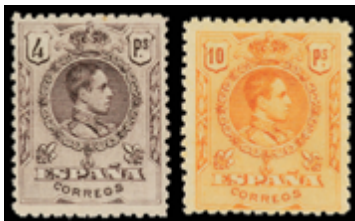
1315 100 €