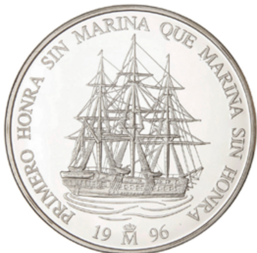
529 80 €