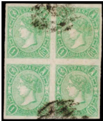
1186 50 €