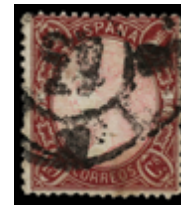
1188 250 €