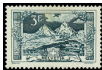
2419 70 €