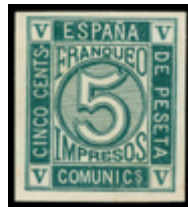
1226 50 €