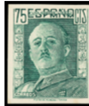
1609 150 €