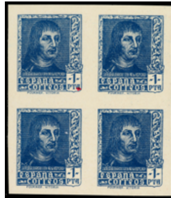
1556 400 €