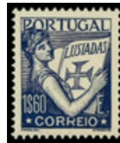
2376 65 €