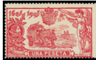
1306 125 €