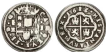
288 50 €