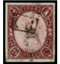
1178 190 €