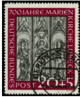
2125 60 €