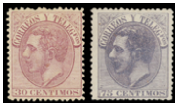
1267 50 €