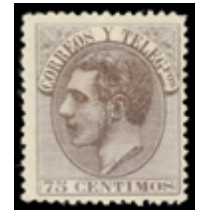
1274 95 €