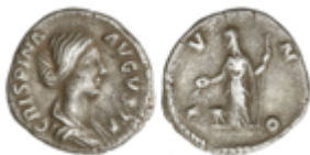
157 50 €