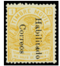
2032 50 €