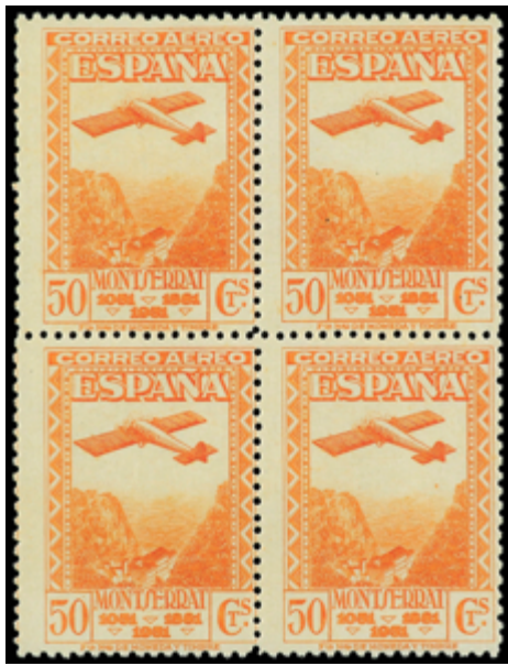
1426 70 €