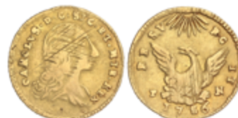
316 350 €