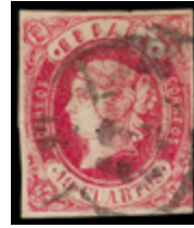
1144 50 €