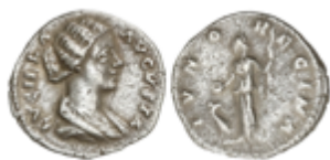
151 60 €