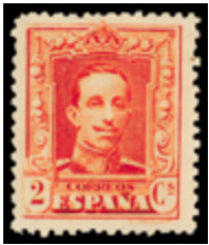
1340 180 €