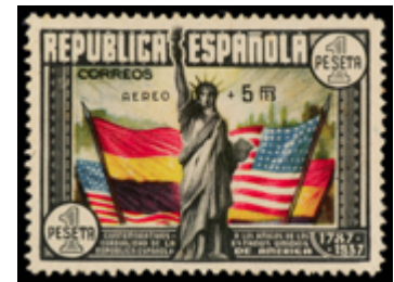
1484 120 €