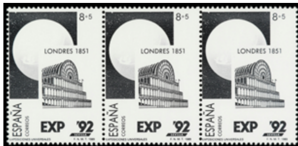
1691 75 €