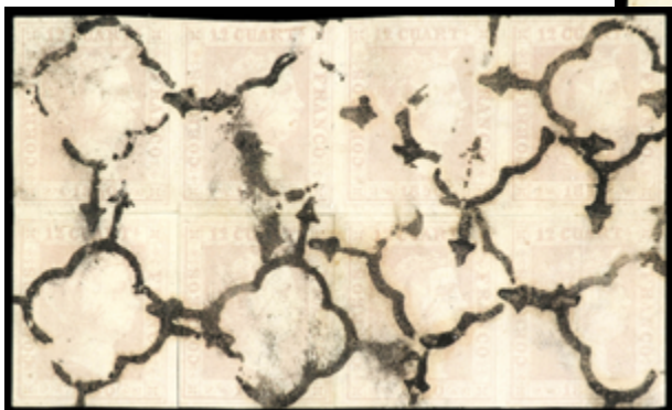
1020 850 €