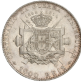
629 60 €