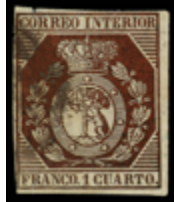
1045 50 €