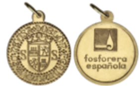
919 125 €