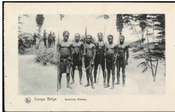
2176 50 €