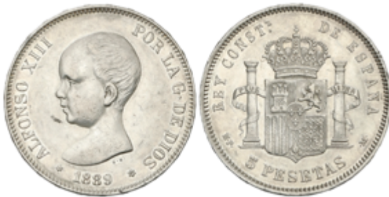
453 50 €