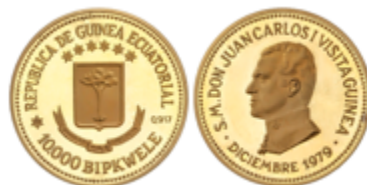
611 350 €