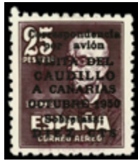
1643 100 €