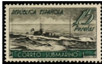
1503 120 €