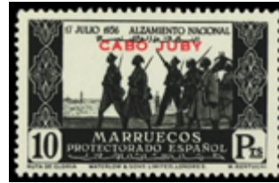
1993 75 €