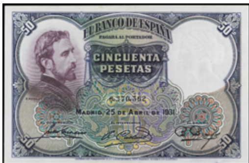
682 50 €