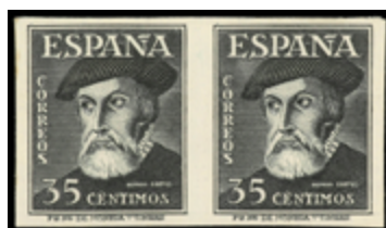
1619 60 €