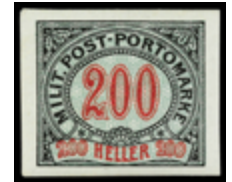
2178 50 €