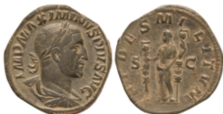
186 120 €