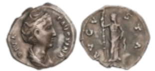
138 50 €