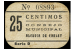
790 125 €