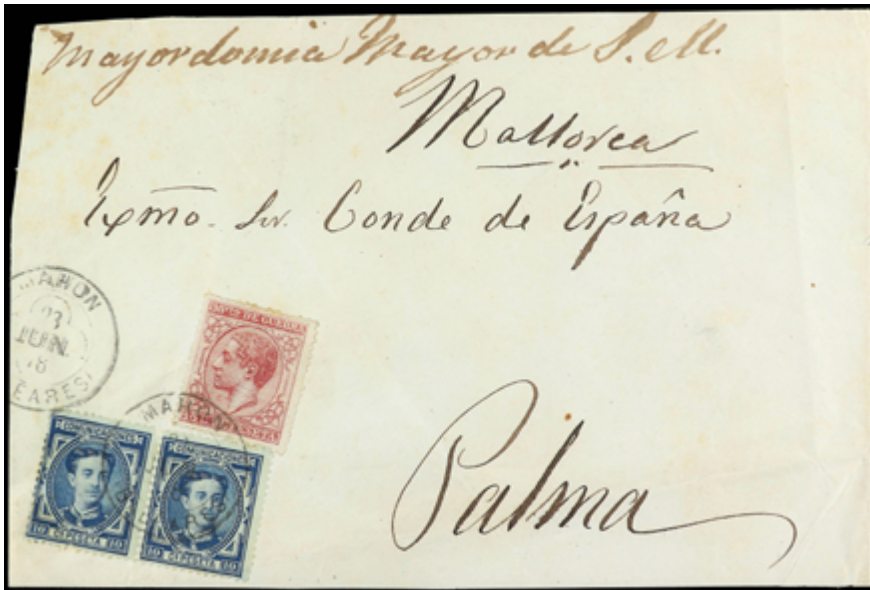
1254 50 €