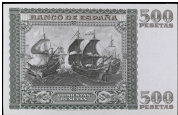
698 100 €