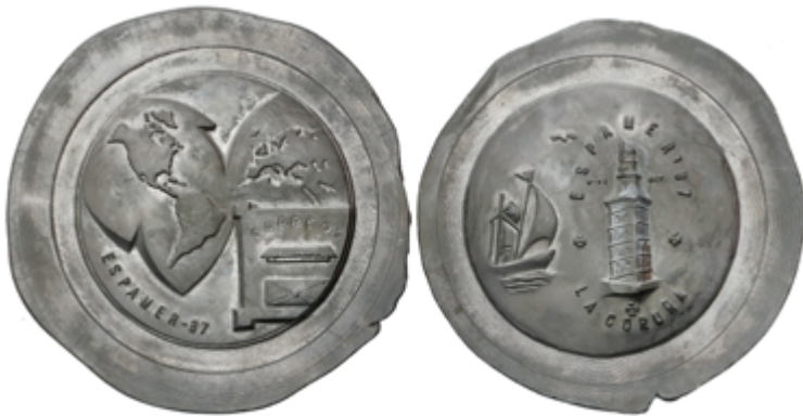
907 80 €