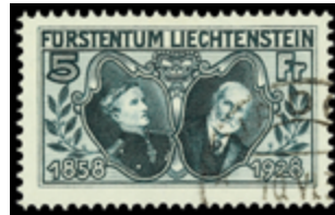
2322 70 €