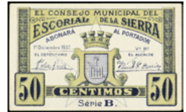
778 40 €