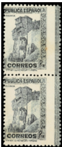
1440 50 €