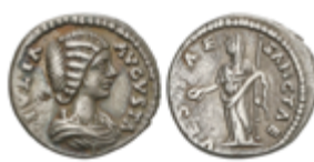
166 50 €