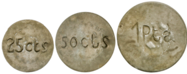
875 50 €