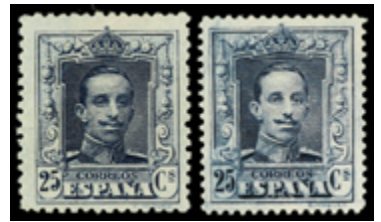
1353 70 €