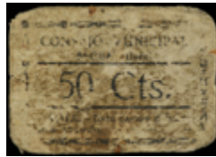
745 50 €