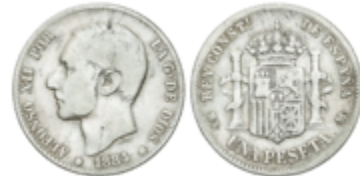
414 100 €