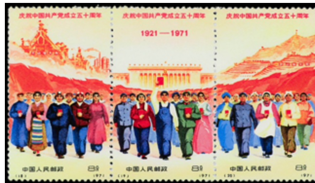
2191 70 €