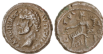
136 60 €