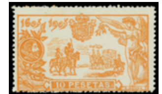
1311 50 €