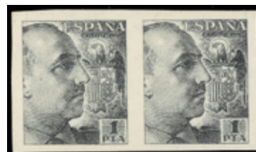
1627 400 €