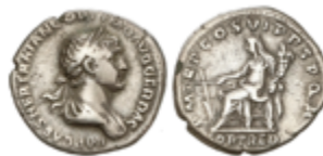
123 60 €