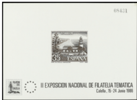
1732 150 €