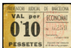
718 45 €