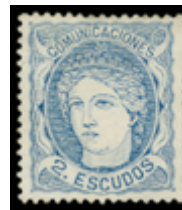
1219 500 €