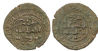
260 70 €