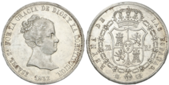
389 500 €