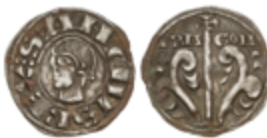
269 150 €