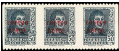
1567 90 €