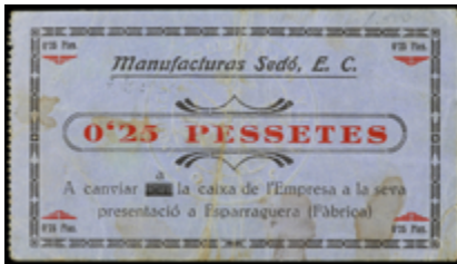
726 30 €