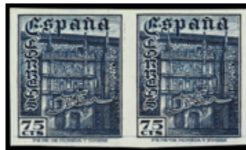
1611 300 €