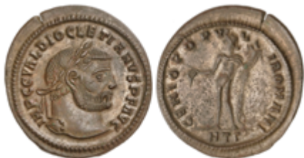
224 60 €