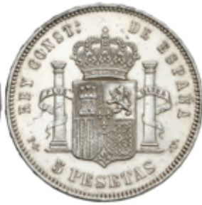
460 50 €