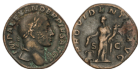
182 50 €