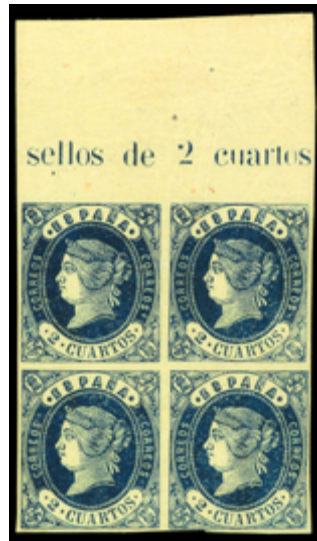
1145 90 €