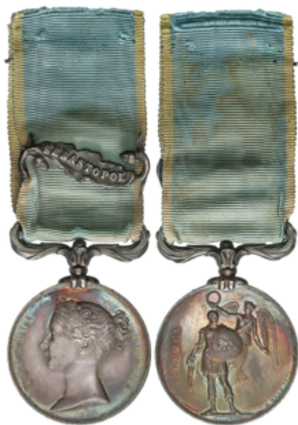
609 200 €