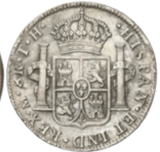
321 50 €