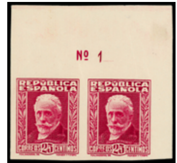
1432 250 €