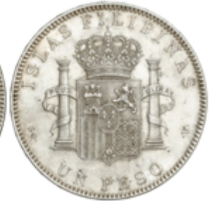
471 70 €