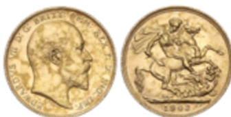
607 350 €