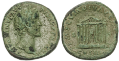
133 50 €