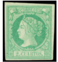
1109 110 €