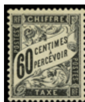
2229 160 €