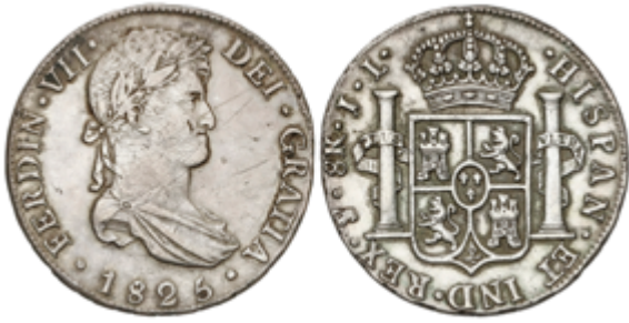
370 60 €