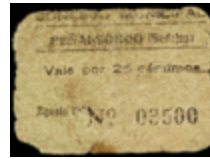
776 30 €