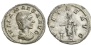
177 50 €