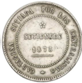
408 100 €