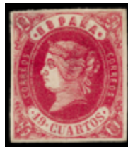
1143 50 €