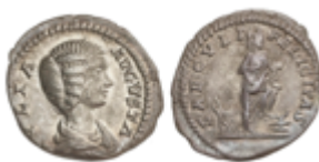
164 60 €