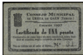
759 90 €