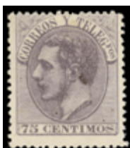
1275 50 €