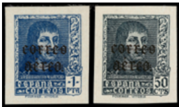
1564 100 €