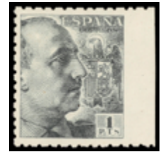
1594 250 €