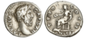
130 150 €