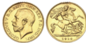
606 150 €