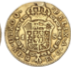
323 100 €