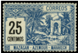
2252 100 €