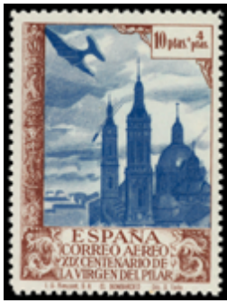
1585 80 €