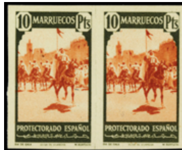
2064 190 €