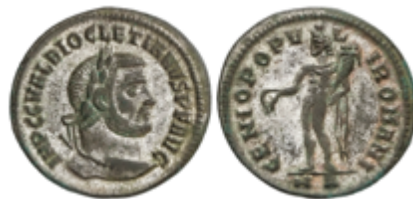
226 50 €