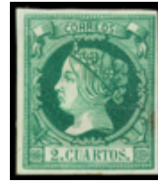
1108 200 €