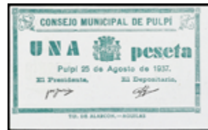
753 30 €