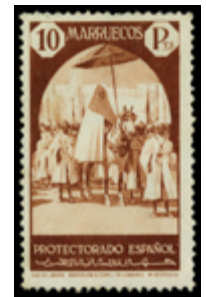
2062 50 €