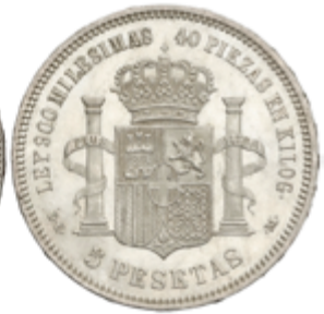
410 100 €