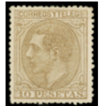
1261 390 €