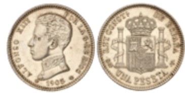
447 400 €