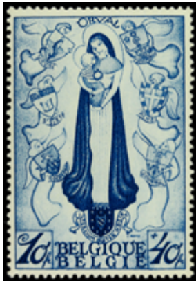
2170 260 €