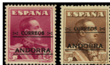
1976 100 €