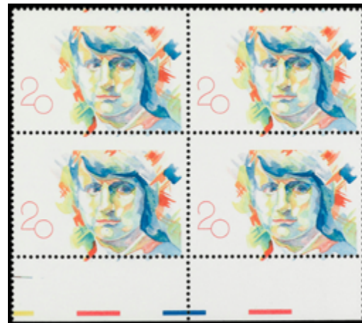
1685 80 €