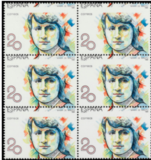
1683 100 €