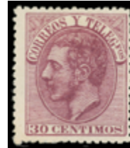
1271 110 €