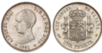
441 170 €