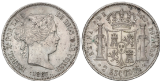
393 90 €