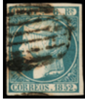
1032 80 €