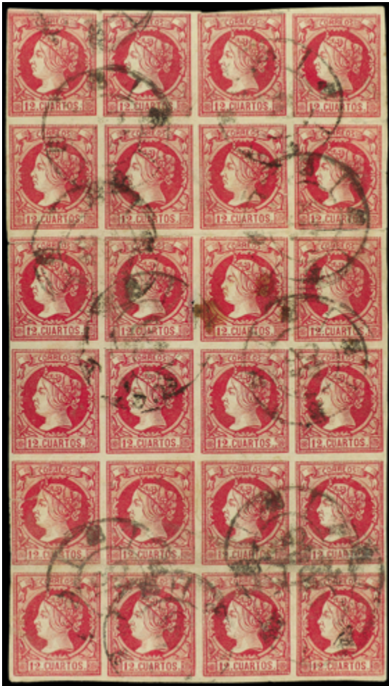
1128 500 €