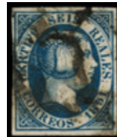
1029 250 €