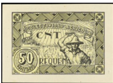
796 30 €