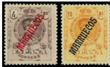
2051 60 €