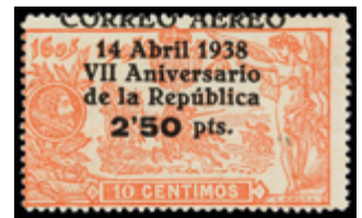
1723 40 €