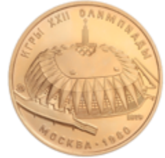
871 775 €