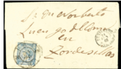
1247 40 €