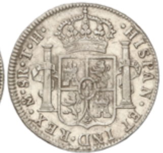
354 60 €