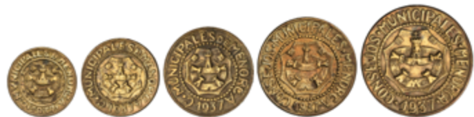
704 120 €