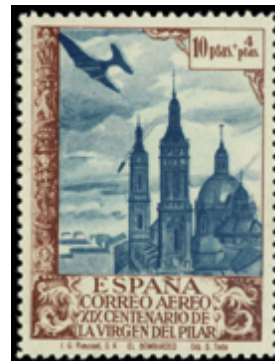
1859 120 €