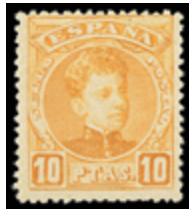
1412 40 €