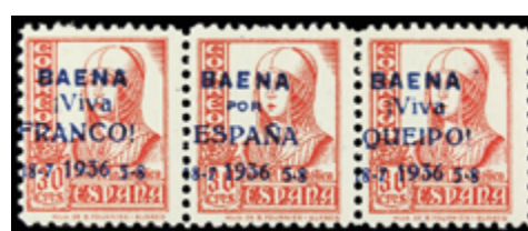
2329 15 €