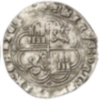
118 120 €