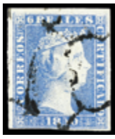
1037 75 €