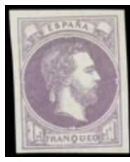
1304 80 €