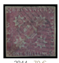
2944 70 €