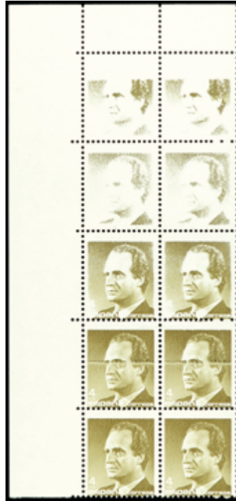
2054 200 €