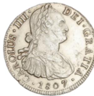
270 90 €