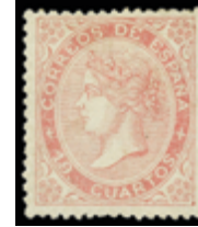
1253 100 €