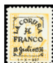
2345 20 €