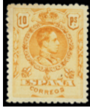
1442 60 €