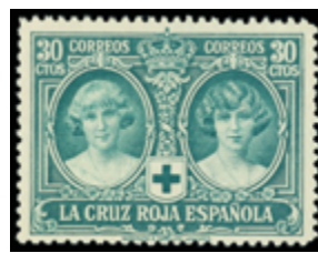
1508 25 €