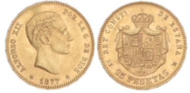
543 700 €