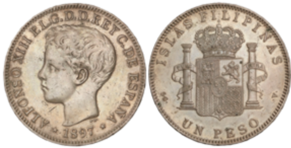
682 75 €