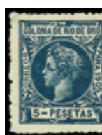
2680 200 €