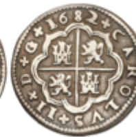
166 75 €