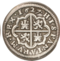
147 90 €