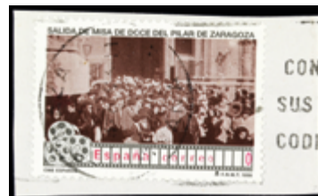
2078 40 €