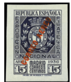
1688 120 €