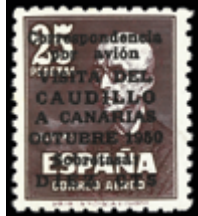
1959 75 €