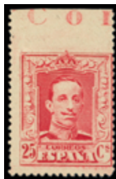
1481 120 €