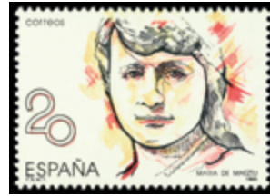
2065 25 €