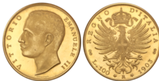
833 875 €