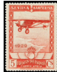
1547 20 €