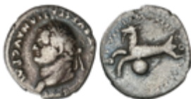
76 120 €