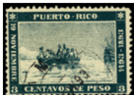
2675 25 €