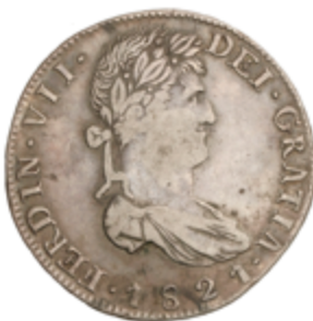
380 70 €