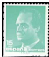
2075 25 €