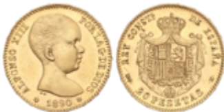
690 275 €