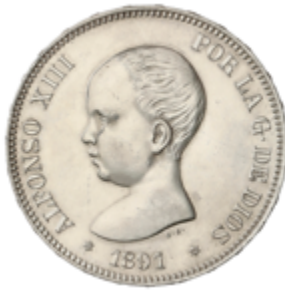
652 60 €