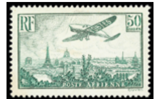
2877 75 €