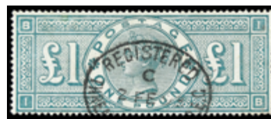
2910 50 €