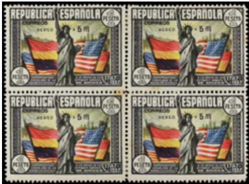
1744 180 €