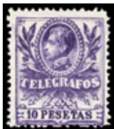
2277 40 €