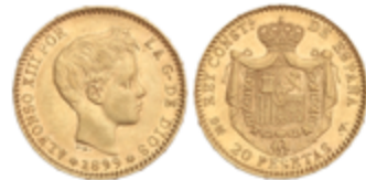
692 300 €