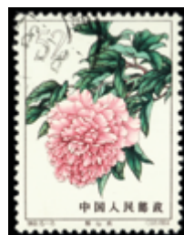
2801 20 €