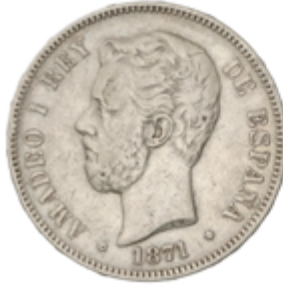
469 200 €