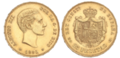
569 350 €