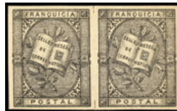
2274 15 €