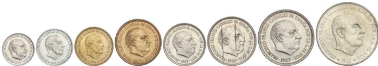
710 150 €