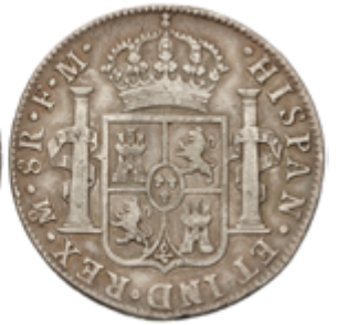
221 60 €