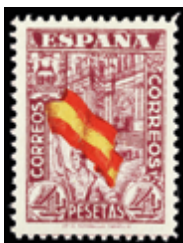
1782 60 €