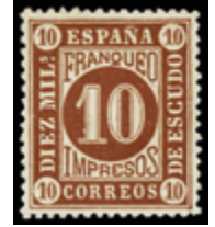
1256 25 €