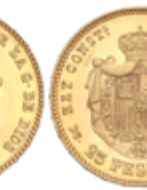
525 350 €