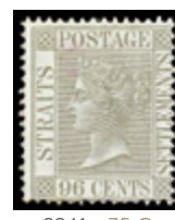
2941 35 €