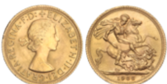
804 350 €