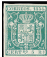
1122 75 €