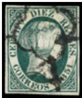
1066 100 €