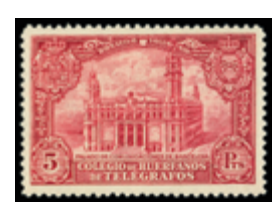
2214 60 €