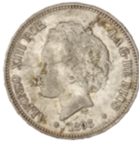
666 70 €