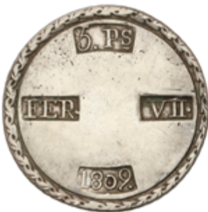
376 150 €