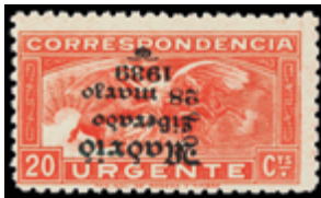
2348 30 €