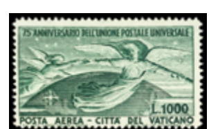
3119 30 €