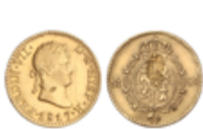
385 100 €