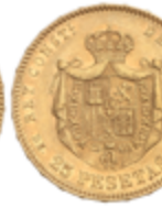
526 350 €