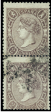
1246 45 €