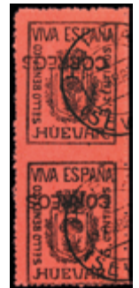
2309 20 €