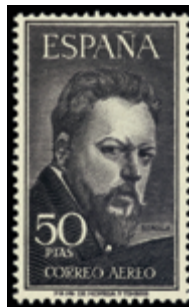
1987 75 €