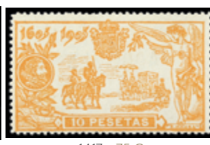
1417 75 €