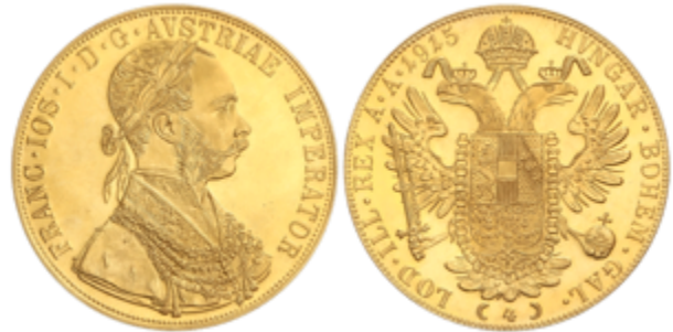
747 650 €