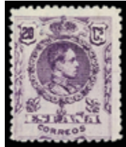
1450 30 €