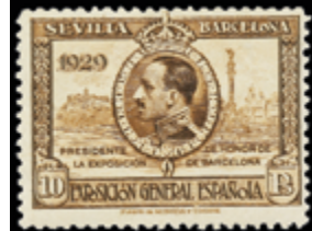
1540 40 €