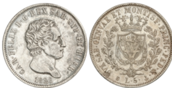
820 120 €