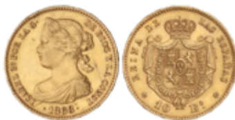
442 350 €