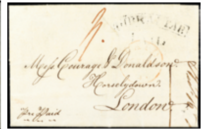
2933 30 €