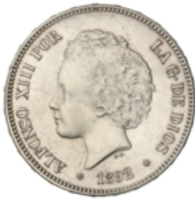
659 90 €