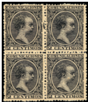
1367 20 €