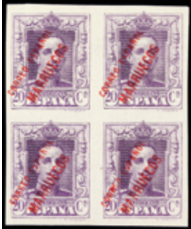
2696 30 €