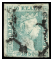
1039 225 €