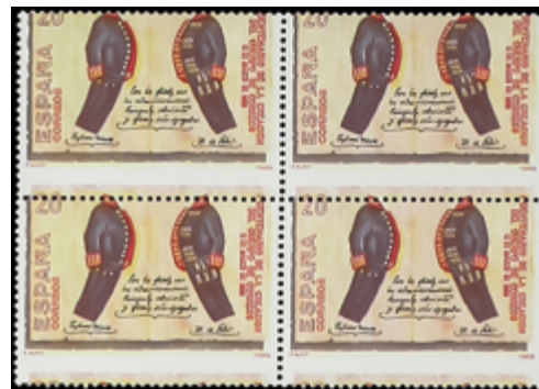
2073 40 €