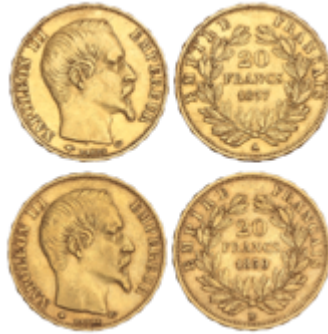
791 600 €