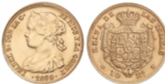
443 250 €