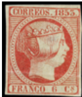
1092 40 €