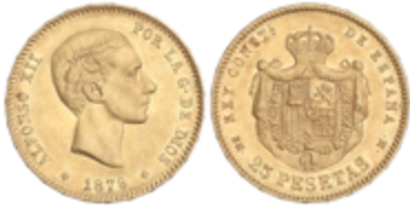
561 350 €