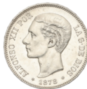
506 120 €