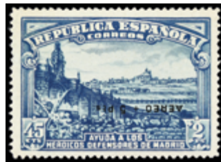
1730 140 €