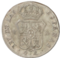
336 60 €