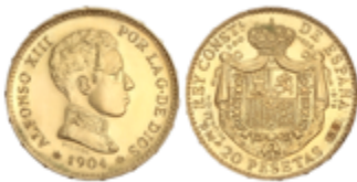
693 300 €