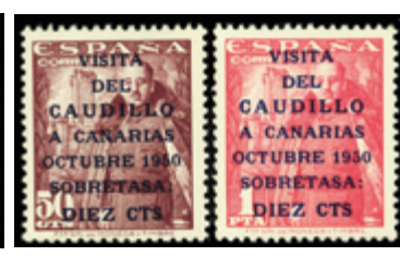
1951 40 €