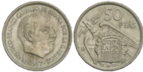
714 80 €