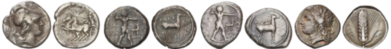
7 400 €