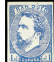
1296 40 €