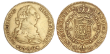
230 300 €