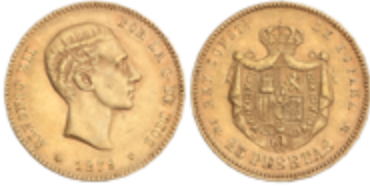
564 350 €