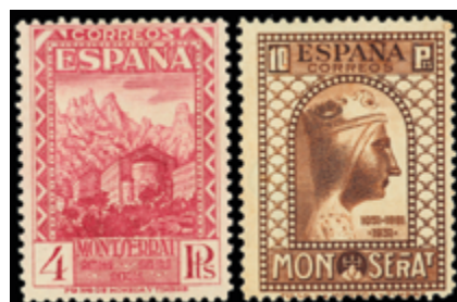
1625 180 €