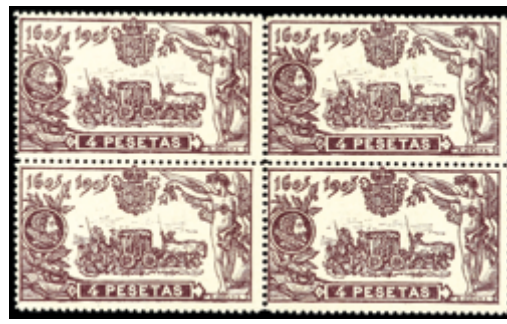
1437 150 €