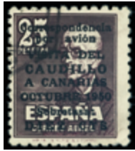
1964 80 €