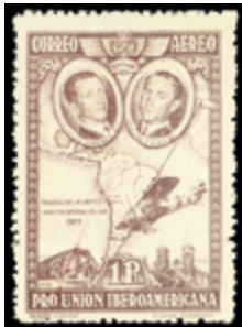
1603 60 €