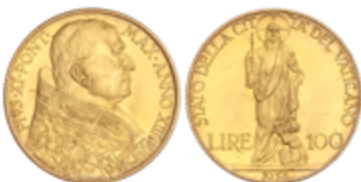
925 400 €