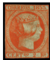
1102 350 €