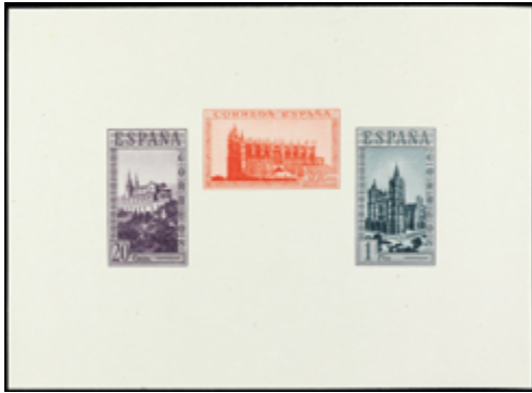
1828 50 €