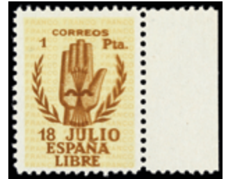
1837 40 €