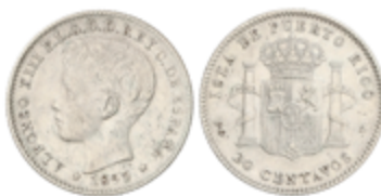
631 75 €