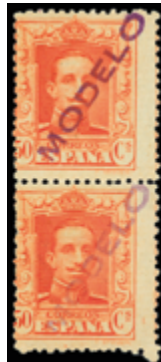
1485 40 €