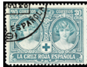
1510 40 €