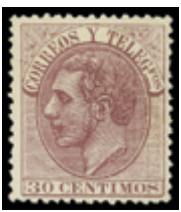
1359 60 €