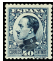
1568 30 €