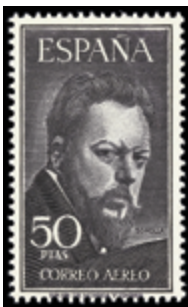
1985 75 €