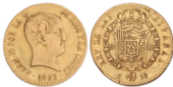
386 300 €