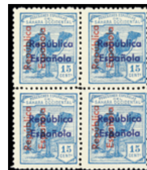
2690 70 €