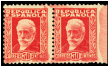
1644 20 €