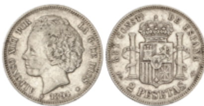
635 70 €