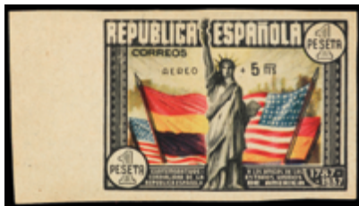
1747 70 €