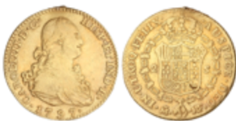
283 575 €