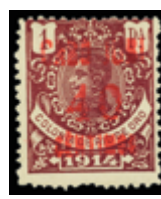
2547 120 €