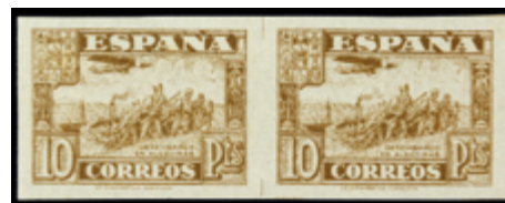
1789 45 €