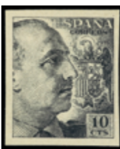
1867 80 € .jpg