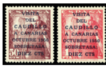
1950 40 €