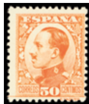
1567 35 €