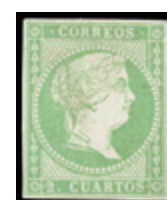
1166 50 €