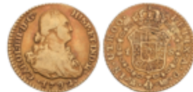
279 250 €