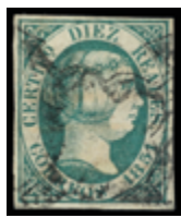
1067 65 €