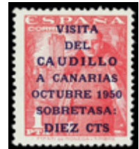
1948 30 €