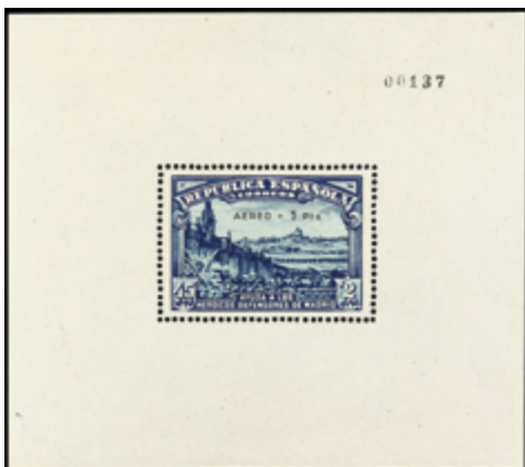
1732 300 €