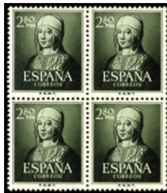
1967 45 €