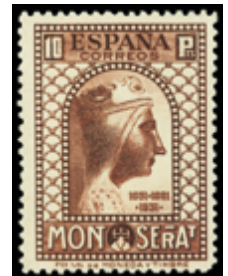
1623 220 €