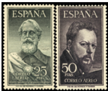
1988 80 €