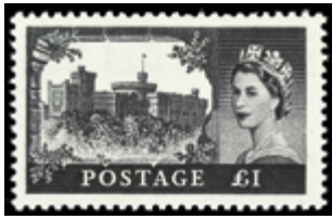
2917 40 €