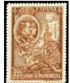
1592 30 €