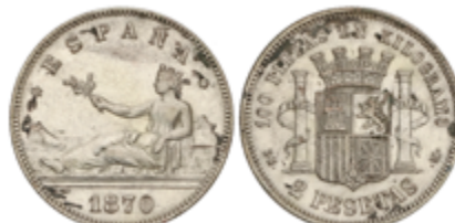
454 45 €