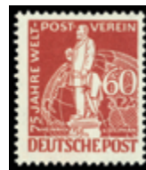
2738 90 €