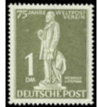
2737 60 €