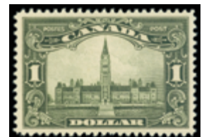
2791 80 €