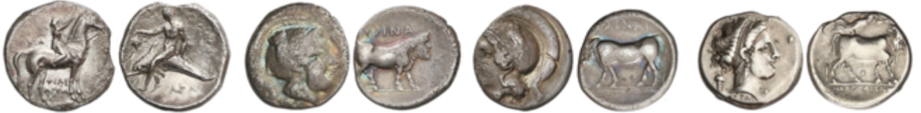
6 240 €