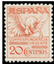
1609 30 €