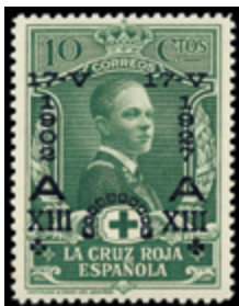
1518 40 €