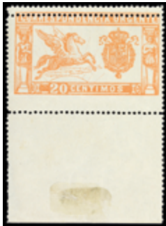
1505 50 €