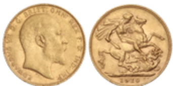
801 350 €