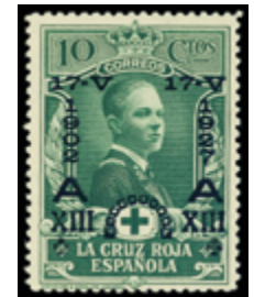
1517 45 €