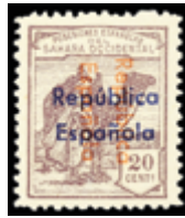
2691 60 €