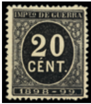
1382 100 €