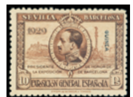
2604 25 €