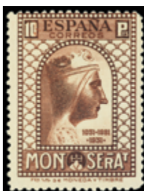
1624 225 €