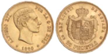
567 350 €