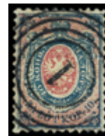
3043 90 €