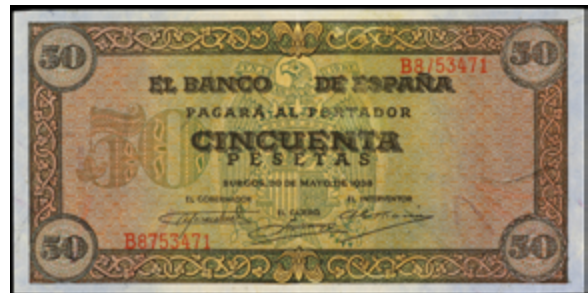
966 75 €