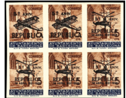
2140 130 €