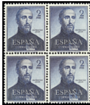
1977 50 €