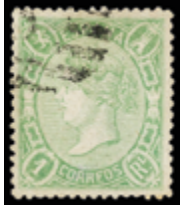
1244 125 €