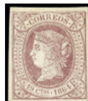
1232 25 €