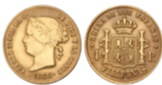
436 290 €