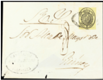
2556 30 €