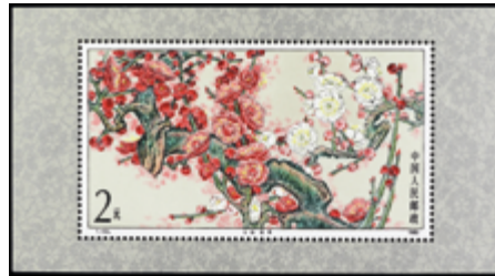
2817 10 €