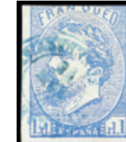
1299 40 €