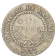
425 150 €