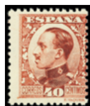
1572 55 €