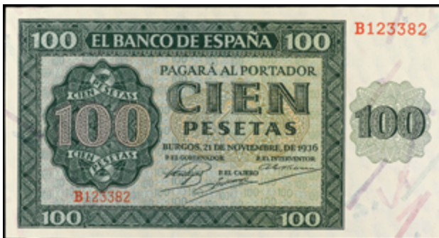
968 175 €