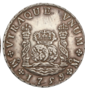
195 180 €