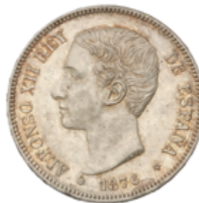
502 60 €