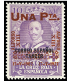
1536 60 €