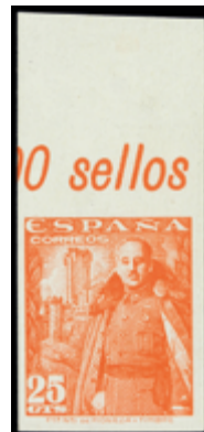
1916 25 €