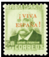
2357 40 €