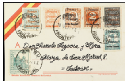
2343 25 €