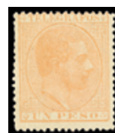
2597 30 €