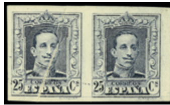
1503 60 €