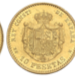
524 150 €