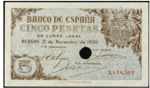
954 150 €