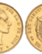
531 350 €