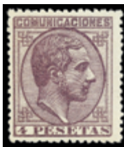
1346 70 €