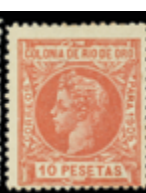
2681 35 €