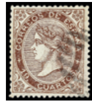
1259 80 €