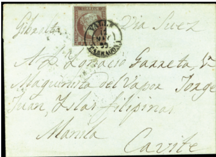
1155 800 €