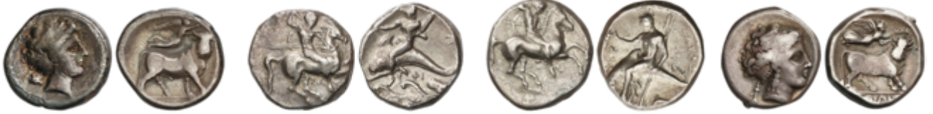
3 120 €