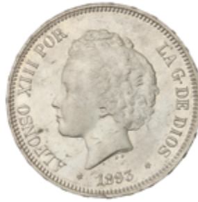
663 150 €