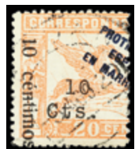
2645 60 €