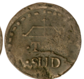
370 75 €