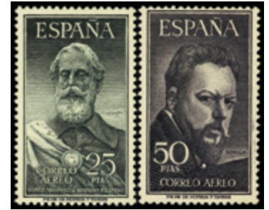
1982 170 €