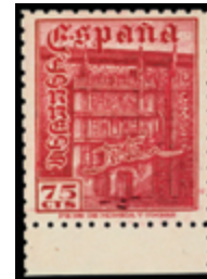
1906 150 €