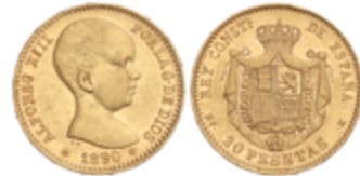
689 300 €