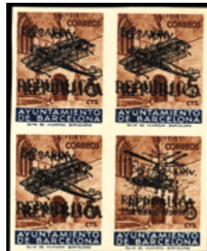
2142 700 €