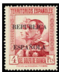
2609 30 €