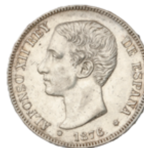
503 60 €