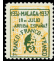
2353 30 €