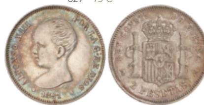
633 145 €