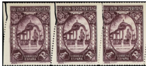
1596 50 €