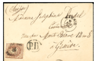
1273 25 €