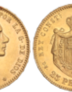
530 350 €