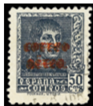
1824 40 €