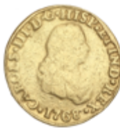
230A 300 €