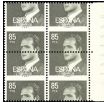
2041 60 €