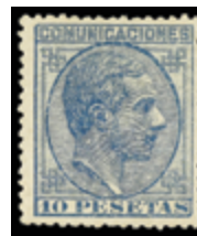
1347 30 €