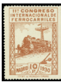
1555 130 €