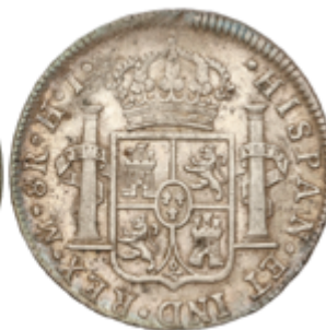
355 65 €