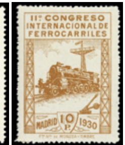
1559 75 €