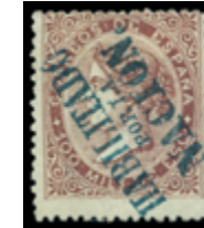
1262 65 €