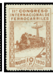
1556 135 €