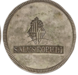
348 150 €