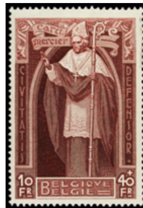
2779 60 €