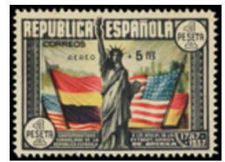
1741 65 €