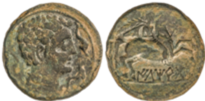
37 60 €