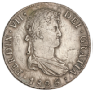
375 60 €