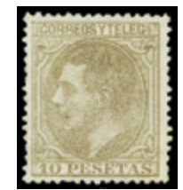
1355 150 €