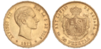
563 350 €