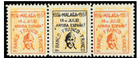
2354 20 €