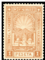
2894 35 €