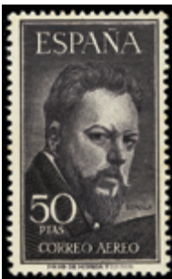
1986 60 €