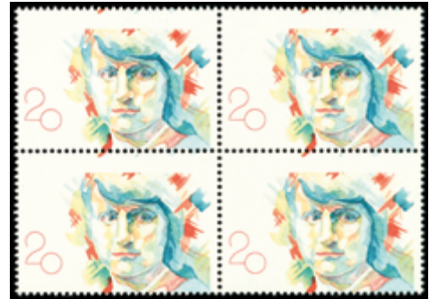
2066 75 €