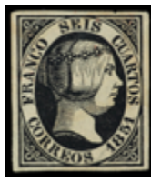
1041 40 €