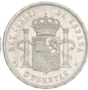
510 120 €