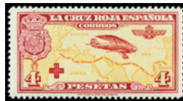
1514 30 €