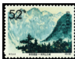
2802 70 €