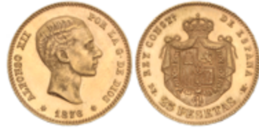
716 400 €