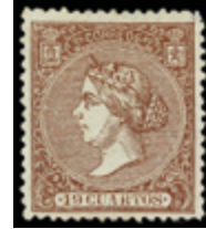
1249 75 €