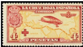
1513 50 €