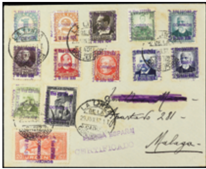
2346 25 €