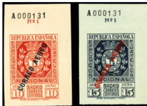
1687 190 €