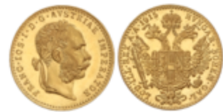
746 150 €