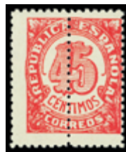
1713 80 €