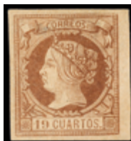
1197 200 €