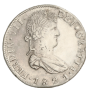
379 80 €