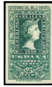
1938 150 €