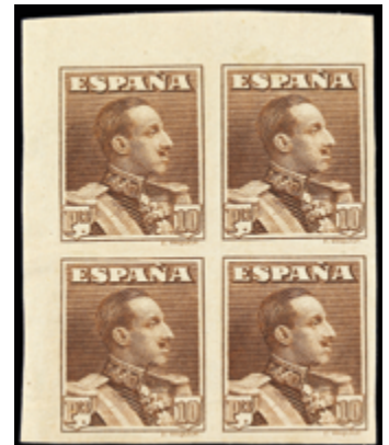
1498 40 €