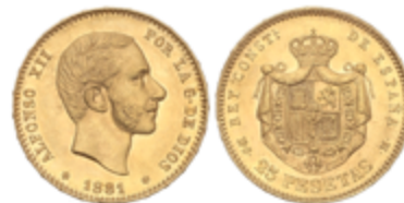
584 350 €