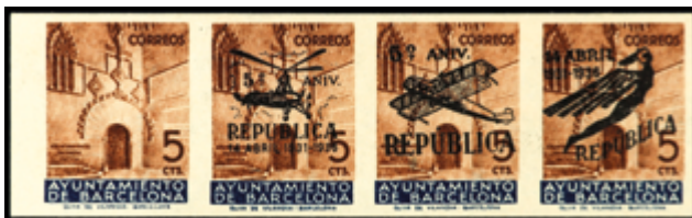
2132 300 €