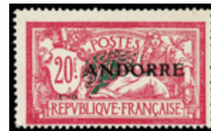
2887 60 €