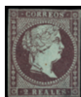
1149 120 €