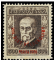
2792 20 €