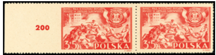
3044 100 €