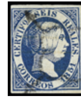
1065 70 €