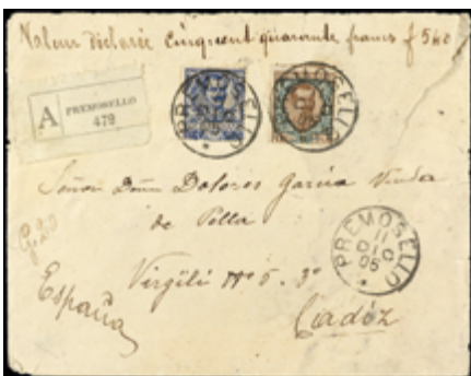
2983 30 €