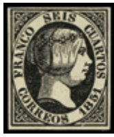
1040 175 €