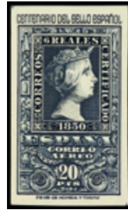
1937 120 €