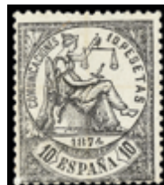
1290 100 €