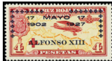
1521 30 €