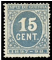
1383 70 €