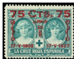
1526 90 €