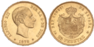
544 350 €