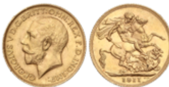
802 350 €