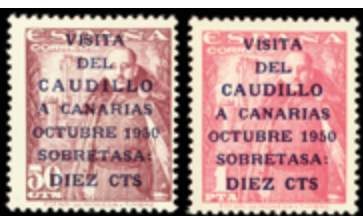
1952 40 €