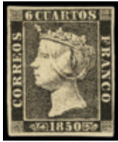
1021 300 €