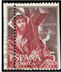
2020 25 €