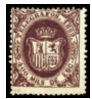
2276 30 €