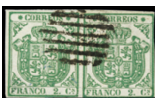
1129 65 €