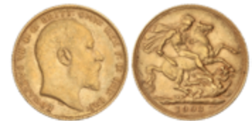
800 325 €