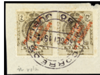
2548 30 €