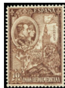
1591 30 €