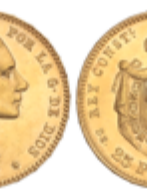
528 350 €