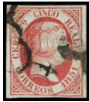
1059 40 €