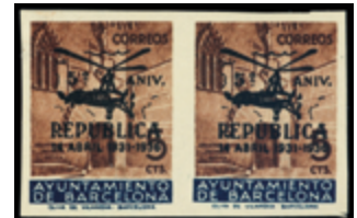
2143 25 €