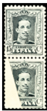
1477 60 €