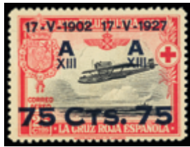
1532 25 €