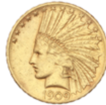
774 725 €