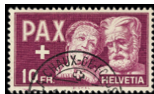
3102 25 €