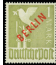
2736 40 €