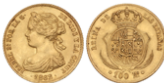
438 360 €