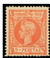
2578 60 €