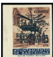
2144 120 €