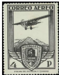
1564 15 €