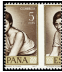
2028 30 €