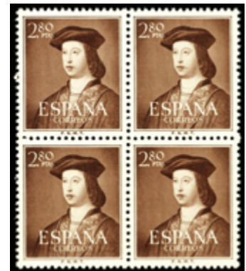
1974 40 €