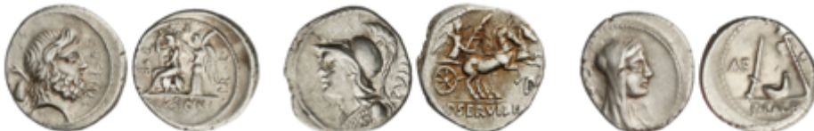
66 200 €