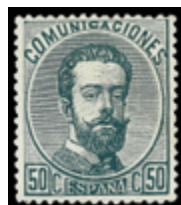
1283 25 €