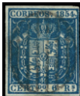
1116 100 €