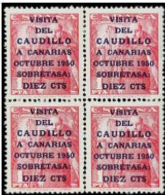
1946 300 €