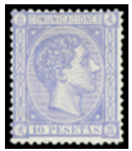
1328 130 €