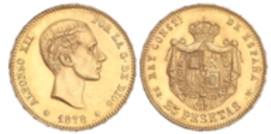
546 350 €