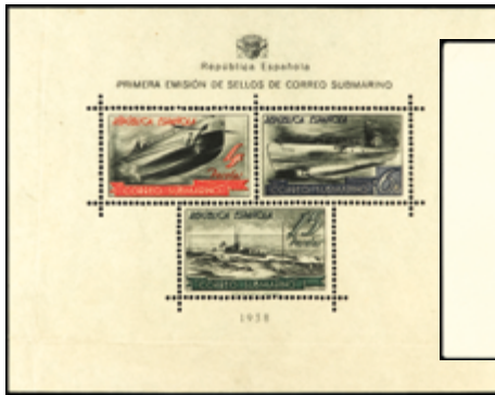
1761 90 €