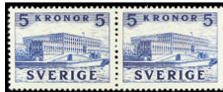
3096 40 €