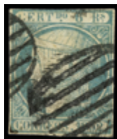
1088 40 €