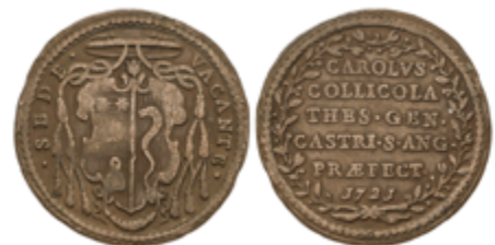
927 60 €