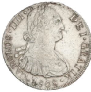
248 60 €