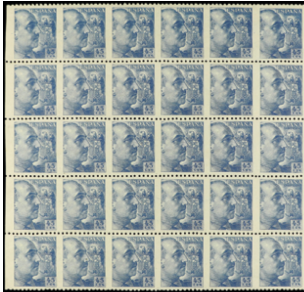
1873 120 €