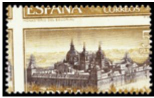
2016 30 €