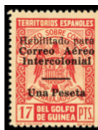
2617 24 €