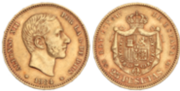
599 325 €