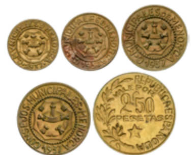
705 120 €