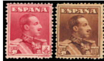
1470 50 €