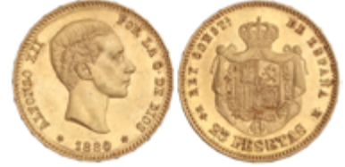
566 350 €