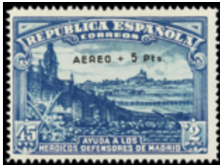
1729 50 €