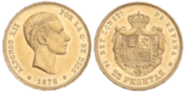
547 400 €