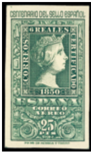
1940 80 €