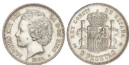
634 300 €