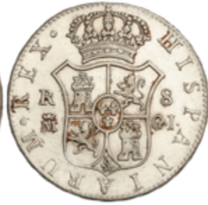
345 90 €