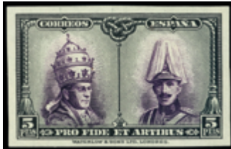
1539 100 €