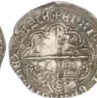
119 120 €