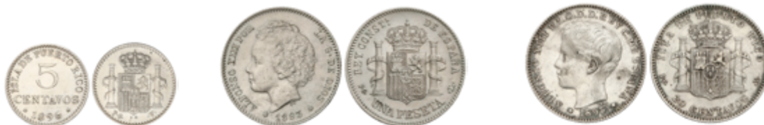
603 60 €