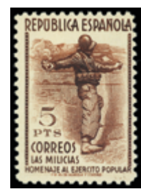
1768 100 €