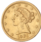
771 350 €