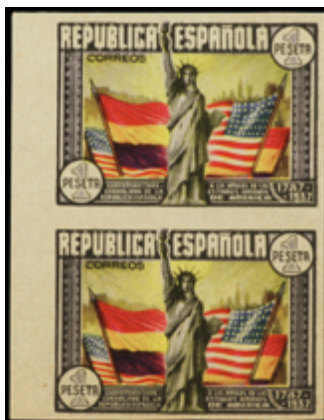
1735 40 €