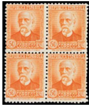
1642 200 €