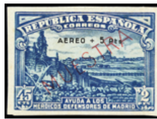
1731 50 €