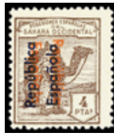
2692 30 €