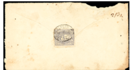
1272 90 €