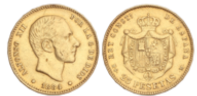
601 300 €