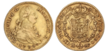
281 300 €