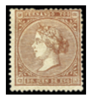
2571 60 €