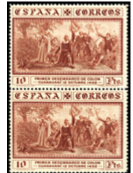
1582 70 €