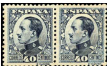
1569 30 €