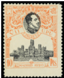
1462 100 €