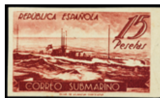
1760 75 €