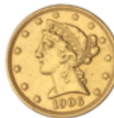
772 350 €