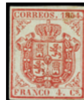
1133 30 €