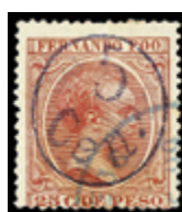
2574 30 €