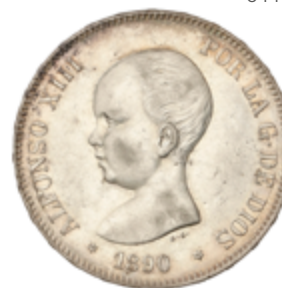
650 60 €