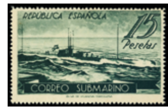
1753 80 €