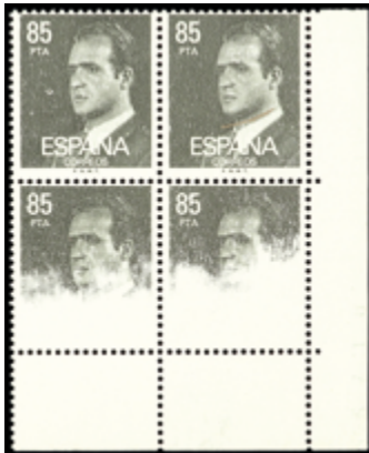
2039 80 €