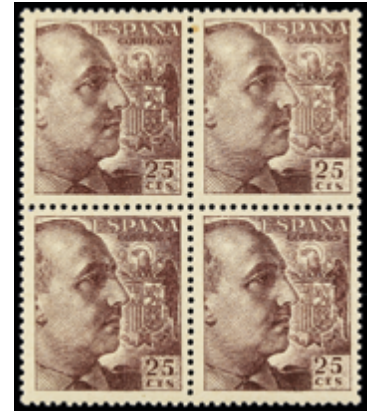
1927 50 €