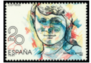
2067 25 €