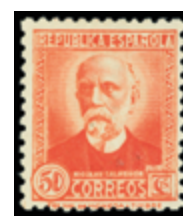
1643 30 €