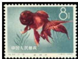
2796 150 €