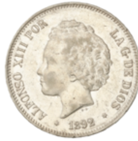
658 60 €