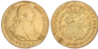
284 300 €