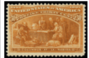
2845 40 €