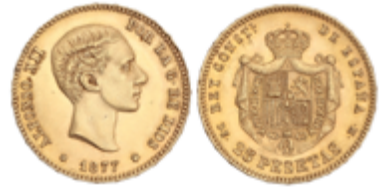
537 350 €