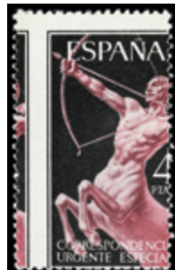
2005 15 €