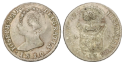
297 120 €