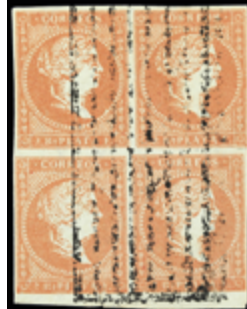
2555 20 €