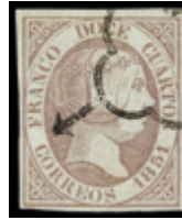
1053 40 €