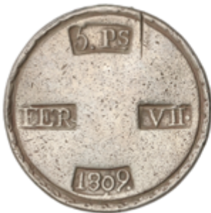
378 60 €