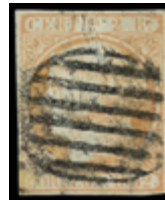
1084 700 €