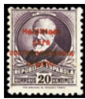
2360 25 €