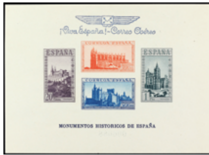
2337 30 €