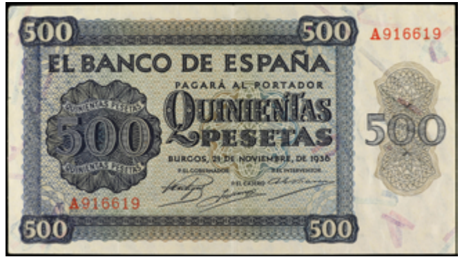
974 120 €