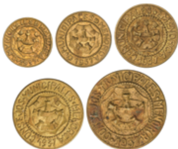
703 120 €