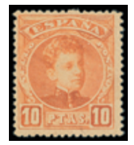
1410 200 €