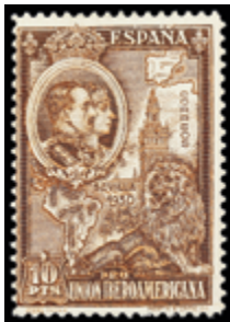
1593 40 €