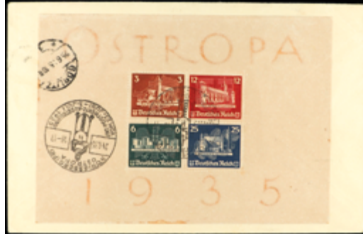
2718 300 €