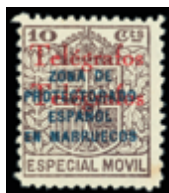
2662 70 €