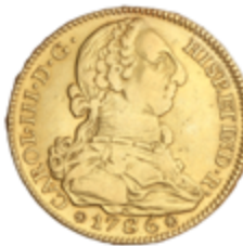
231 550 €