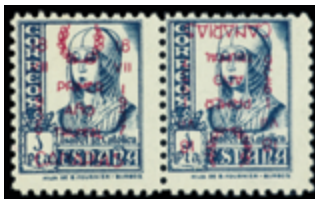
2363 70 €