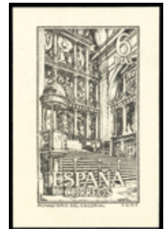
2015 30 €