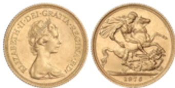
807 350 €