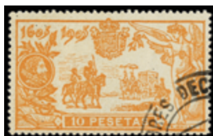
1424 60 €