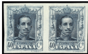
1483 25 €