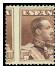
1497 130 €