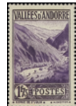
2888 35 €