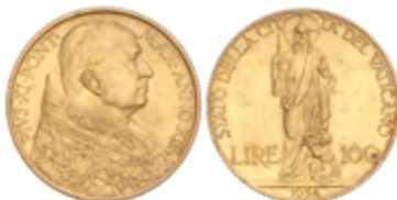
926 400 €