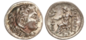
21 50 €