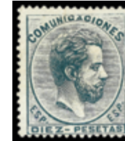
1277 200 €