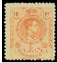
1441 60 €