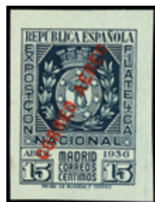
1685 50 €