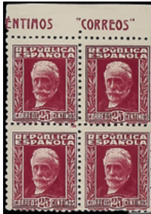
1650 50 €