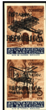
2141 300 €