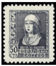
1838 30 €