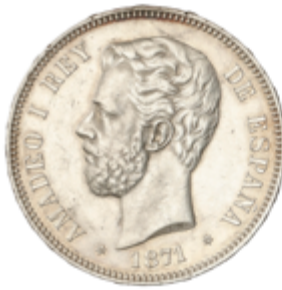
463 60 €