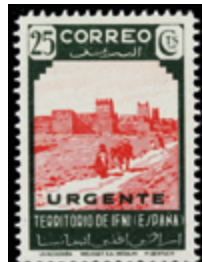
2637 25 €