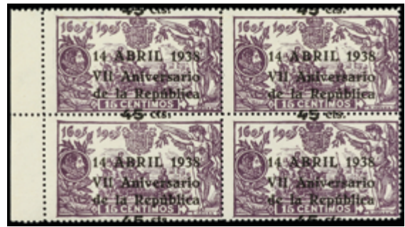
1720 25 €