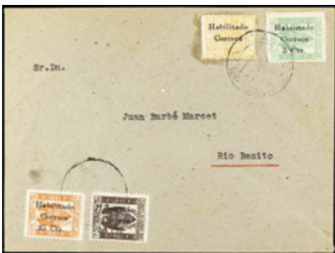
2616 40 €