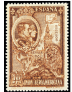
1600 40 €