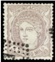
1269 100 €