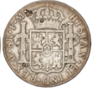
220 120 €