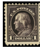
2847 40 €