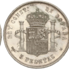
515 90 €