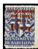
2198 100 €