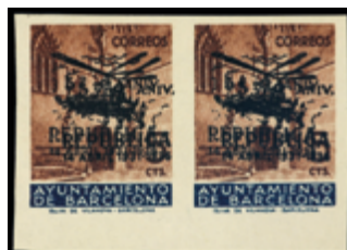
2145 250 €