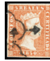
1034 30 €