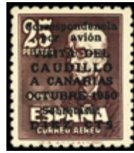
1961 80 €