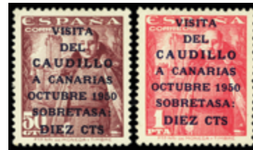
1944 120 €