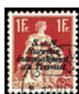
3106 40 €