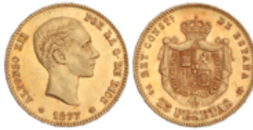
536 350 €