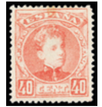
1401 50 €