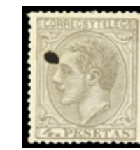
1354 50 €