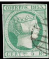
1104 20 €