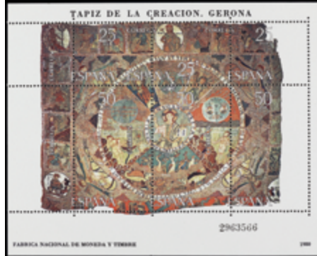
2036 75 €