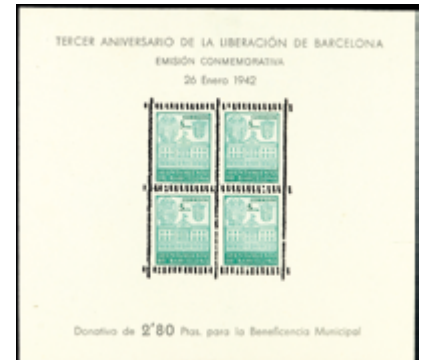
2162 40 €