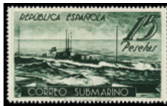
1752 100 €