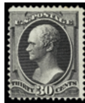
2844 100 €