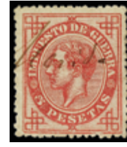
1340 30 €