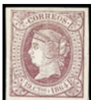
1223 75 €