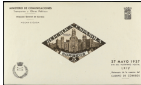
2211 80 €