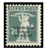
3105 300 €