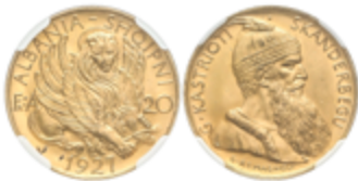
738 750 €