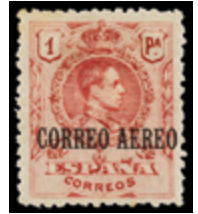
1458 20 €