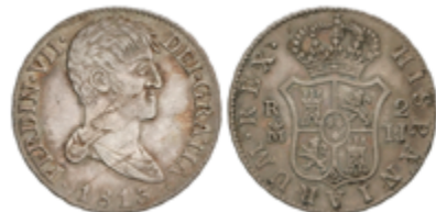
322 75 €