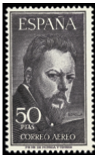
1983 150 €