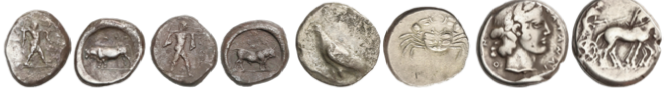
15 250 €