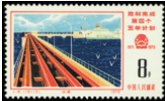
2810 40 €