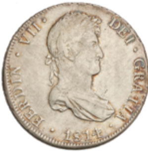
371 75 €