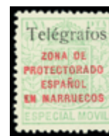
2664 50 €