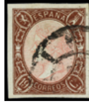
1241 180 €