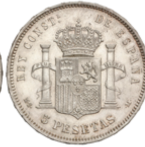
513 120 €