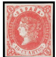
1218 50 €