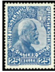
2997 30 €