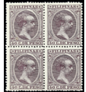
2594 40 €