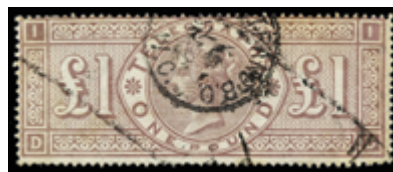
2907 100 €