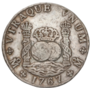
217 175 €