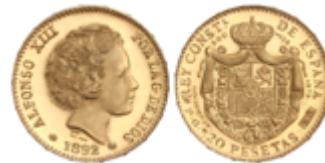
691 300 €