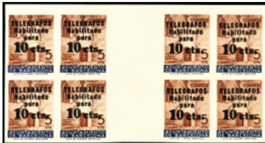
2190 60 €