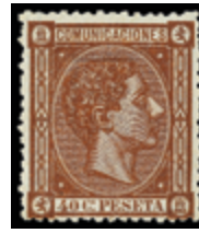
1323 30 €