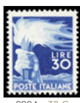
2984 30 €