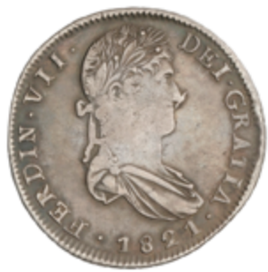
384 60 €