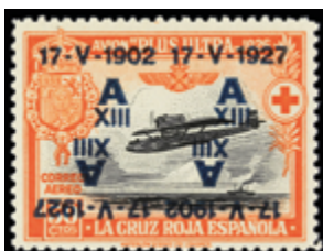
1524 20 €