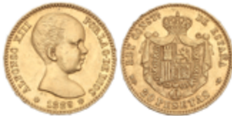
687 275 €