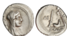
69 160 €