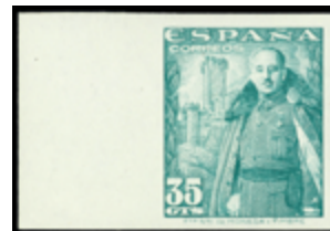
1920 250 €