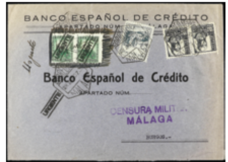
2355 40 €