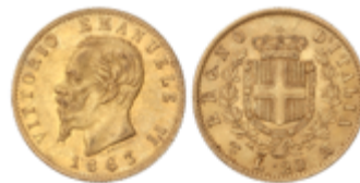
826 275 €