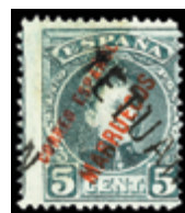
2641 25 €