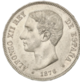
500 90 €