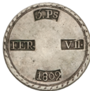
377 150 €