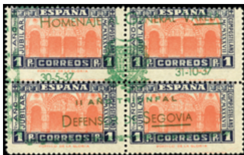
2366 60 €