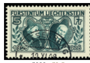
3000 70 €