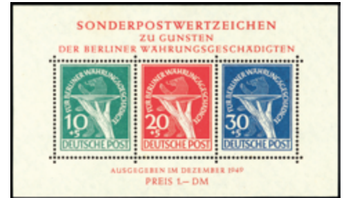
2744 50 €