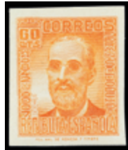
1693 50 €