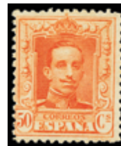
1486 30 €