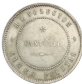
459 180 €