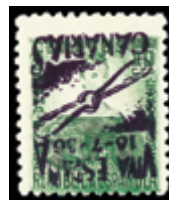
2361 30 €