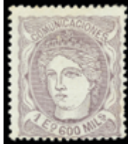
1274 125 €