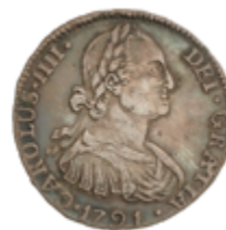
240 90 €