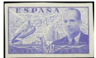
1855 40 €