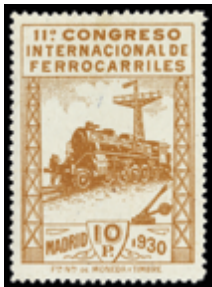
1553 200 €