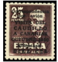
1963 60 €