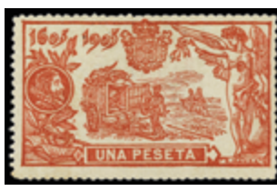
1416 250 €