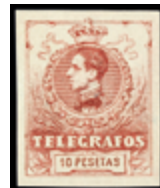
2281 35 €