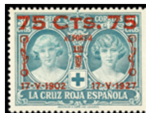
1527 90 €