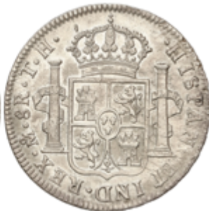
351 90 €