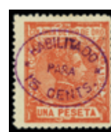
2684 75 €