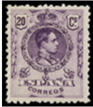
1449 25 €