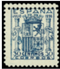
1778 250 €