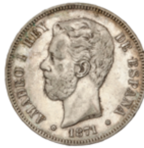
467 120 €