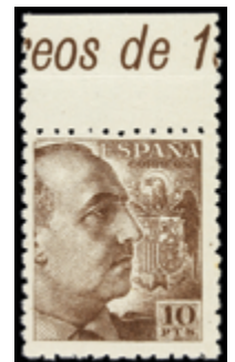
1861 125 €