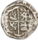
128 200 €