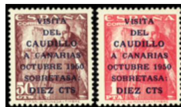
1955 40 €