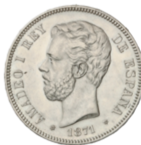
462 80 €