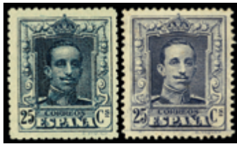
1502 50 €