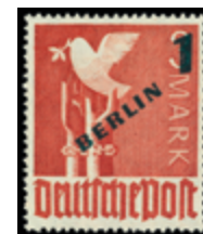
2740 30 €