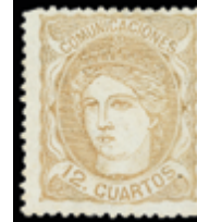
1276 30 €