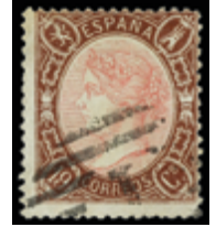
1243 225 €