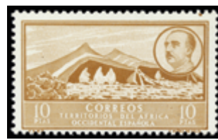
2531 20 €