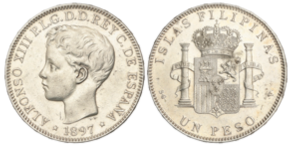
683 90 €