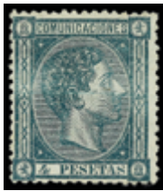
1326 90 €