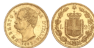
831 300 €