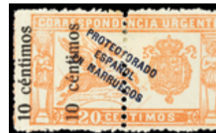
2644 30 €