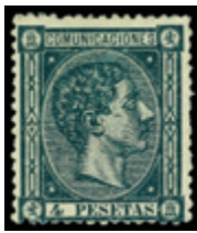
1327 90 €