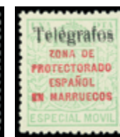
2665 90 €