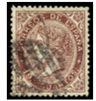
1265 60 €