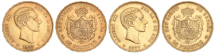
540 975 €