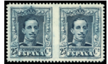
1504 180 €