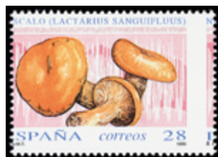
2076 20 €