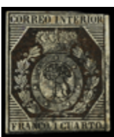
1111 30 €