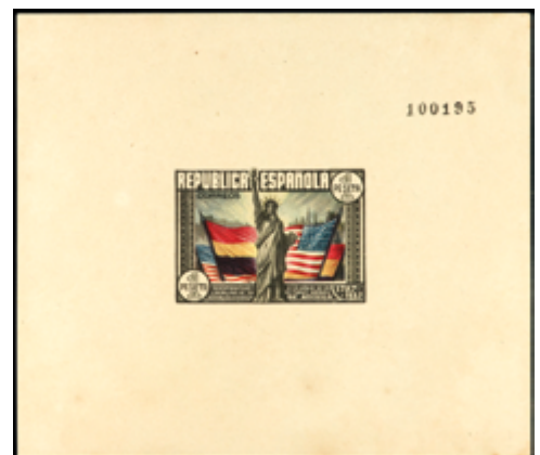
1739 90 €