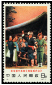
2804 75 €