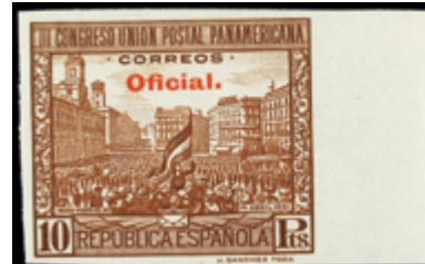
1622 50 €