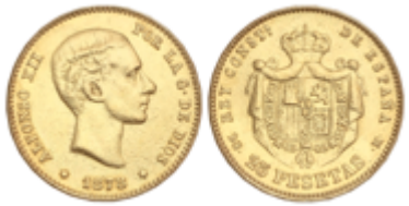
550 325 €