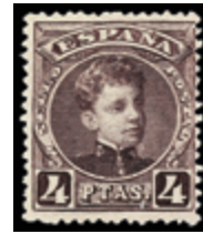
1408 40 €