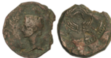
44 60 €