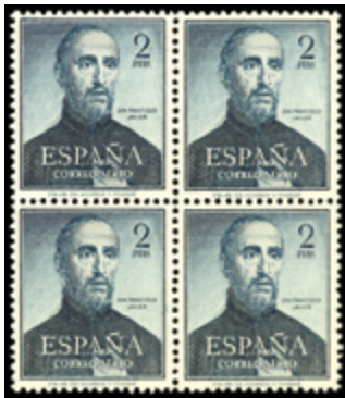
1976 60 €