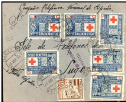
1795 60 €