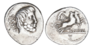
72 60 €