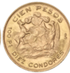
755 900 €