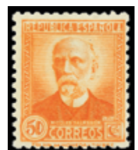
1645 20 €