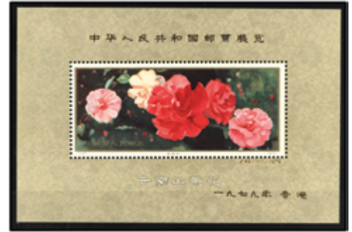
2814 90 €