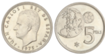
717 90 €