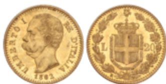
828 275 €