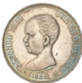
643 60 €