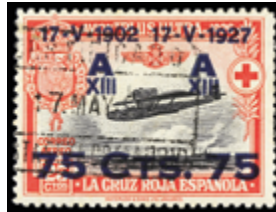
1533 25 €