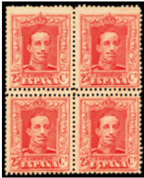
1473 80 €