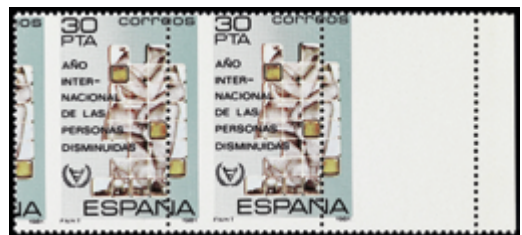
2046 25 €