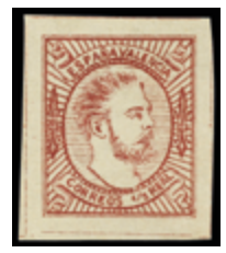
1309 40 €