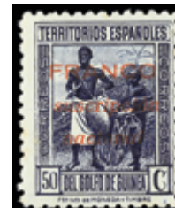
2629 30 €