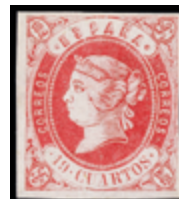
1205 50 €