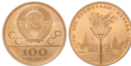
872 775 €