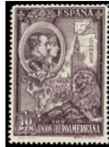
1597 50 €