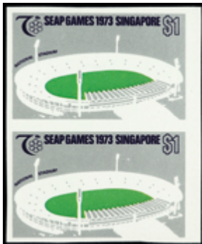
3091 50 €