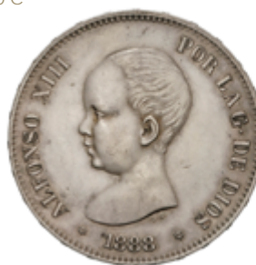
644 60 €