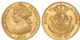
439 375 €