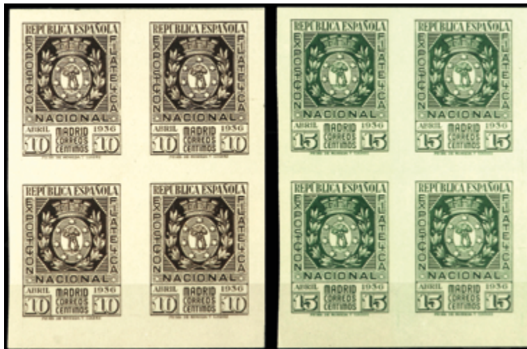
1683 180 €