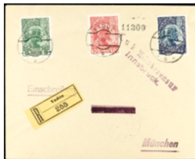
2998 45 €