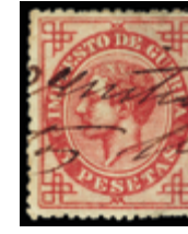
1341 40 €