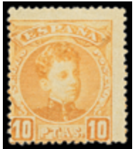
1411 60 €