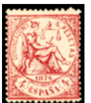
1293 100 €