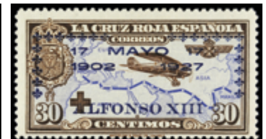
1523 20 €