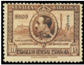
2686 20 €