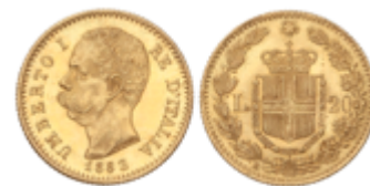
829 275 €