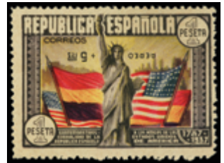
1746 65 €