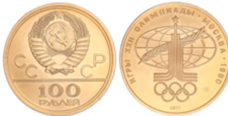
869 775 €