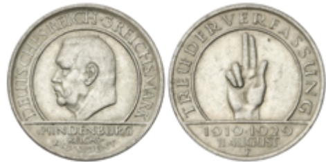
739 30 €