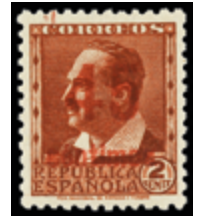
1708 25 €