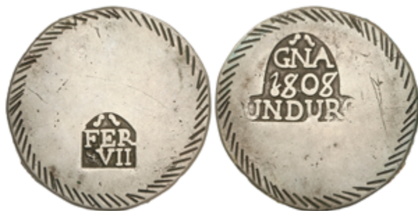
343 120 €