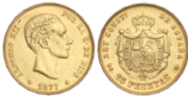
539 325 €