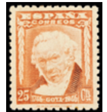
1908 30 €