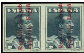
1616 35 €