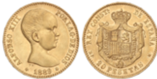
688 300 €