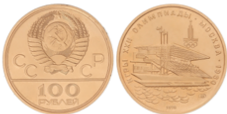
870 775 €