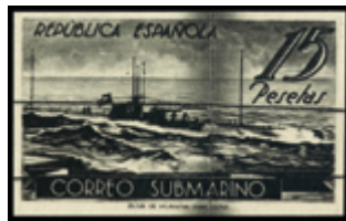
1756 50 €