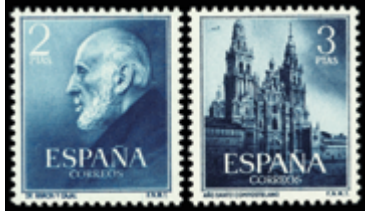
1979 20 €