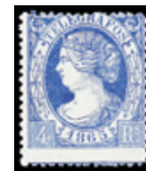
2275 25 €