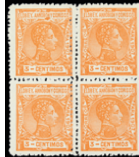
2570 25 €