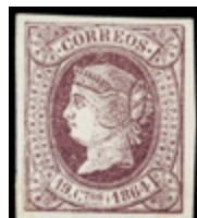
1230 50 €