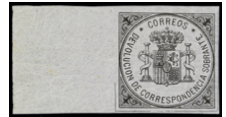
1330 40 €