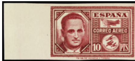
1900 75 €