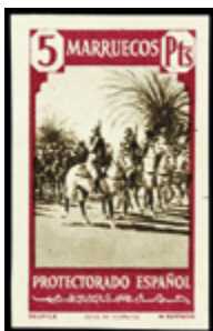
2658 30 €