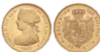
441 350 €