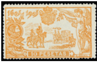
1439 75 €