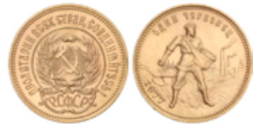
867 390 €