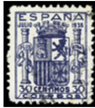
1779 40 €