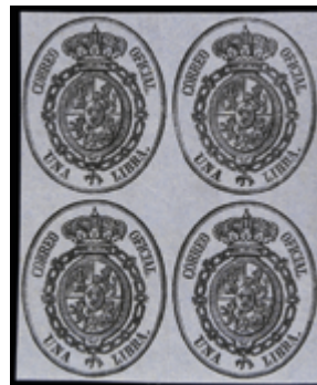
1142 40 €