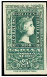
1935 120 €