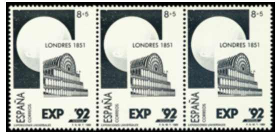
2069 60 €