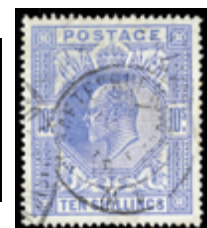
2911 40 €