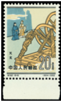
2799 30 €