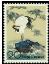
2797 45 €