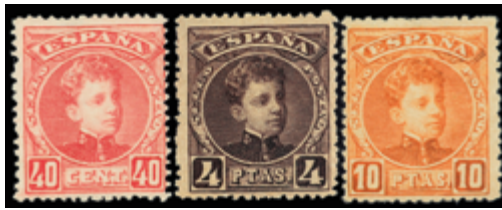
1388 130 €