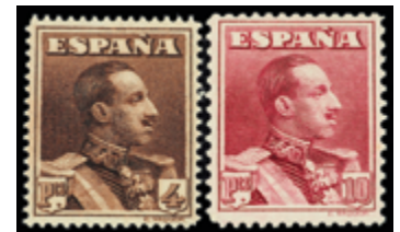
1487 40 €