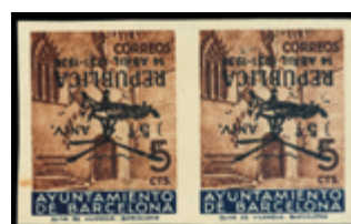
2146 300 €