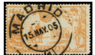
1423 60 €