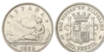
451 120 €