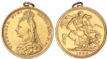
798 350 €