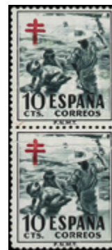
1972 20 €