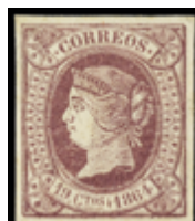
1231 50 €