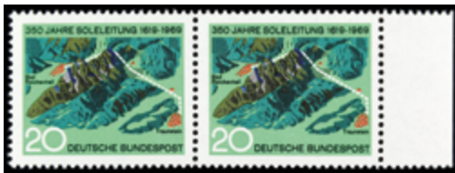
2727 20 €