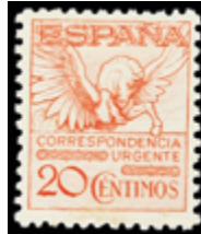
1658 30 €