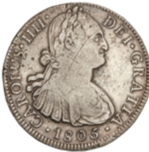
265 60 €