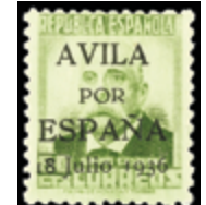
2328 25 €