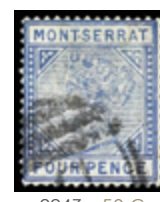
2943 50 €