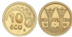
735 140 €