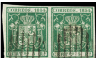
1123 25 €