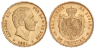
588 350 €