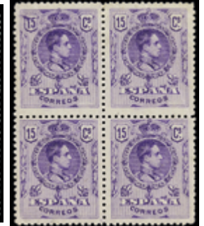
1445 40 €