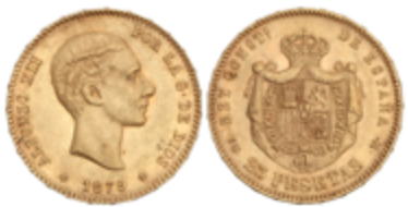
558 350 €