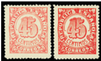
1712 25 €