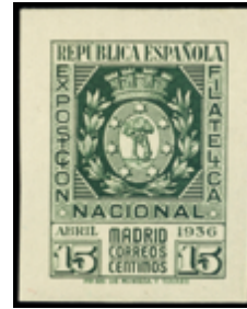
1680 35 €