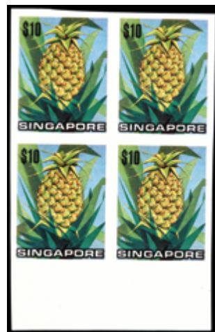
3092 150 €