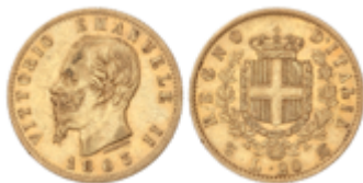
825 275 €