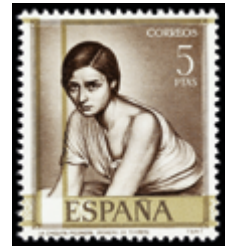
2030 25 €