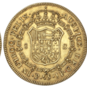
389 850 €