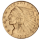
769 120 €