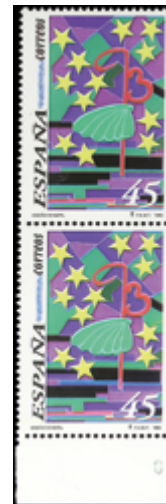
2077 15 €