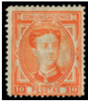
1333 40 €