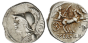
68 140 €