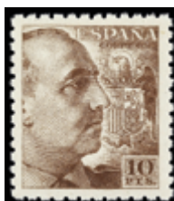
1862 125 € .jpg