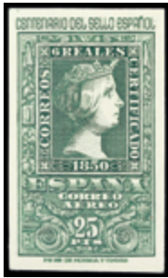
1933 120 €