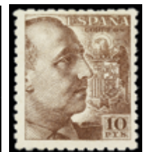
1883 50 € .jpg