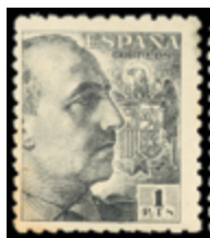
1864 45 € .jpg