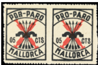
2315 25 €