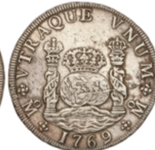
218 180 €