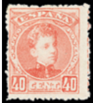
1403 60 €