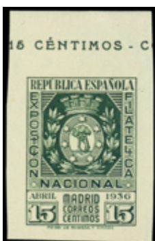
1682 30 €