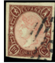
1242 90 €