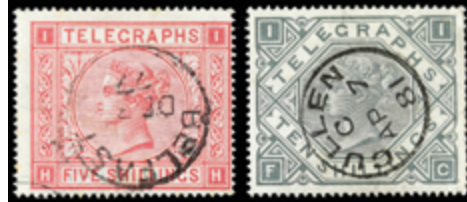
2918 25 €