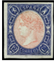
1239 140 €