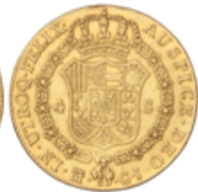
387 525 €