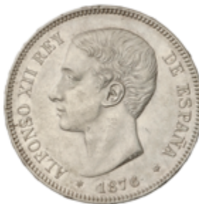
501 60 €