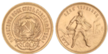
868 770 €