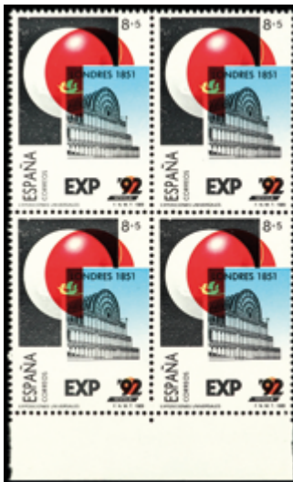
2071 50 €