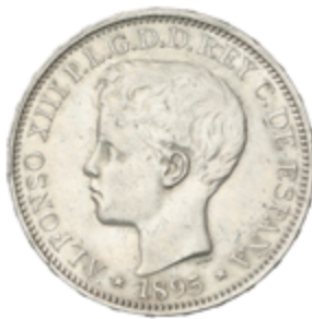
680 500 €