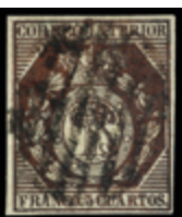
1113 50 €