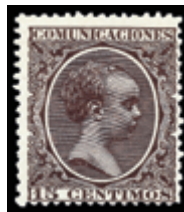
1373 50 €