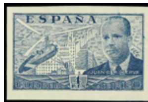
1853 80 €