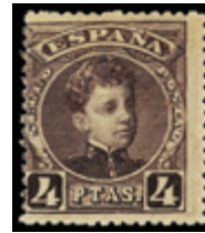
1389 100 €