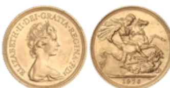
805 350 €