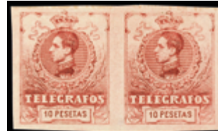
2282 45 €