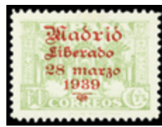
2350 20 €