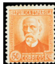
1639 100 €