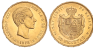
545 350 €