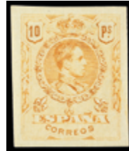
1455 50 €