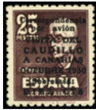
1960 80 €