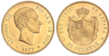
535 325 €