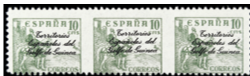
2614 30 €