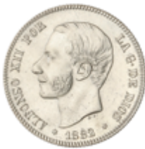
492 60 €