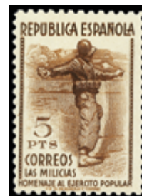
1767 120 €