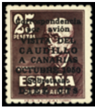
1958 130 €