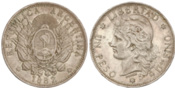
742 120 €