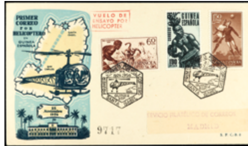
2634 15 €