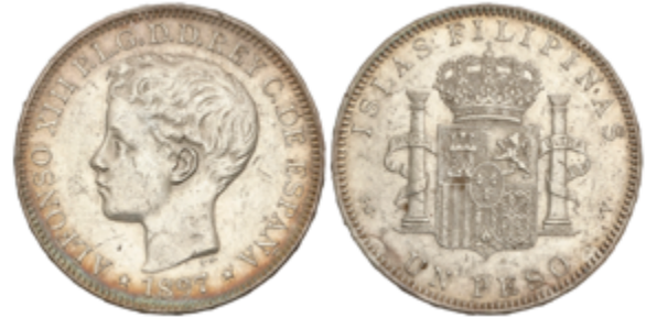
686 90 €