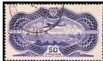
2879 40 €