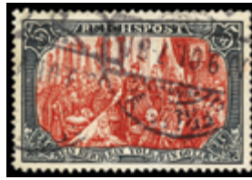
2717 25 €