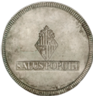
349 120 €