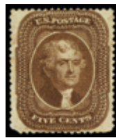
2843 50 €