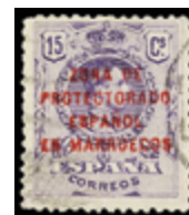
2643 30 €