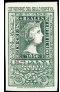
1939 60 €