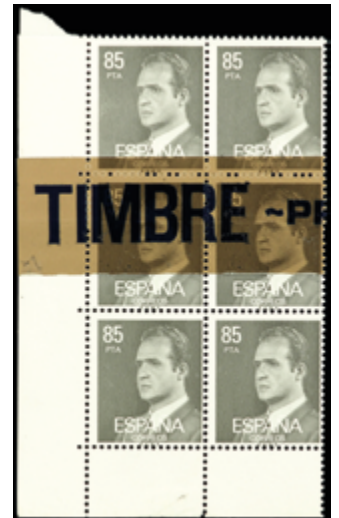
2043 150 €