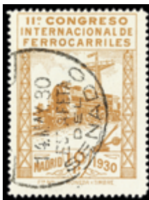
1560 70 €