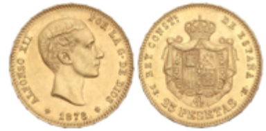
552 350 €