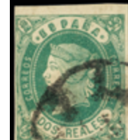
1206 35 €