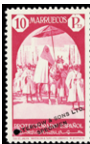
2654 35 €