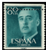
2000 20 €