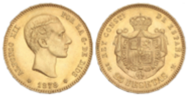
553 350 €