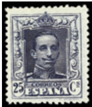
1501 75 €