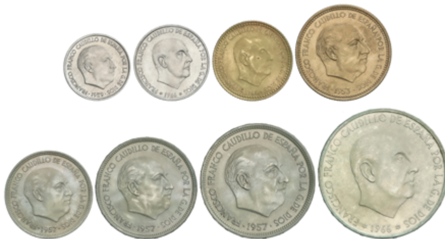
713 75 €