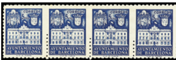
2158 25 €