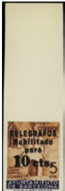
2188 20 €