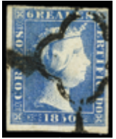
1036 100 €