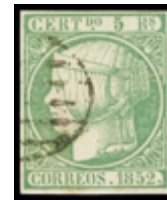
1086 25 €