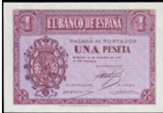
946 125 €