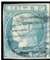
1089 50 €