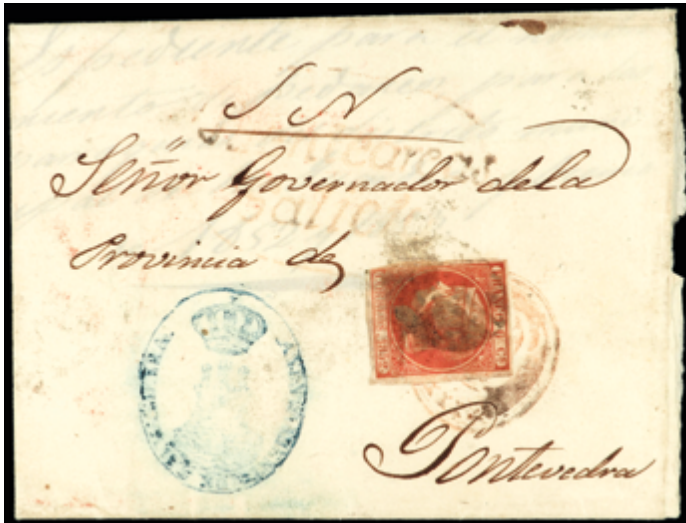
1075 900 €