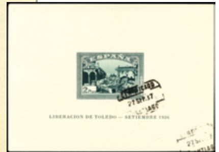
1805 120 €