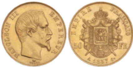
793 700 €