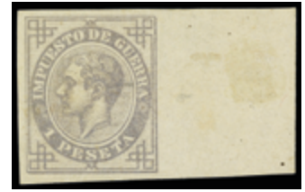
1325 60 €