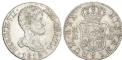
321 60 €