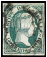
1068 40 €