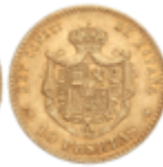
523 150 €