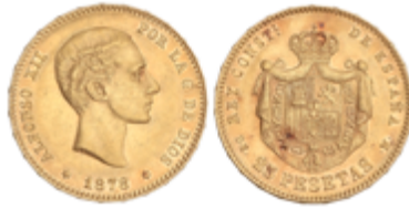
548 325 €