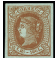
1234 35 €