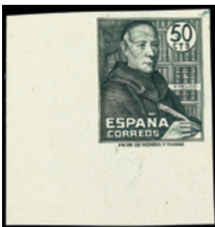
1909 18 €