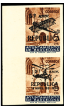
2139 70 €