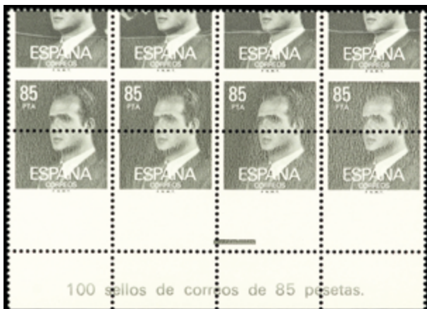
2042 400 €