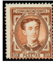
1338 130 €