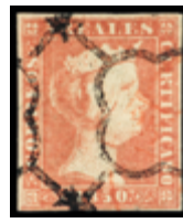
1032 40 €