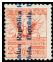
1610 50 €