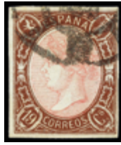
1238 125 €