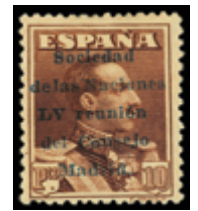
1550 60 €