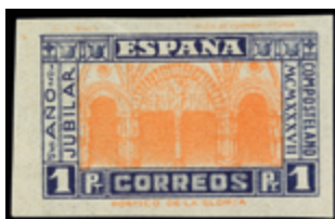
1796 40 €