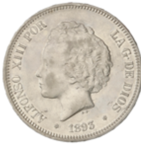
664 120 €