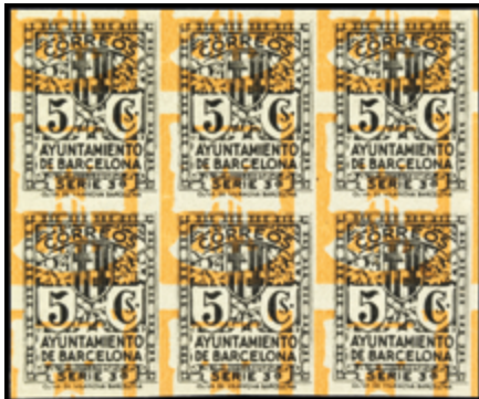
2130 30 €