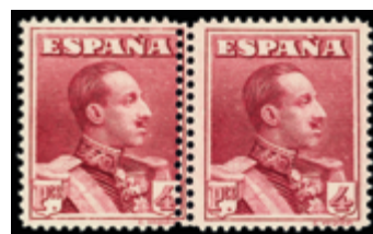
1491 60 €