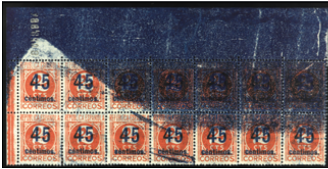
1707 50 €