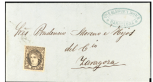
1271 20 €