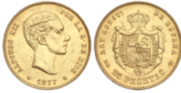
538 325 €