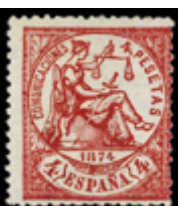
1294 40 €