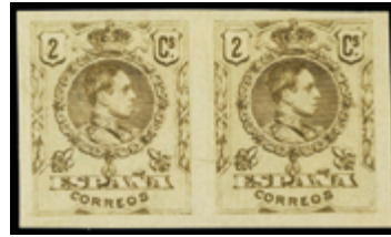
1444 50 €