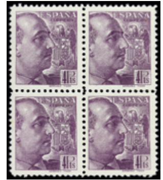
1848 140 €