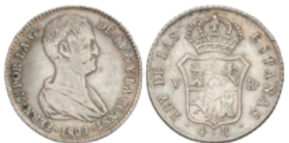
337 75 €