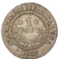
424 120 €