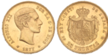
533 350 €