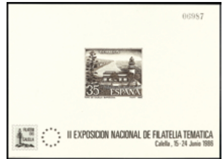
2098 150 €