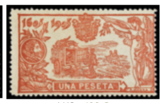
1418 100 €