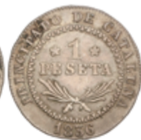
423 150 €