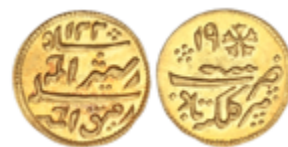
812 450 €