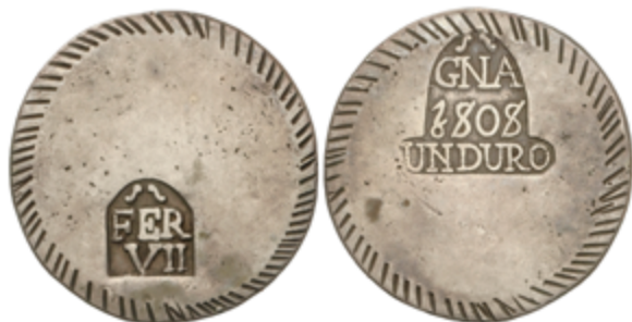
342 150 €