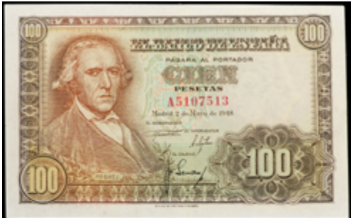
972 160 €