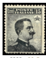
2982 80 €