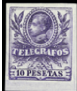
2278 20 €