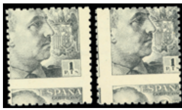
1881 30 €