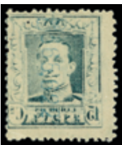
1478 40 €