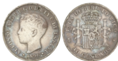
640 100 €