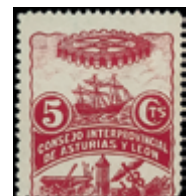
2124 35 €