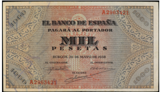
975 150 €