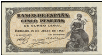
955 75 €