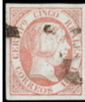
1062 50 €