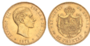
559 350 €