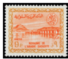
2769 30 €