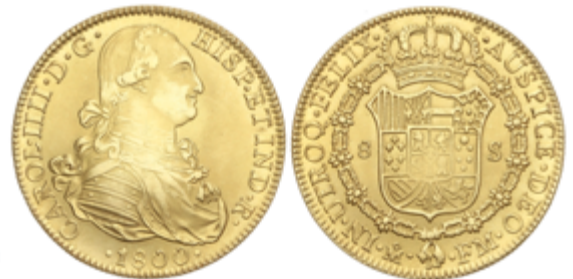
285 950 €