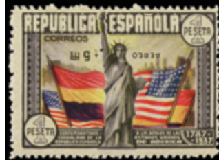
1745 75 €