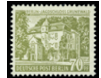
2742 30 €