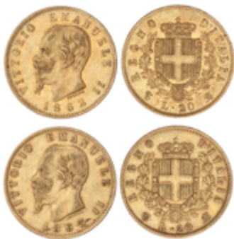
827 550 €