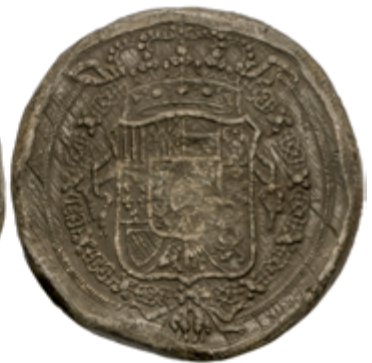
390 60 €