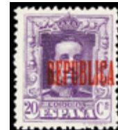
2286 50 €