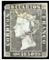
1024 120 €