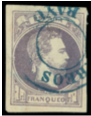
1302 40 €