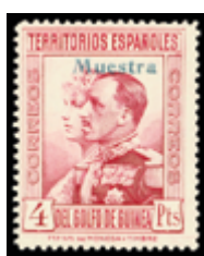
2607 20 €