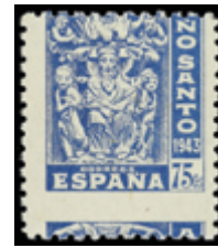
1891 20 €