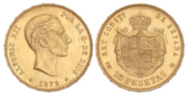
560 350 €