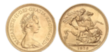
806 350 €