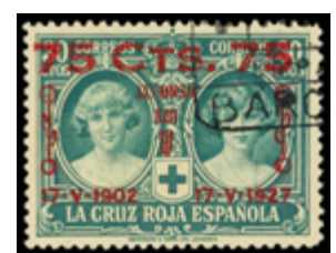
1529 50 €