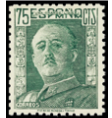
1904 20 €