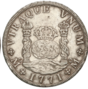
219 180 €