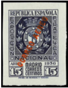
1689 75 €