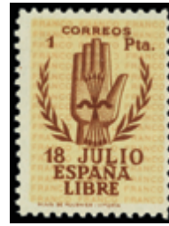
1836 85 €