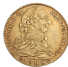
232 600 €