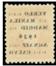
1699 20 €