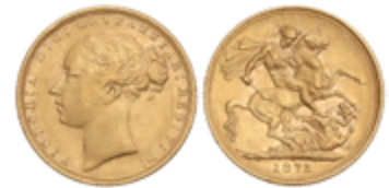
797 350 €