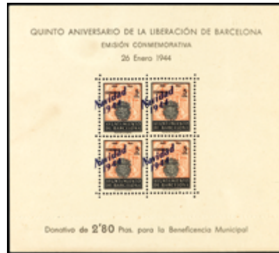
2177 30 €