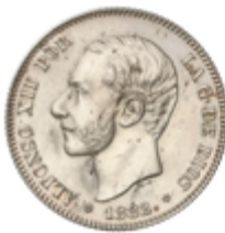
491 60 €