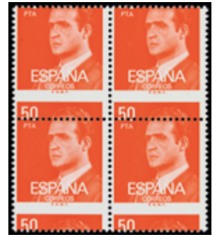
2037 30 €