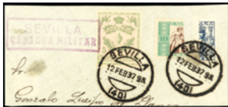
1780 30 €