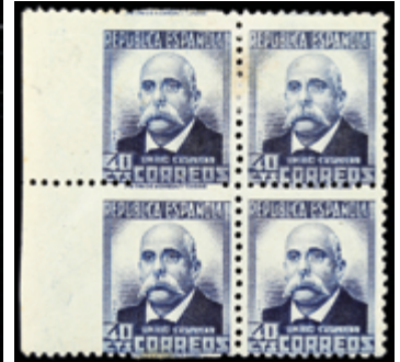
1653 30 €