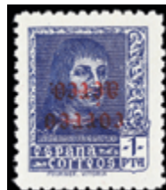
1825 40 €