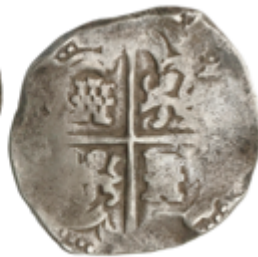
150 165 €