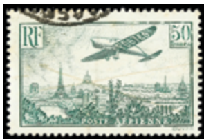
2878 30 €