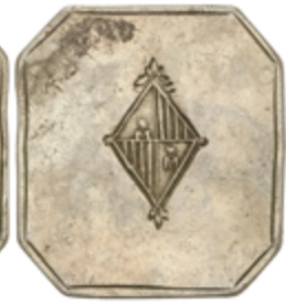
346 400 €