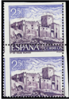
2031 15 €