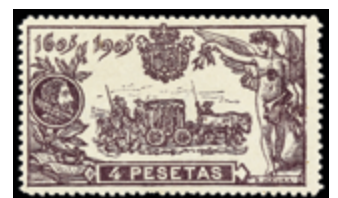
1438 15 €