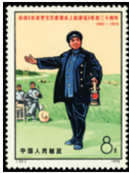
2806 40 €