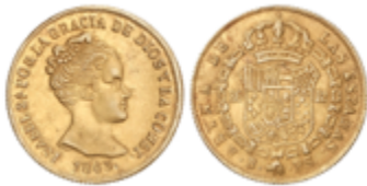
435 230 €