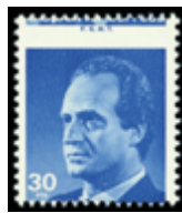
2059 40 €