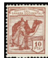
2685 25 €