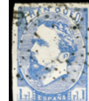
1297 60 €