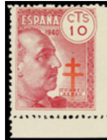
1884 35 €