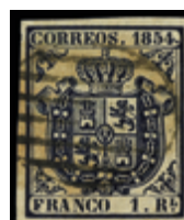
1135 60 €