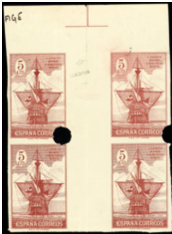
1585 40 €