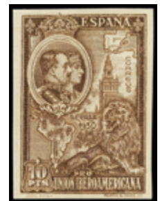
1565 40 €