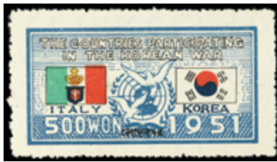
2827 80 €