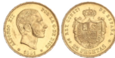
586 350 €