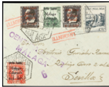
2351 25 €