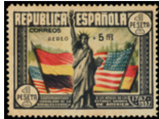
1743 45 €