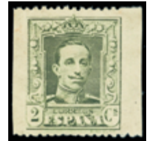
1474 40 €