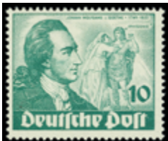
2741 30 €