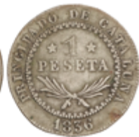
422 150 €