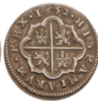
148 75 €