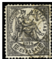
1287 150 €