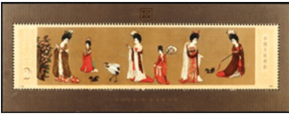
2816 45 €