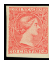
1378 50 €