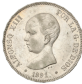
654 90 €