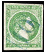
1311 20 €