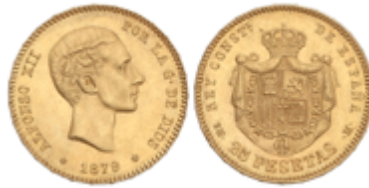
562 350 €