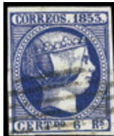
1107 60 €