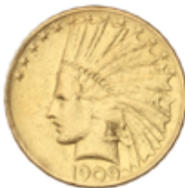
775 750 €