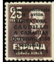
1962 60 €