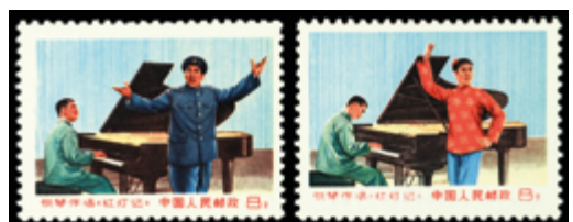
2803 50 €