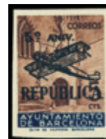
2137 50 €