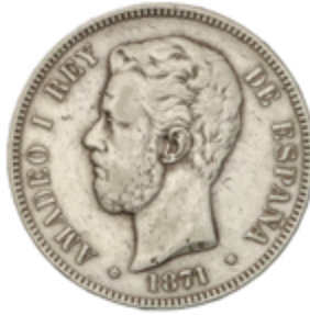
468 200 €