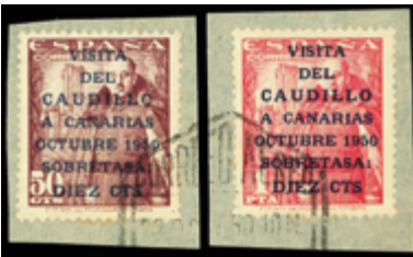
1947 90 €