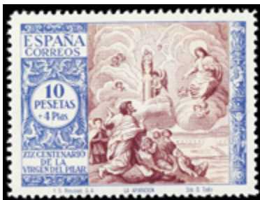
1856 100 €