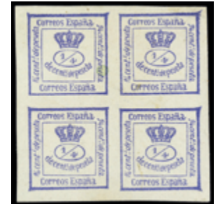
1278 30 €