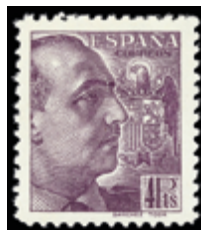
1846 60 €