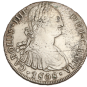
249 60 €