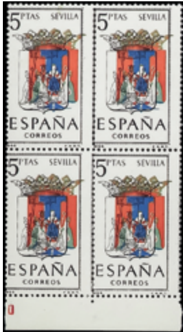
2027 40 €