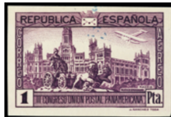
1621 40 €