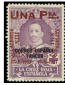
1535 175 €