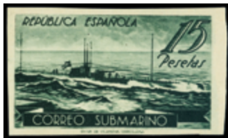
1754 100 €