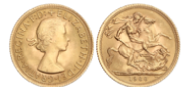
803 350 €