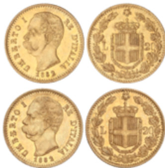
832 550 €