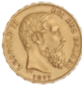
753 280 €