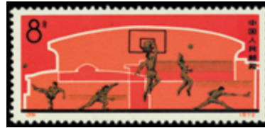
2807 30 €