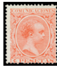
1375 90 €