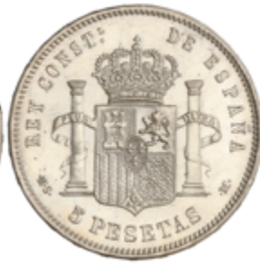
517 100 €