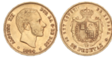
600 375 €