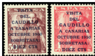
1953 35 €