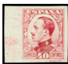
1573 150 €