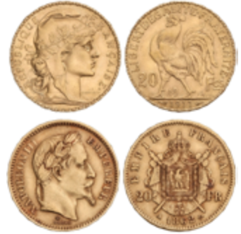
792 500 €