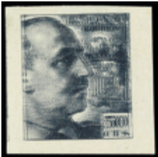
1874 50 €