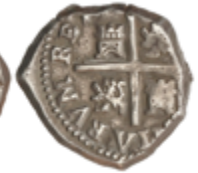
146 160 €