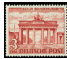
2739 60 €