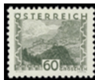
2771 20 €