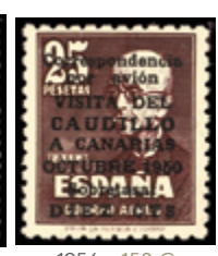
1956 150 €