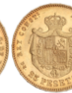
529 350 €