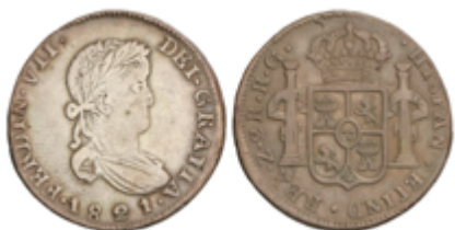
338 60 €