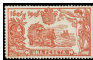
1432 75 €