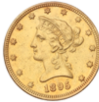
773 750 €