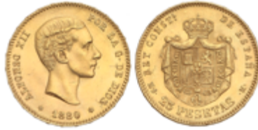
565 350 €