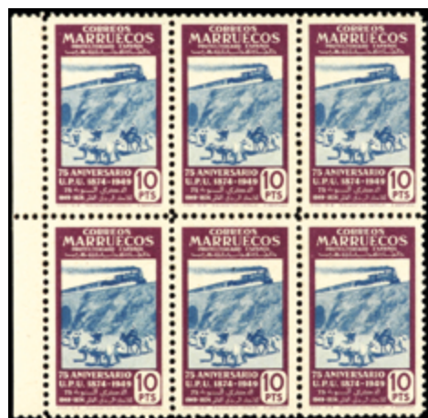
2659 100 €