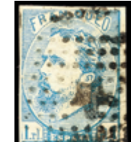
1300 40 €