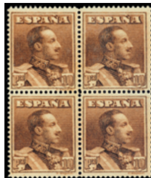
1496 100 €