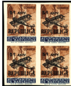
2138 180 €