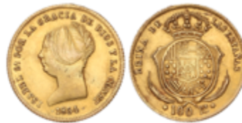
437 240 €