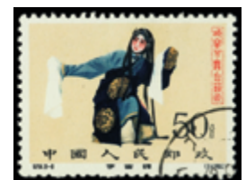
2798 50 €