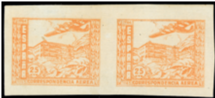
1898 60 €