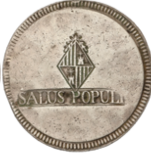
347 150 €