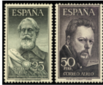
1981 170 €