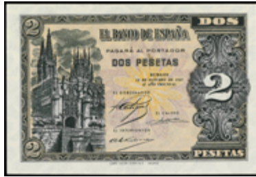
952 175 €