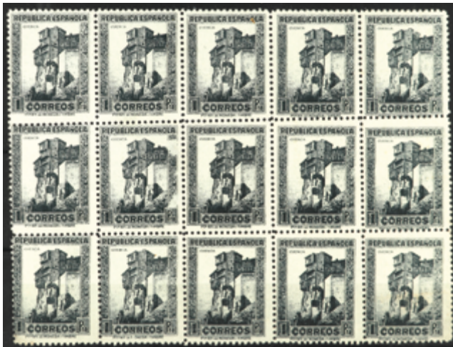
1655 375 €