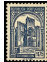
3049 25 €