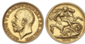
796 130 €