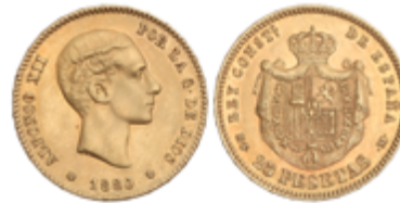
568 350 €