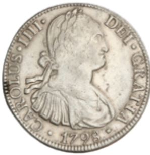
254 60 €