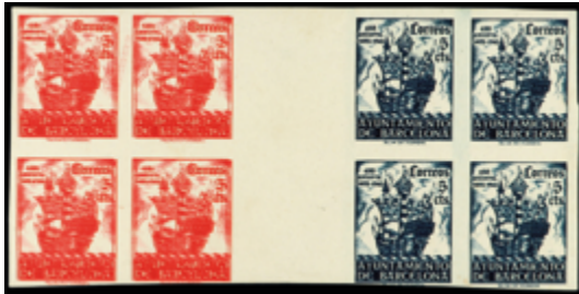
2170 50 €