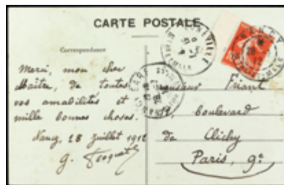
2864 30 €