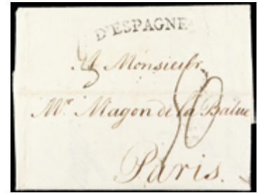
2863 25 €