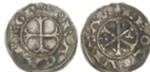
86 400 €