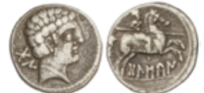
47 100 €