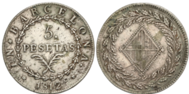
296 300 €