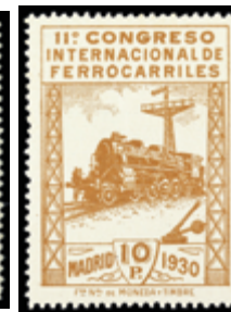
1557 100 €