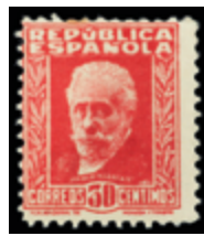
1652 45 €