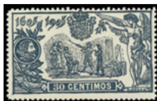
1429 30 €