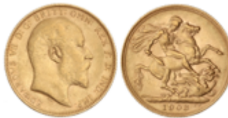
799 350 €