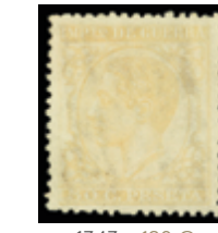
1343 120 €