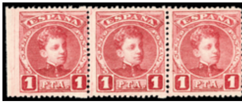
1407 20 €