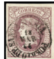
1233 45 €