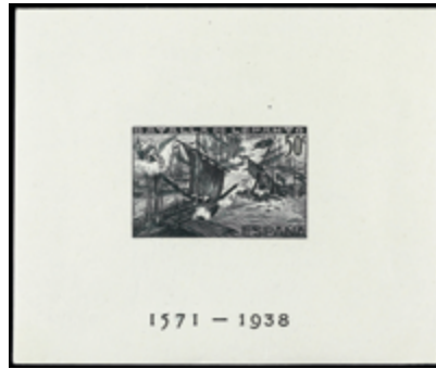
1843 200 €