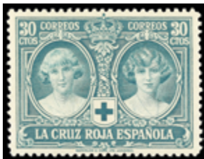
1506 75 €