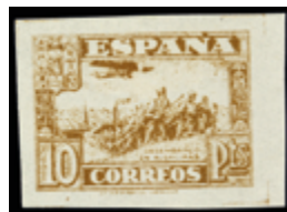
1784 60 €