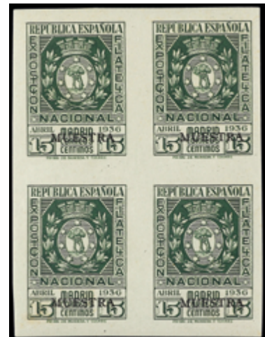
1686 90 €