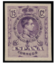
1446 35 €