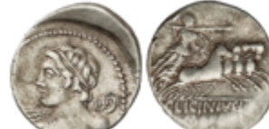
64 80 €