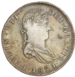
383 60 €