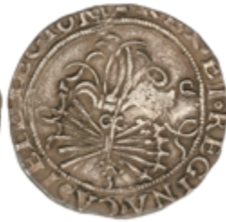
127 90 €