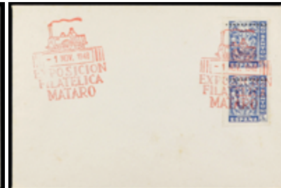
1892 35 €