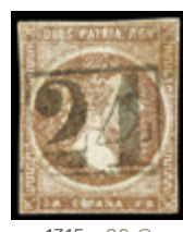
1315 20 €