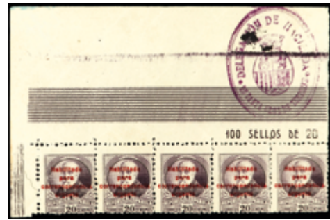
2359 40 €