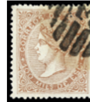
1260 30 €