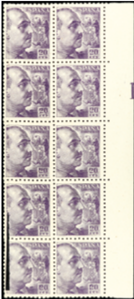
1869 60 €