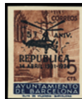
2136 30 €