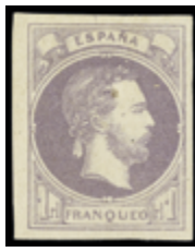
1303 90 €