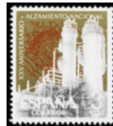
2014 50 €