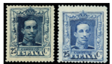
1500 80 €