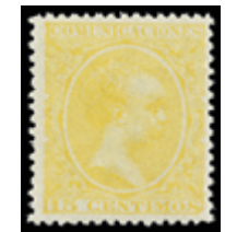
1379 15 €