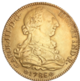
233 950 €