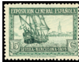
1542 28 €