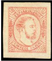
1308 40 €