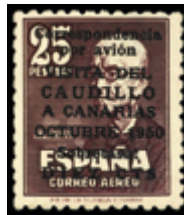
1943 400 €