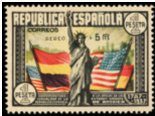
1742 70 €