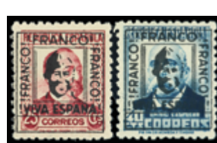
2339 80 €