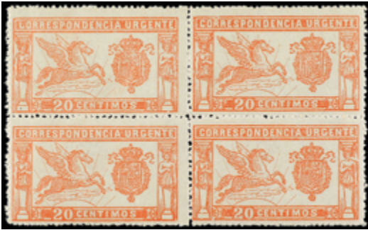
1413 75 €