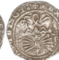
126 75 €