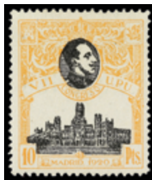
1463 75 €