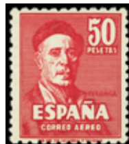
1910 45 €