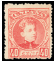
1404 40 €