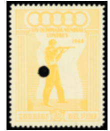
3042 60 €