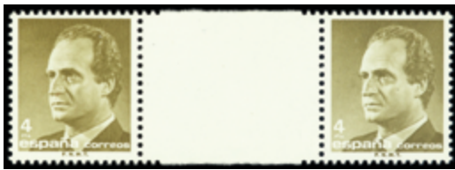
2055 25 €