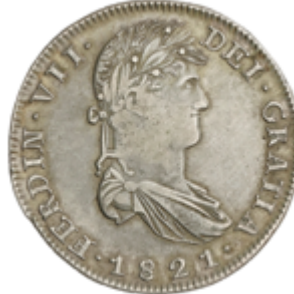
381 80 €