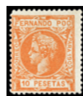
2580 75 €