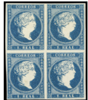
1179 25 €