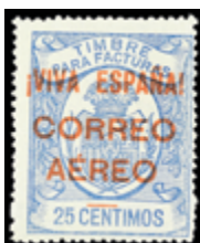
2334 20 €