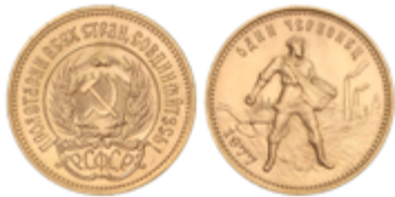
865 390 €