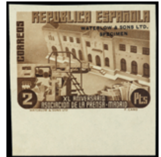
1673 20 €