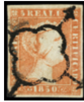
1031 60 €