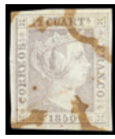
1030 30 €