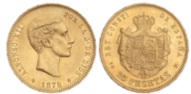
555 350 €