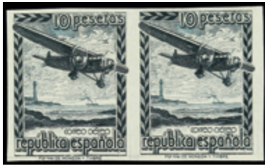
1771 40 €