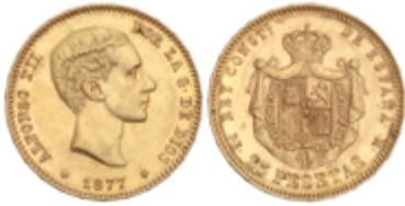
532 350 €