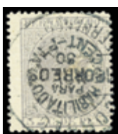
2572 30 €