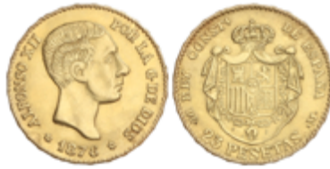
551 275 €