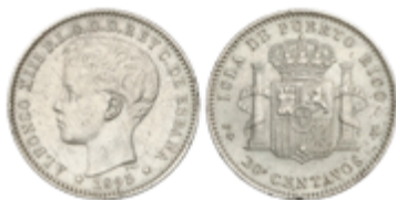
630 75 €