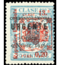
2333 20 €