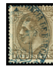
1349 30 €