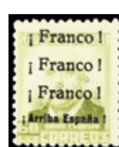
2342 15 €