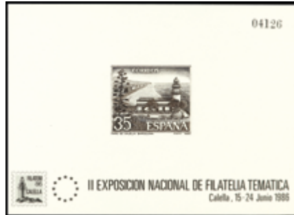
2097 150 €