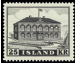
2973 25 €