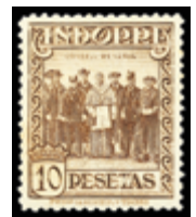
2533 40 €