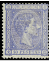
1329 90 €