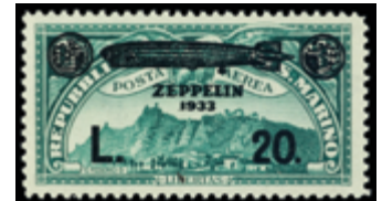
3087 120 €