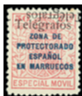
2666 35 €