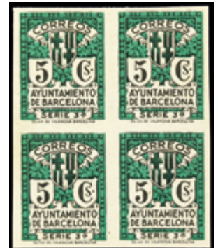
2129 30 €