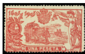
1420 100 €