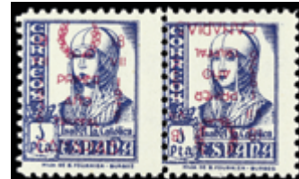
2362 30 €