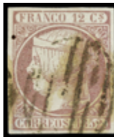
1080 40 €