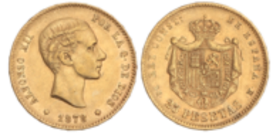
549 325 €