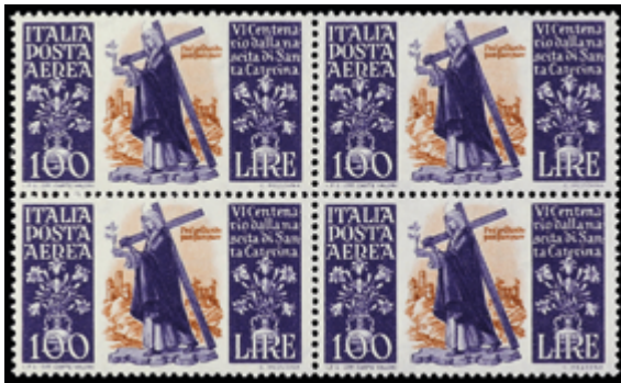
2985 75 €