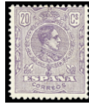
1457 20 €