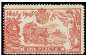
1419 100 €