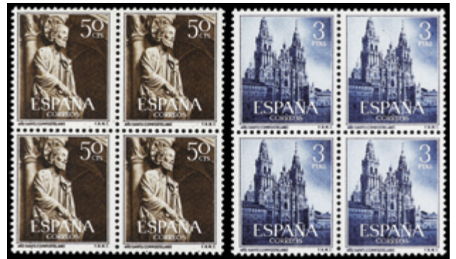
1995 40 €