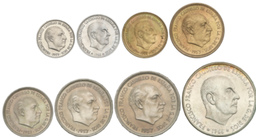
711 70 €