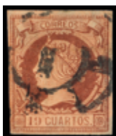
1184 120 €