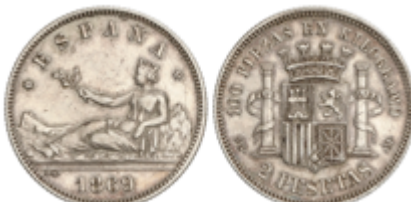
453 70 €