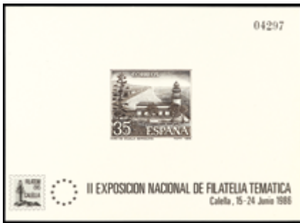
2096 180 €