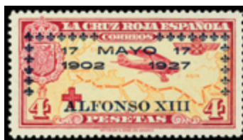
1520 60 €