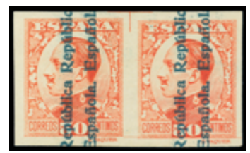
1615A 30 €