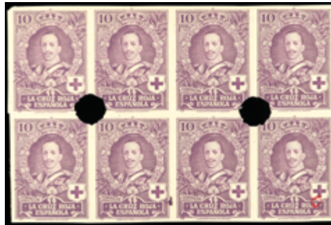
1512 75 €