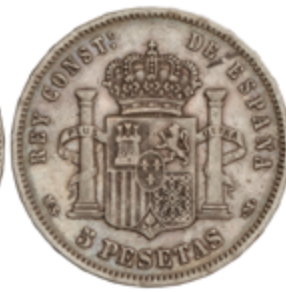
512 70 €