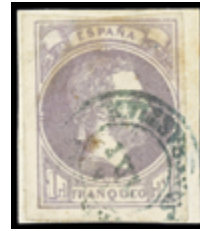
1307 70 €