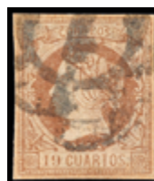
1198 175 €