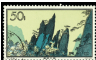
2800 40 €