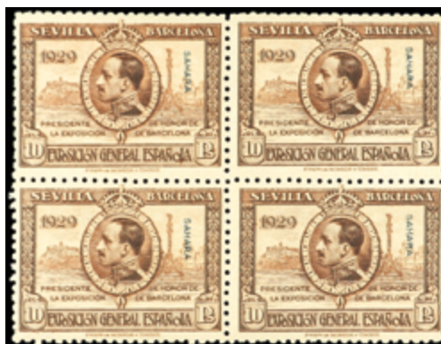
2687 80 €