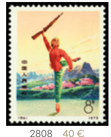
2808 40 €