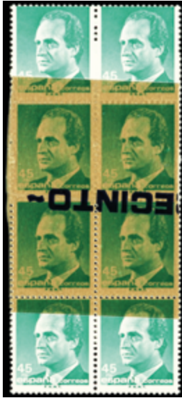
2048 150 €