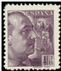
1845 55 €