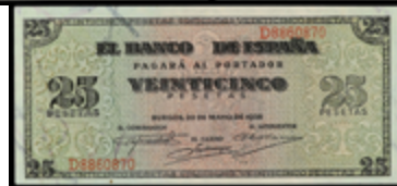
963 675 €