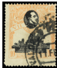
1464 40 €