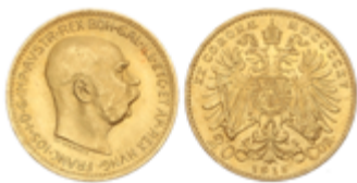
748 300 €