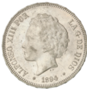
667 120 €