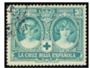
1511 25 €