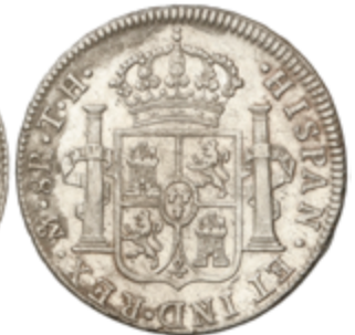
350 90 €