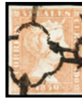
1033 30 €