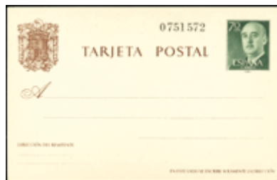
2221 50 €