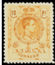
1453 50 €