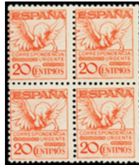
1657 50 €