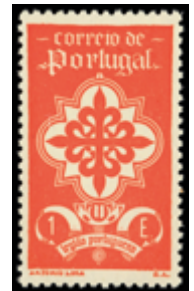
3051 25 €