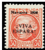
2358 15 €