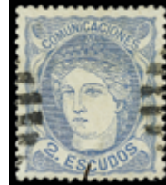
1275 40 €