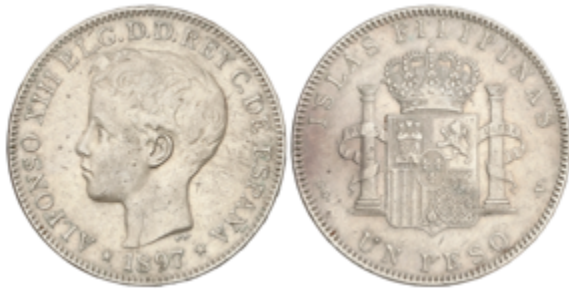
685 80 €