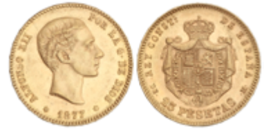
534 350 €