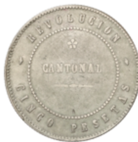
461 150 €