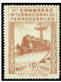
1554 150 €