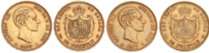
541 975 €