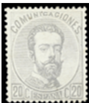
1282 35 €