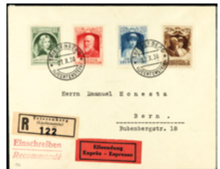
3001 40 €