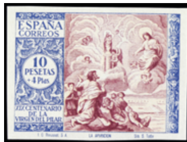
1857 50 €