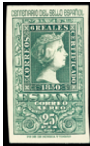
1941 70 €