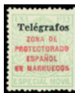
2663 200 €