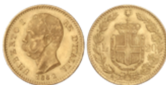
830 280 €