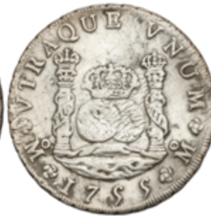
194 100 €