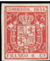
1114 125 €