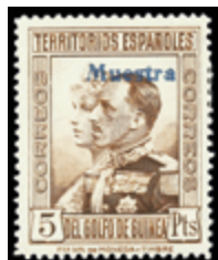
2606 15 €