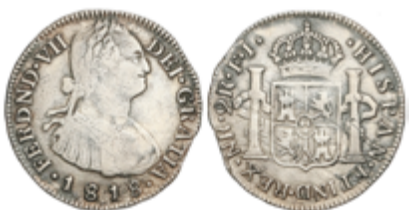
331 75 €