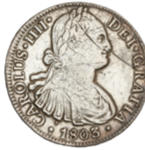
257 70 €