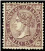
1257 20 €