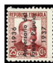
2330 40 €