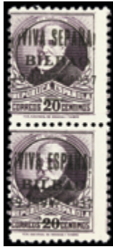
2331 25 €