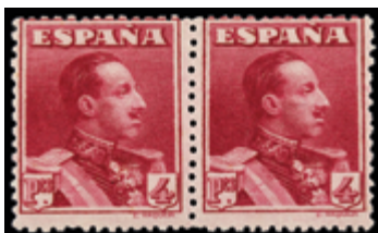
1488 50 €