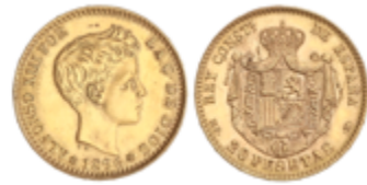
715 300 €