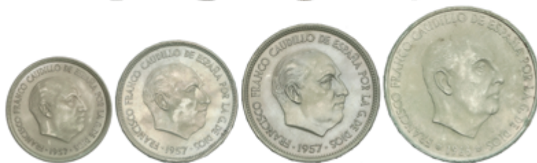
712 75 €