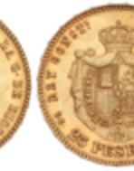
527 350 €