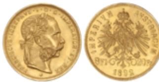
745 280 €