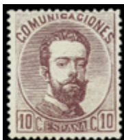
1281 50 €