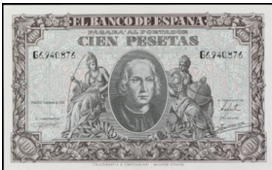
971 90 €