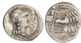
63 150 €