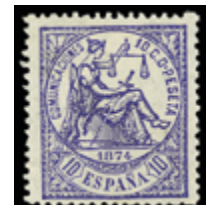
1291 20 €