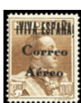
2335 35 €