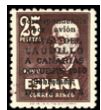
1957 120 €