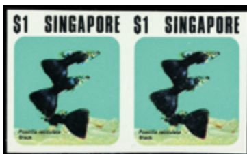
3093 50 €