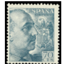
1925 15 €