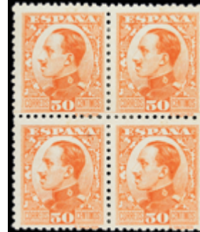
1570 40 €