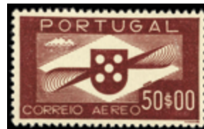
3063 80 €