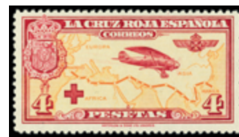
1515 25 €