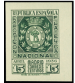
1681 35 €