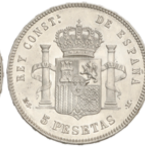
519 150 €