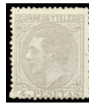
1348 80 €