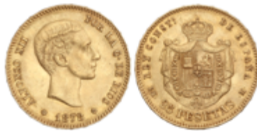
554 350 €