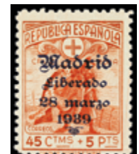
2349 30 €