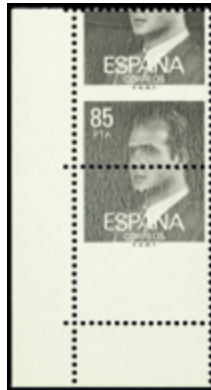
2040 150 €