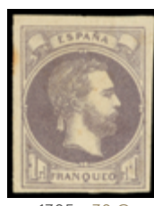
1305 30 €