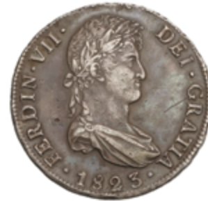
374 60 €