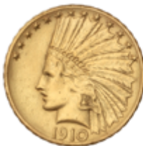
776 725 €