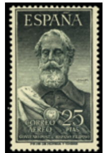
1992 30 €