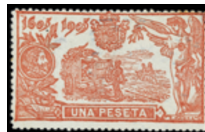
1421 90 €