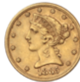
770 375 €