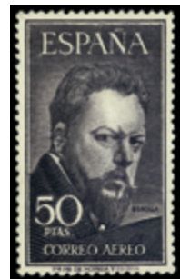
1984 75 €