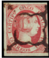
1060 40 €