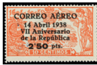
1721 40 €