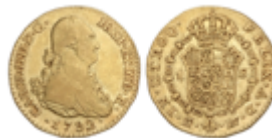
280 150 €