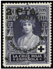
1530 40 €