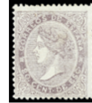
1254 30 €