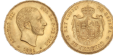
582 350 €