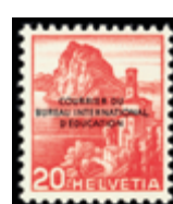
3107 45 €