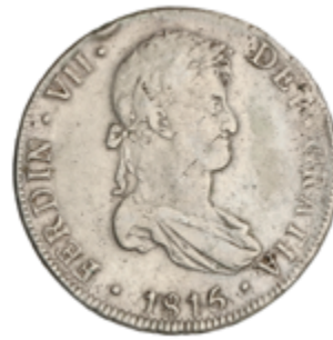
372 60 €