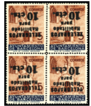
2186 35 €