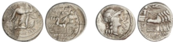
57 80 €