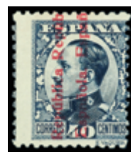
1618 40 €