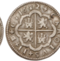
167 80 €