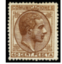
1345 30 €