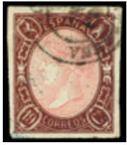
1237 100 €