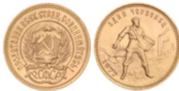
866 390 €