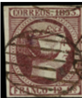
1098 30 €