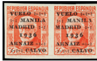
1700 40 €