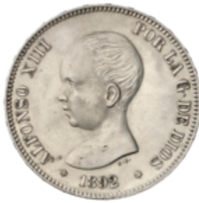
656 90 €